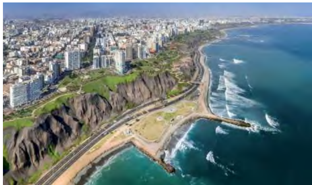
Lima, Perú, es uno de los destinos LATAM cerveceros.

En Argentina los amantes de la cerveza saben que octubre es el mes de su bebida favorita (a nivel global, el Día Internacional de la Cerveza fue el 2 de agosto) y aunque la principal celebración tiene lugar en Alemania, Booking.com, el líder digital que hace que conocer el mundo sea más fácil para todas las personas, presenta cuatro destinos en Latinoamérica en