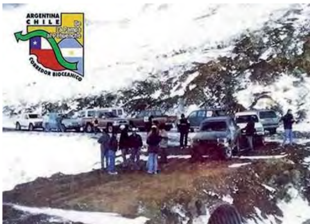
Carlos Medrano (fallecido en 2018): "Fuimos muchos y todos muy valiosos a la hora de transitar los caminos que un día llevarán el progreso ida y vuelta".

El domingo 16 de agosto, tras recorrer más de 800 kilómetros por caminos de tierra, médanos, ripio, tosca, arcilla y nieve entre La Pampa y Mendoza, el grupo que partió en caravana desde Santa Rosa llegó casi hasta el mismo límite con Chile, exactamente en el lugar en donde la Cordillera, a 2.500