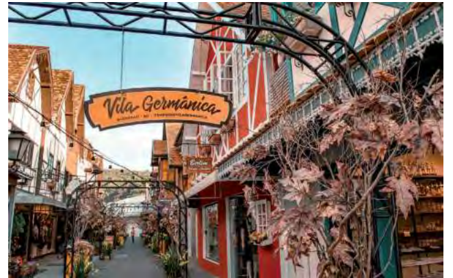
La versión brasileña del Oktoberfest, es en Blumenau, Santa Catarina, Brasil, la segunda fiesta más importante del mundo después de la de Alemania.

Si no conocés Lima, tenés que visitar la Plaza Mayor, la principal plaza de la ciudad, en donde está la Catedral y el Palacio de Pizarro, que datan del siglo XVI y ambos son exponentes típicos de la arquitectura colonial. Los viajeros de Booking.com recomiendan Lima por su comida y por su cultura.