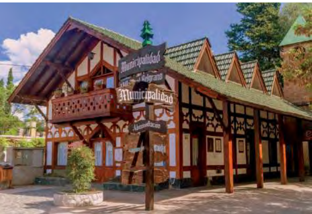
Villa General Belgrano, Córdoba, Argentina, es sede de la versión local del Oktoberfest, con la Fiesta Nacional de la Cerveza. En 2024: 4,5,6,11,12,13 y 14 de octubre.