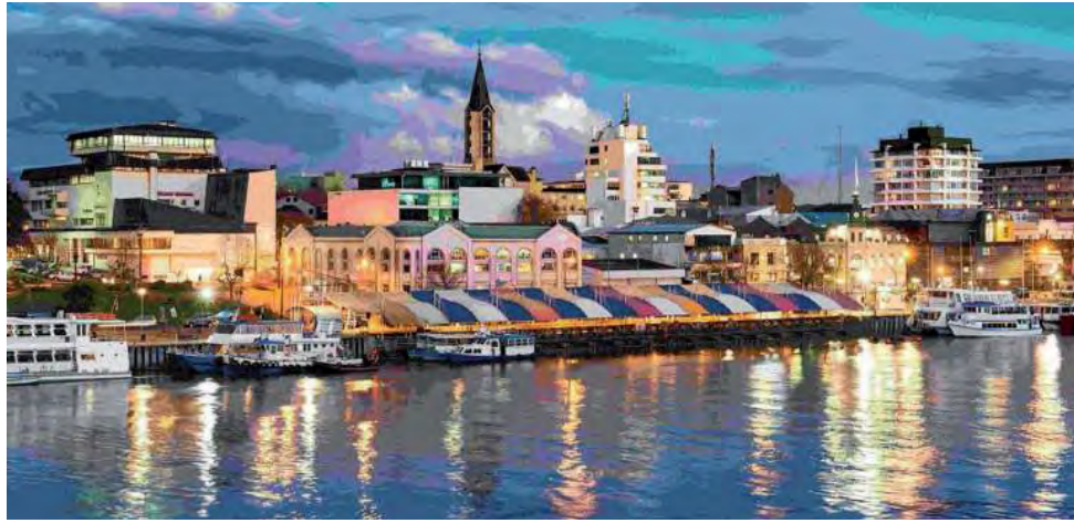
Villa General Belgrano en Córdoba, Blumenau en Santa Catarina, Valdivia en Chile (foto) y Lima en Perú son las ciudades donde la cerveza toma un protagonismo muy especial.

Además, hay mucho para conocer, como la Torre del Reloj, un mirador al que se accede a través de una escalera caracol de 98 escalones