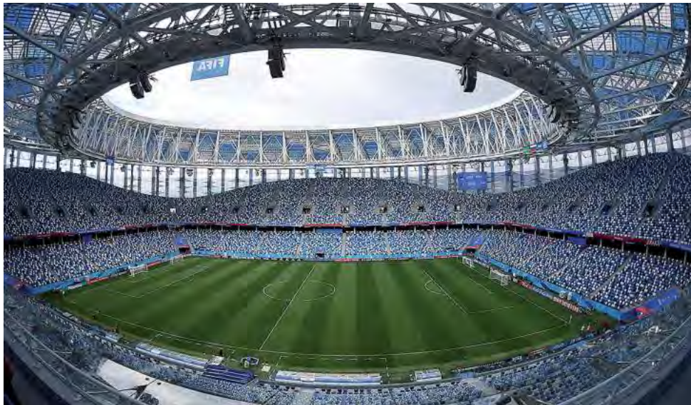
El país del norte se transformó en el segundo destino internacional más buscado por argentinos para viajar y alojarse entre el 20 de junio y el 14 de julio.

En esta ocasión, la CONMEBOL Copa América™ contará con 32 partidos a lo largo de