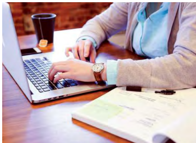
Individuos de todas las edades, incluyendo familias con hijos, adoptan el estilo de vida nómada digital.

Aunque los nómadas digitales pueden trabajar desde distintos lugares del mundo, muchas veces deben cumplir con horarios fijos y deadlines como cualquier otro trabajador. Viajar y trabajar al mismo tiempo requiere de disciplina y una buena organización del tiempo.