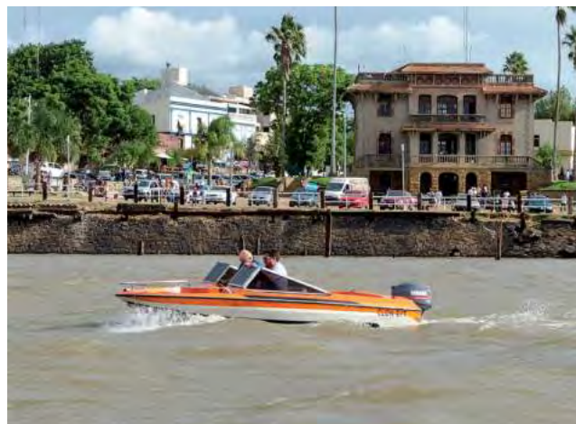
Colón, Entre Ríos, primero en la lista de preferencias.