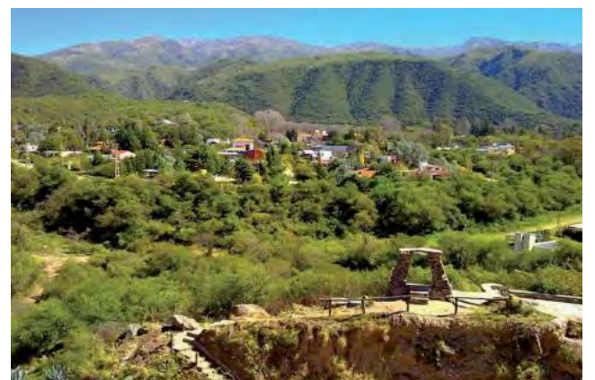
San Fernando del Valle de Catamarca, otro elegido.

Con más de 29 millones de alojamientos registrados en todo el mundo, en 220 países y territorios, y más de