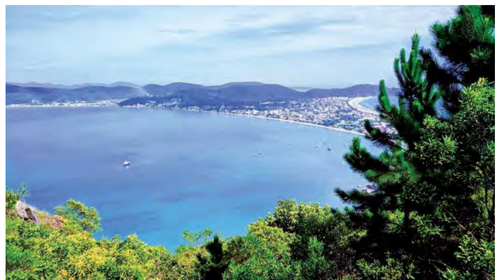
Las playas de Bombinhas en Brasil, es uno de los destinos internacionales elegidos.