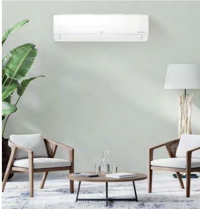
Según LG Electronics, un reciente estudio reveló que, por ahorro, eficiencia, sustentabilidad e incluso facilidad en la instalación; el aire acondicionado con tecnología Inverter es la opción más conveniente para calefactar el hogar.