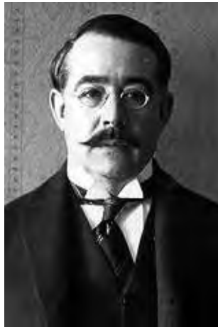
En junio además se celebra el "Día de la Escritora y del Escritor", en homenaje al primer presidente de la SAdeE (Sociedad Argentina de Escritores), Leopoldo Lugones.

En junio además se celebra el "Día de la Escritora y del Escritor", en homenaje al primer presidente de la SAdeE (Sociedad Argentina de Es-