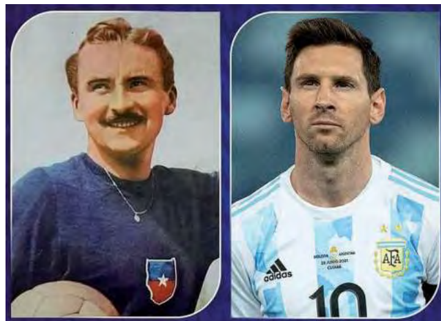
Livingstone y Messi, son los jugadores con más partidos en la CONMEBOL Copa América™, 34 cada uno.

La CONMEBOL Copa América 2024™, el torneo de selecciones más antiguo del mundo, disputa este año su Edición Nº 48. El gran evento comenzará en pocos días más y promete ser la edición más emocionante de la historia, con la participación de 16 selecciones que se darán cita desde el 20 de junio hasta el 14 de julio en Estados Unidos.