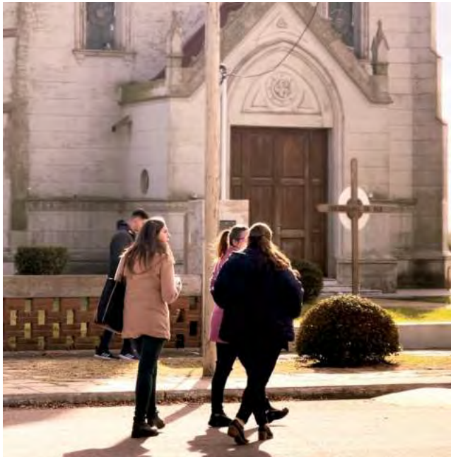
Buscan integrar en el Mapa a los 80 municipios, con información de la infraestructura disponible sobre los principales atractivos y servicios.

Equipos técnicos de la Secretaría de Turismo de La Pampa se encuentran llevando a cabo un proyecto para la creación de un mapa turístico integral de la Provincia.