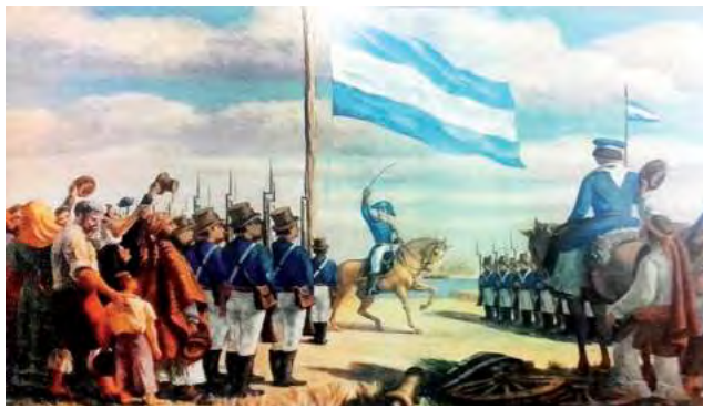
"Me hierve la sangre, al observar tanto obstáculo, tantas dificultades que se vencerían rápidamente si hubiera un poco de interés por la patria", fue una de las frases del prócer argentino creador de la enseña nacional.