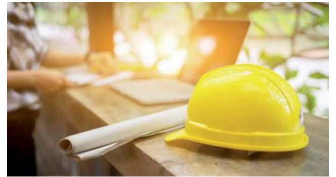
En nuestra Provincia, los Ingenieros y Técnicos están matriculados en el Consejo Profesional de Ingenieros y Técnicos de La Pampa (CPITLP).

Este domingo 16 de junio se celebra en todo el país el “Día del Ingeniero Argentino”, en conmemoración al comienzo e implementación de la carrera de Ingeniería en nuestro país.