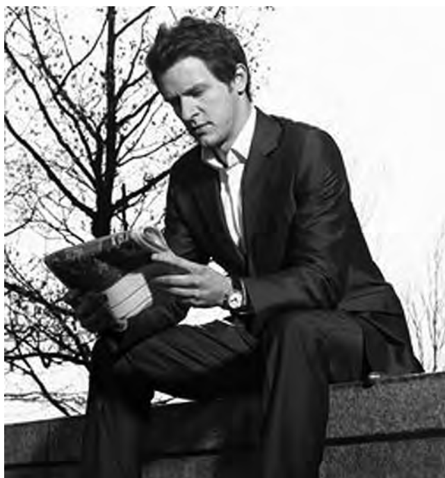
Los "centennials", jóvenes que no superan los 24 años, desconocen lo que era ir a buscar empleo con un diario a través del viejo aviso clasificado.

Primero llegaron los millennials y luego los centennials, esos jóvenes que no superan los 24 años y que desconocen lo que era ir a buscar empleo con un diario o un inmueble a través del viejo clasificado. Se trata de una generación que no concibe el mundo sin la tecnología y que seguramente le sea