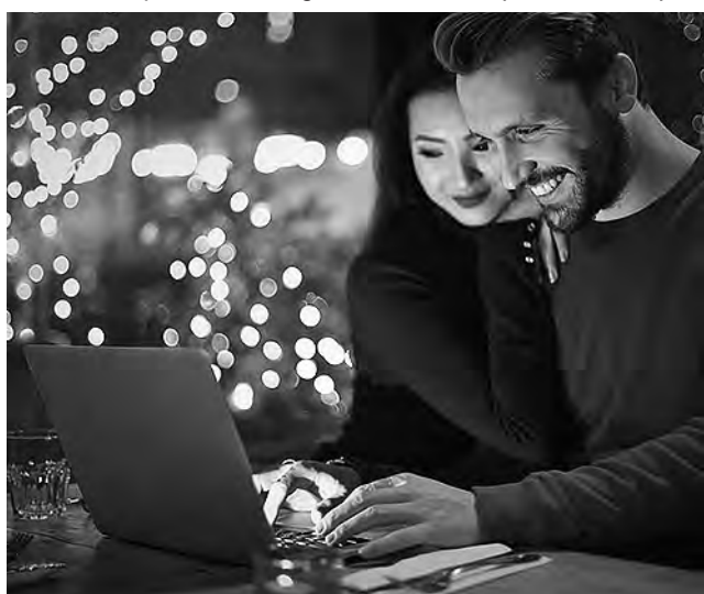
La posibilidad de recorrer un inmueble como si estuviéramos en el lugar es una tendencia para ciertos países, en donde la comodidad de la web aceleró el proceso acercando cada vez más a los que buscan y a los que ofrecen.

La posibilidad de recorrer un inmueble como si estuviéramos en el lugar es una tendencia para ciertos paí-