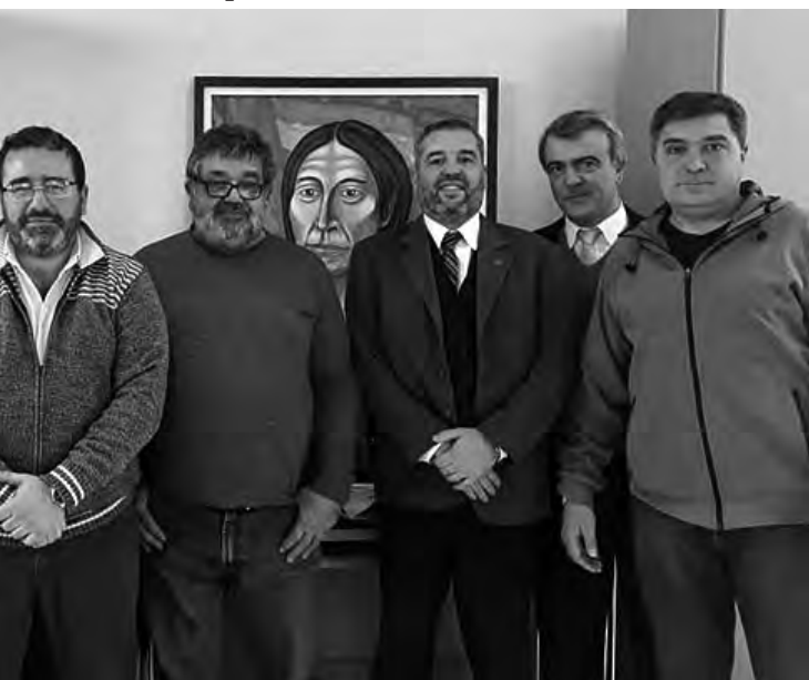
La Comisión Social se unieron para brindar beneficios mayores: Ingenieros y Técnicos de La Pampa y el Banco Credicoop