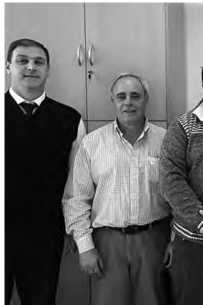
Dos instituciones de econ... el Consejo Profesional de