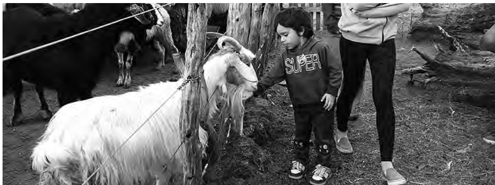
La Chacra de Tridente, camino a Toay, además de los clásicos paseos por la granja y las cabalgatas, realizará actividades deportivas y recreativas con entrada libre y gratuita.

-Sáb. 13 a las 16 y a las 18 hs: obra infantil "La Gallina