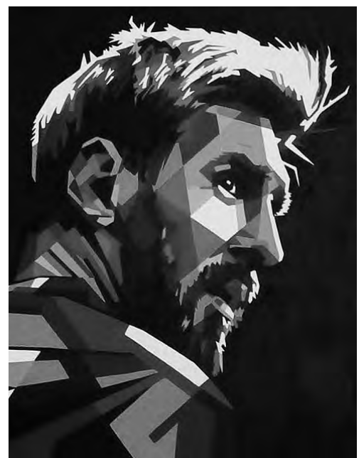
Pintado a mano por María Noel Amela - @liamela - inspirada en una creación del ilustrador indonesio Wedha Abdul Rashid.

Tenga en cuenta que el FC Barcelona vende en su Tienda Deportiva Oficial, casi 4 millones de camisetas de