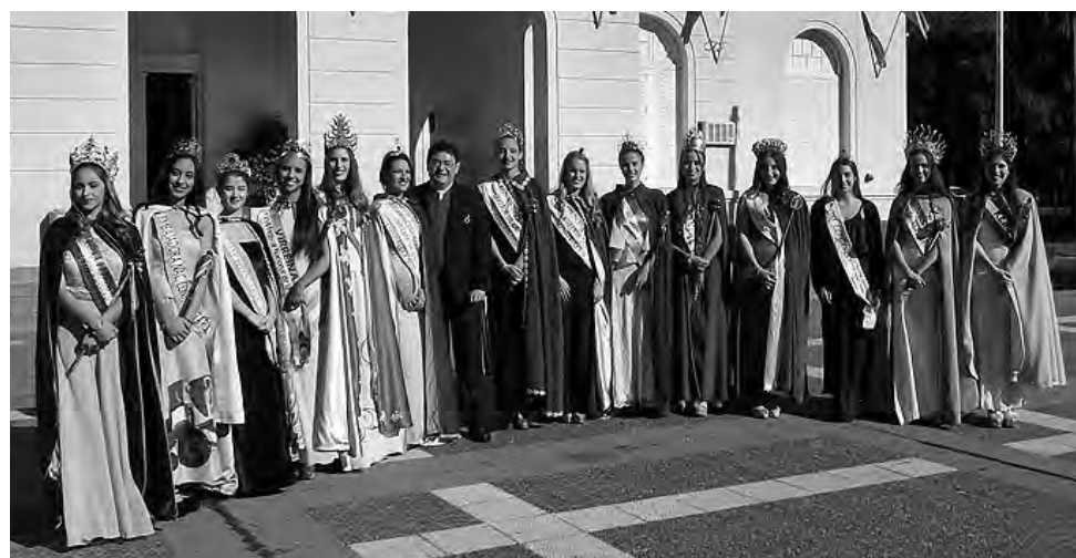
La Fiesta contó con la asistencia de delegaciones de varias localidades que se movilizaron hasta Pico, para compartir una velada con la participación de las reinas representantes de colectividades y de fiestas populares a nivel país.