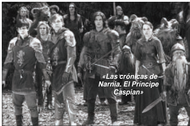
«Las crónicas de Narnia. El Príncipe Caspian»