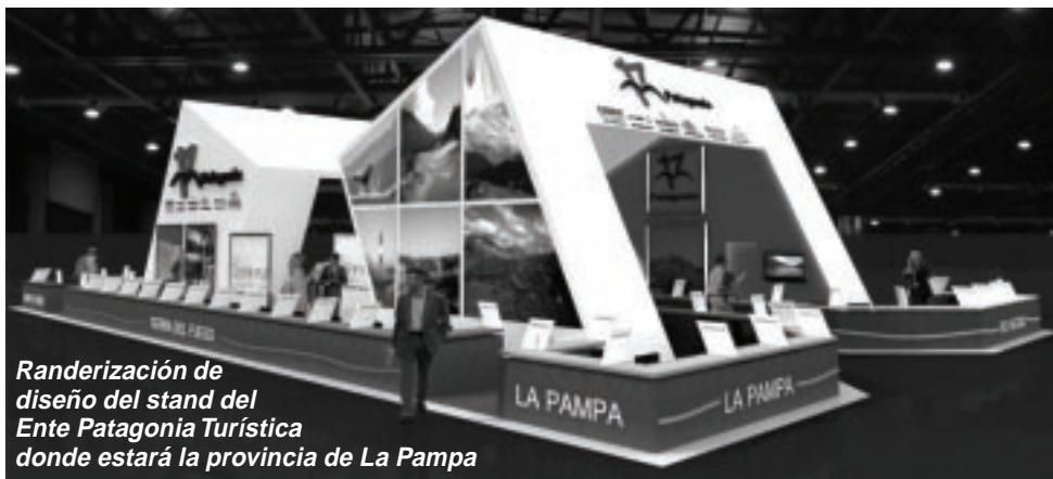
Randerización de diseño del stand del Ente Patagonia Turística donde estará la provincia de La Pampa

VIENE DE TAPA La 4ª edición de la Expo Turismo de Invierno (ETI) en el Pabellón Ocre de La Rural, ocupa una superficie de 5.000 m2 y convoca a profesionales y público en general interesado en conocer la oferta turística de la temporada más fría del año, siendo un espacio ideal para generar nuevas relaciones comerciales, afianzar contactos y concretar negocios. Además, Grandes Maestros de la Cocina Regional competirán con los mejores chef y cocineros del país y en el Rincón de la Cocina Regional Argentina se podrán ver y disfrutar los más deliciosos y autóctonos platos de nuestro país. Expo Termas es otro de los atractivos de esta feria, con los más destacados spa, centros termales, hoteles, resorts y todas las alternativas de Turismo Salud.