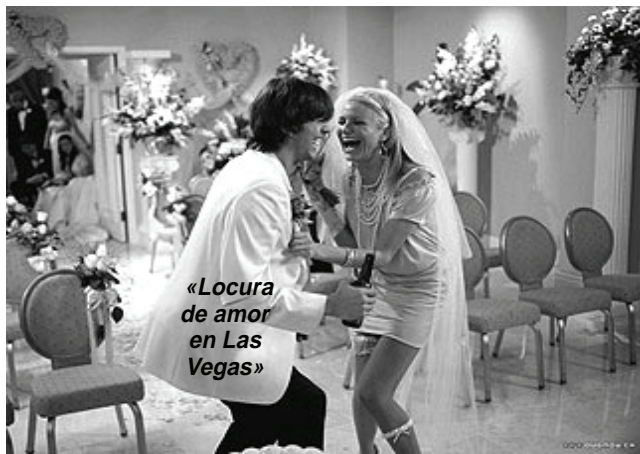
«Locura de amor en Las Vegas»