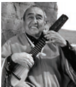
soporte Krhonos Ensemble. (ver aparte) $ 50, $ 40.