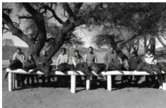
Durante la jornada del domingo los cazadores posan para la foto junto a los trofeos presentados.