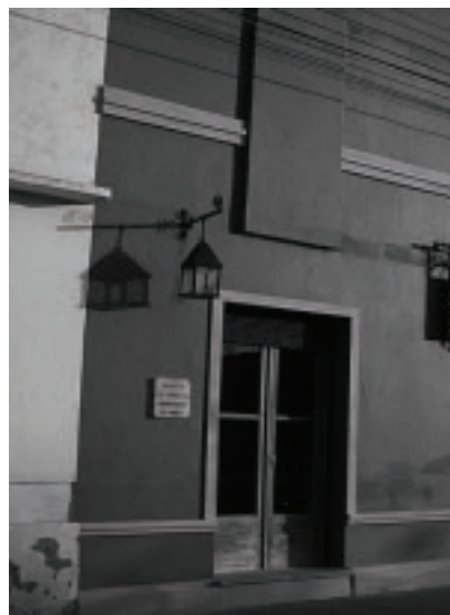
En noviembre de 2004, el museo fue abierto al público y puede ser visitado.

La municipalidad de Parera, recientemente, declaró de in-