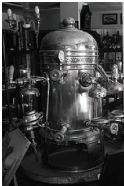
La colección es sumamente variada (monedas y medallas antiguas), armas, elementos de bares y «ramos genera...