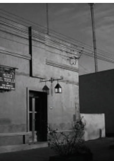
Abierto a todo el público interesado todos los días del año.