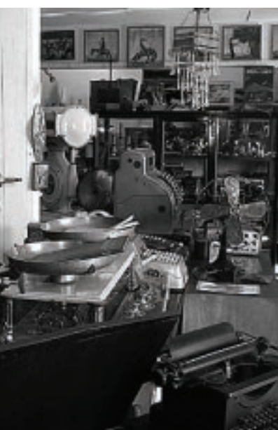
En esta foto se destaca la numismática, instrumentos de música, adornos y objetos antiguos, como los de esta foto.