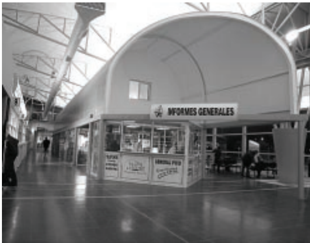
La Oficina de Turismo ubicada en el local 7 de la Nueva Terminal de Omnibus de General Pico atiende al público de lunes a viernes de 7 a 13:30 horas

La Dirección de Producción de la Municipalidad de General Pico, a través de su Oficina de Turismo, informó sobre la realización efectuada de la primera reunión de Turismo con el objetivo específico de organizar un Calendario de Eventos a realizarse en la ciudad, donde estuvieron presentes: Hoteleros, Gastronómicos, Agencias de Viajes, Guías de Turismo, Instituciones Intermedias, Asociaciones, el director de Producción Municipal y el subsecretario de Turismo de la provincia, junto a sus Equipos Técnicos.