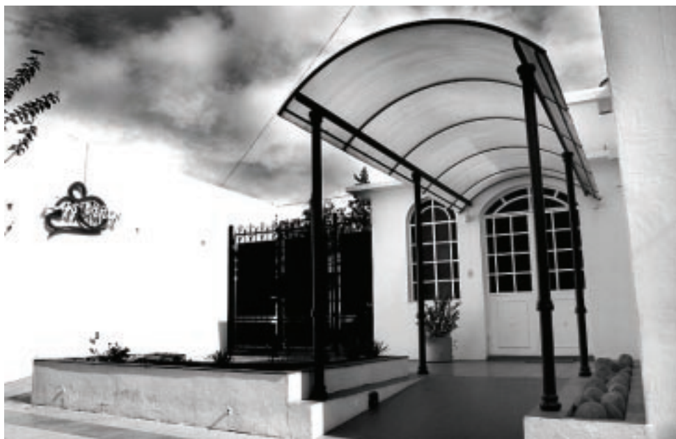
Frente del Salón de «Las Viñas, catering, fiestas y eventos», ubicado en González 754 de Santa Rosa.

Excelente servicio, buen gusto, inmejorable calidad... son algunos de los calificativos que mencionan sus clientes cuando se les pide una opinión