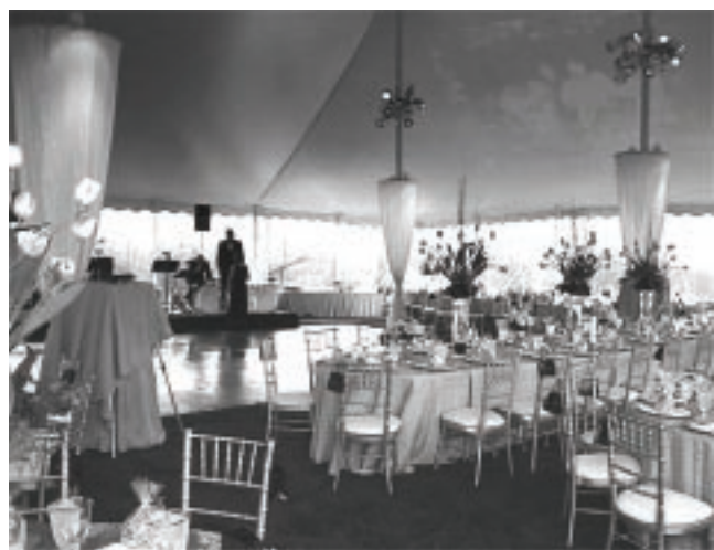
Carpa propia con capacidad de hasta 300 personas.