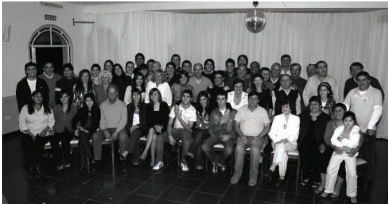
El miércoles 30 de abril la familia González junto con su personal, familiares y colaboradores compartieron una deliciosa cena y un grato momento para celebrar el 22º aniversario.