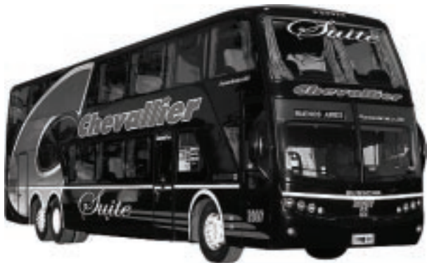
Chevallier comercializará los productos pampeanos desde Capital Federal, tomando como punto de partida el destino Santa Rosa, desde donde saldrán los paquetes turísticos.

Este importante paso apunta a consolidar el trabajo llevado a cabo desde esta Subsecretaría con el fin de difundir, promocionar y hacer conocer el Turismo de La Pampa como destino turístico nacional.