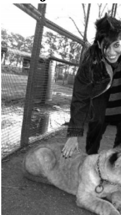
El contacto con los animales es el de

Es una opción inolvidable para toda la familia, ya que es un zoológico abierto, distinto, donde interactúan los conceptos de granja y zoo, porque los animales se pueden tocar, acariciar, mimar o alimentarlos, pudiendo si uno quiere, ingresar a las jaulas de monos, leones, tigres y pasear en un elefante o un dromedario. Todo esto otorga a la visita una ternura única en este tipo de establecimientos. El zoo es abierto ya que la mayoría de los animales, y por el necesario respeto y seguridad entre ellos y las personas, viven en corrales con dimensiones de potrero, en grandes jaulas, o bien pasean en absoluta libertad dentro del perímetro de la institución. Casi todos los animales son accesibles a la gente y acercarse a ellos es posible. Los ambientes del Zoo de Luján permiten que en casi todos los casos los visitantes puedan sacarse fotografías cerca de los animales. Se trata también de un parque recreativo y cultural porque ofrece un generoso espacio natural e infraestructura para el camping, la diversión y el conocimiento. Además, dispone de características de museo ya que atesora verdaderas reliquias ferroviarias, vehículos militares y maquinarias del agro, que combinan con paseos y demostraciones.