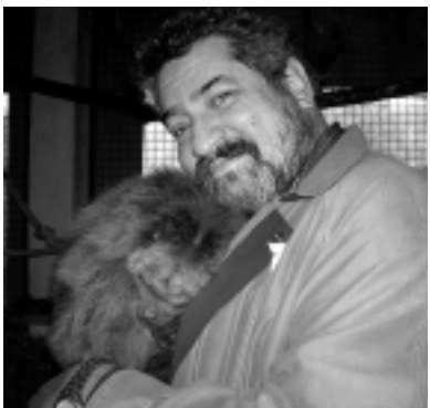
También en el zoo se producen encuentros donde los animales parecen haber encontrado el mayor parecido a sus ancestros.

Servicios: Hay instaladas parrillas (de uso gratuito) y se puede acampar. Cuentan con arboleda, baños con duchas, servicio de cantina y parrilla, pileta de natación con quincho y juegos infantiles. Con el costo de la entrada se incluye paseos en trencito, en carreta, en ponys y caballos para adultos, en elefantes y en dromedarios.