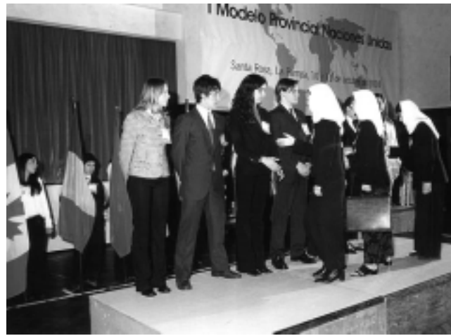
Modelo ONU desarrollado en Santa Rosa.

Vivimos en una sociedad en la que los jóvenes parecen ajenos al mundo que los rodea, en la que lograr interesarlos por conocer sobre realidades distantes a las de ellos es una tarea ardua que día a día emprenden nuestros educadores.