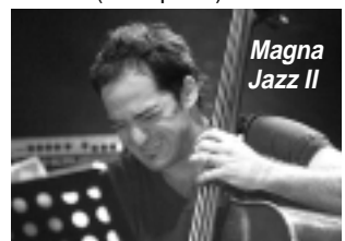
Magna Jazz II

- Sáb. 14, 20:45 hs: Magna Jazz II. (Ver aparte).