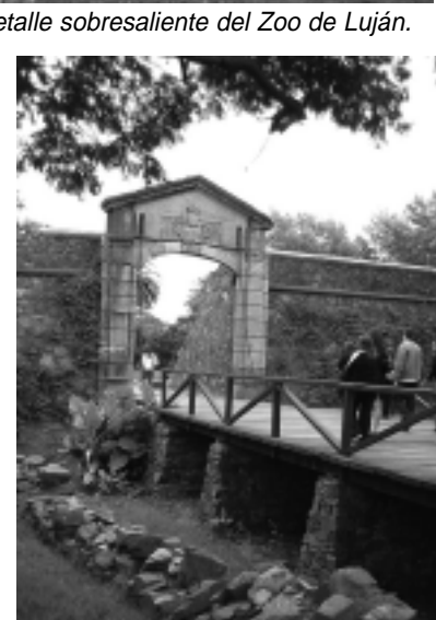
Una postal de Colonia del Sacramento, Uruguay, un viaje al pasado de la colonia Portuguesa, totalmente extraña en el Río de la Plata.

Comidas: Buena gastronomía con atención algo lenta a nuestro gusto, pero con mucha amabilidad. Los precios son similares a los de Buenos Aires y en todos lados aceptan pesos argentinos.