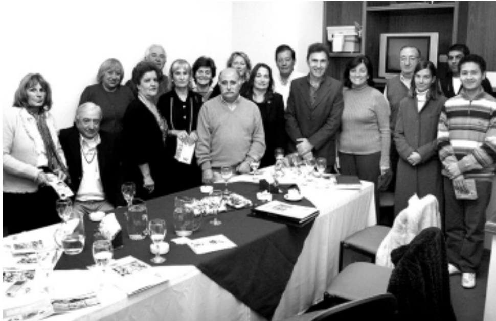
Directivos y asociados se reunieron la semana pasada para celebrar los dos años de la Cámara de Turismo de La Pampa, quien ahora además ha conformado la Comisión de una «Red Rural» que aglutinará la representación del sector del Turismo Rural en la provincia.

La Cámara de Turismo de La Pampa celebró la semana pasada el segundo aniversario de su creación, acontecida el 4 de julio de 2005 y la fecha fue motivo para una reunión especial de la Comisión Directiva, con invitados y una cena posterior en el Hotel Club «La Campiña» de Santa Rosa.