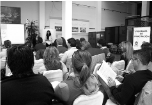
El curso fue auspiciado por REGION® Empresa Periodística, alcanzando la cifra de 42 inscriptos.

Finalizado el curso de esta semana, se dictarán otros correspondientes a 2007. Entre los temas solicitados están: Cocina Típica; Organización; Gobernanta; Estrategia de ventas; Calidad de Servicios Hoteleros Gastronómicos; Atención al Cliente; etc.