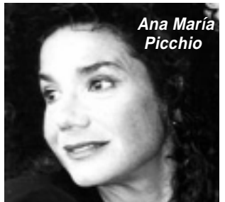
Ana María Picchio