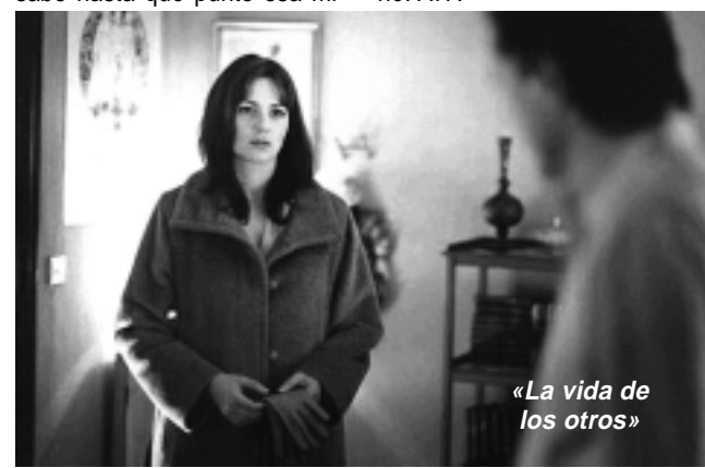
«La vida de los otros»