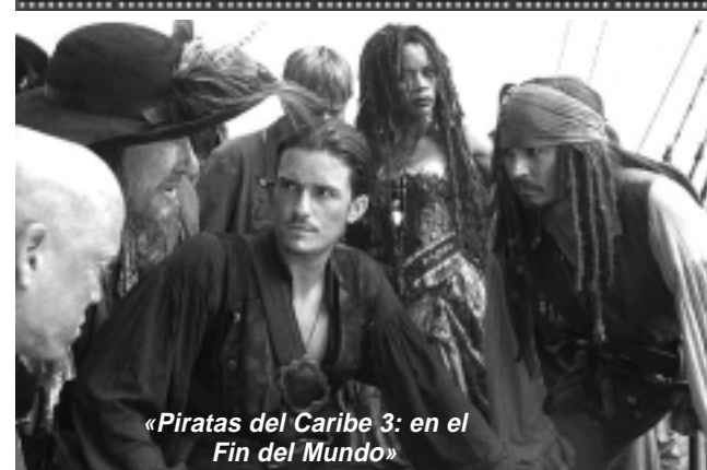
«Piratas del Caribe 3: en el Fin del Mundo»

«Piratas del Caribe 3: en el Fin del Mundo»: la tercera y última entrega de la trilogía de espadas y corsarios. Castell. AM 13, men. asistir acomp. «La vida de los otros»: el capitán Gerd Wiesler es un oficial muy competente de la policía secreta del régimen comunista de la antigua República Democrática Alemana. En 1984 le encomiendan que espíe a la pareja formada por el escritor Georg Dreyman y la actriz Christa-Maria Sieland, pero no sabe hasta qué punto esa misión va a influir en su propia vida. Con Martina Gedeck, Ulrich Mühe, Sebastian Koch. Oscar Mejor Film Extranjero y de 34 premios más. SAM16. «Paris, Je T'aime»: serie de cortos por el aniversario de París. En París, el amor está en todas partes. En sus bares y cafés. Bajo la Torre Eiffel, a las orillas del Sena, incluso en su maravillosa red del metro que corre bajo sus calles. En este film percibirá la ciudad de un modo que nunca antes imaginó. ATP.