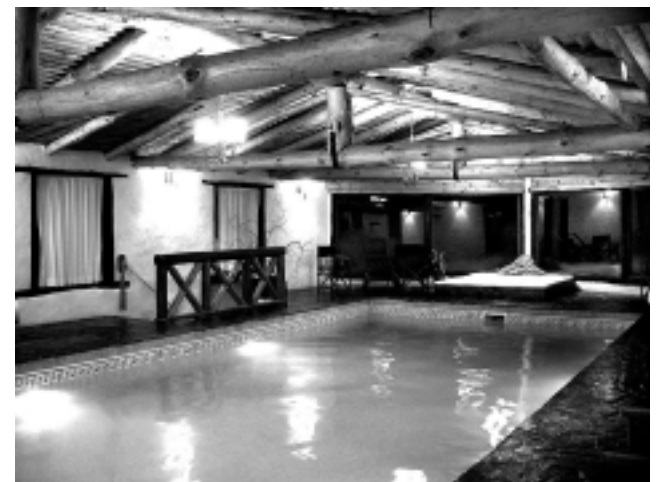
La piscina climatizada de abundantes dimensiones, junto con el hidromasaje -cada pasajero recibe bata de baño y calzado para la zona de pileta-, es lo que marca la diferencia.