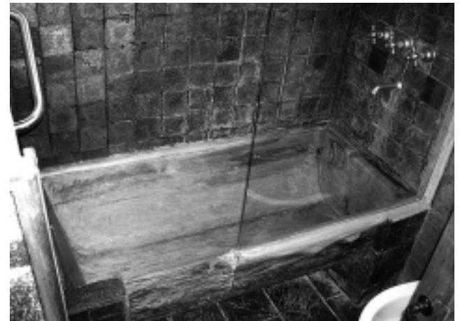
Las habitaciones conjugan un detalle único -tal vez en el mundo, dicen,- de bañeras y bachas de tronco.

Info: (0291) 491-0210 / 0152 info@aguapampas.com.ar www.aguapampas.com.ar