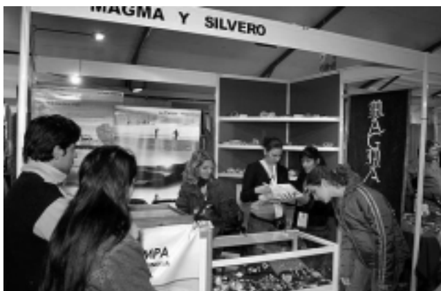
El taller de pulido y lapidado de piedras «SILVERO» de Colonia 25 de Mayo mostró hermosas piezas artesanales.