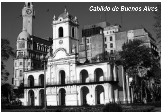
Cabildo de Buenos Aires

La independencia de las Provincias Unidas del Río de la Plata no fue un hecho espontáneo que surgió de la nada. Una serie de acontecimientos fueron madurando esta gesta. Las Invasiones Inglesas de 1806 y 1807 expusieron la debilidad de España a la hora de proteger a sus colonias de cualquier invasión y a su vez manifestaron la fortaleza de los criollos que comenzaron a tomar conciencia de su propio poder. En 1808 España fue ocupada por las tropas de Napoleón que se mantuvieron en la península hasta 1814. En 1809 se dictó en Buenos Aires el Reglamento de Libre Comercio poniendo fin al monopolio comercial español. En febrero de 1810 cayó en España la última porción de poder español frente a la ocupación francesa, noticia que llegó a Buenos Aires recién el 14 de mayo, cuatro días más tarde pidieron al Virrey Cisneros que convocara a un Cabildo Abierto.