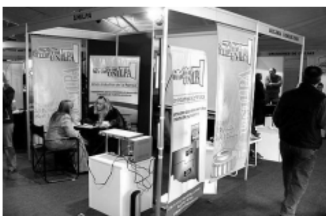
La Unión Industrial de La Pampa -UNILPA- apoyó institucionalmente a sus asociados-