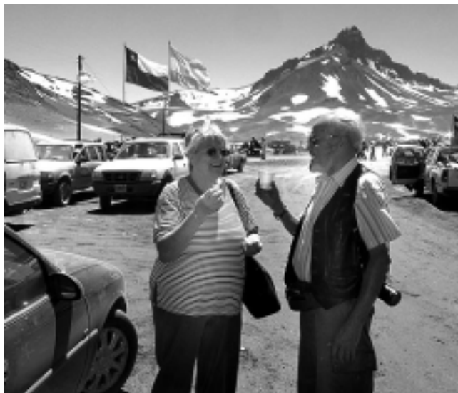
La propuesta oficial de la Subsecretaría de Turismo de Mendoza, es culminar el circuito en el Paso El Pehuenche, con la imponente vista del Cerro Campanario.

La Subsecretaría de Turismo de Mendoza se hizo presente en la última Feria Internacional de la Región del Maule (FITAL) realizada en la ciudad de Talca, Chile, donde presentó un nuevo circuito turístico que ha incorporado a su oferta y que busca captar principalmente, al turista chileno.