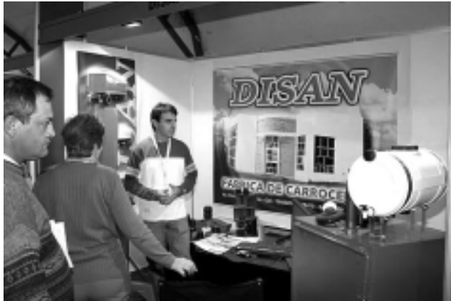
La empresa «DISAN» de General Pico promocionó su fábrica de carrocías y otros servicios.