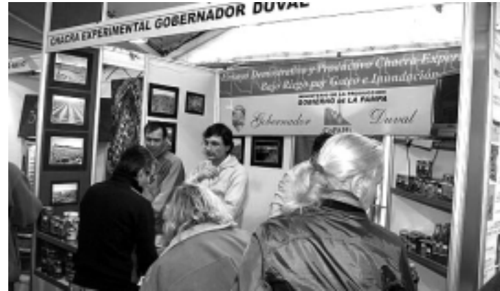
La Chacra Experimental de Gobernador Duval se hizo presente, divulgando su exitosa tarea agrícola en el Area Bajo Riego.