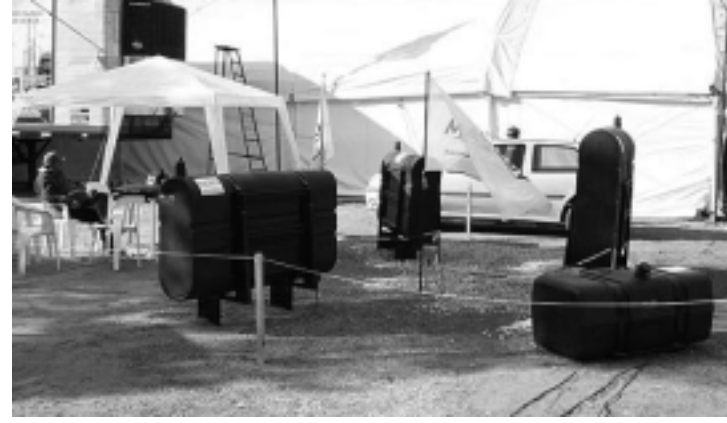
La empresa piquense «MAXEPA» de Plásticos por Rotomoldeo expuso sus líneas de tanques mochila y suplementario.