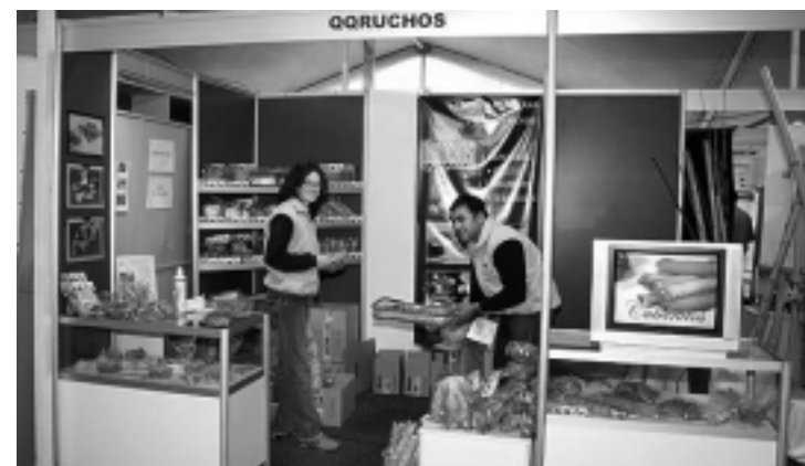
La fábrica de cucuruchos, barquillos y cubanitos «QQRUCHOS» de General Pico, expuso la variedad de sus crocantes productos.