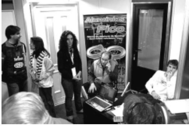
La fábrica de aberturas «Aluminios Pico» con 30 años de experiencia expuso parte de sus productos.

En el rubro Mejor Atención, primer premio: «Carpintería Fuertes». Segundo premio: «Santino Premoldeados».