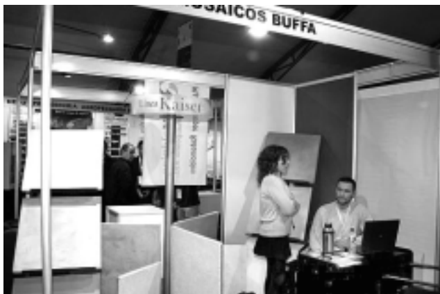
«Mosaicos Buffa» de General Pico estuvo presente mostrando variedad de diseños en pisos modernos.