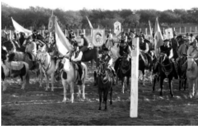
VIENE DE TAPA

La fiesta «Patria Gaucha» de la localidad de Luan Toro, es considerada desde la Subsecretaría de Turismo como «una actividad recreativa y de turismo, que pone en valor lo tradicional y lo nuestro, además de provocar un movimiento inusual en la localidad».