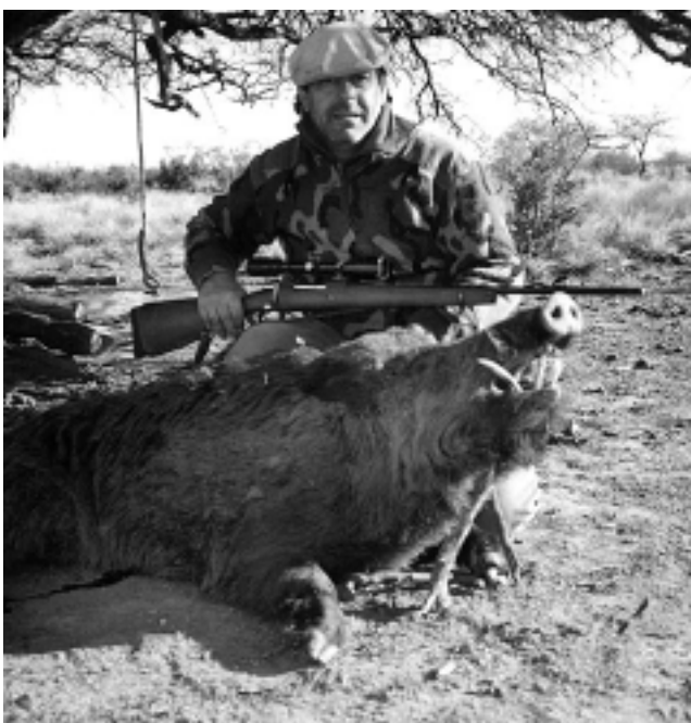
La primer fecha es el próximo fin de semana del 1, 2 y 3 de junio. Hay tiempo de inscribirse hasta el jueves 31.

Como todos los años, el Club de Caza Mayor y Menor de La Pampa, Mapú Vey Puudú, organiza sus torneos de caza de jabalí al acecho. Serán tres Torneos en 2007: