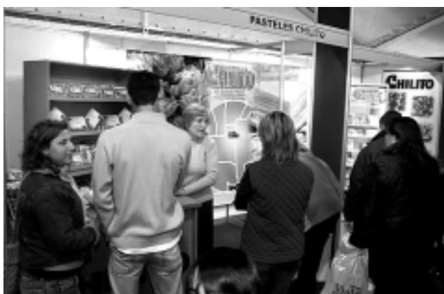
La empresa piquense «Pasteles Chilito» exhibió y vendió los exquisitos productos que elaboran desde la década del '80.