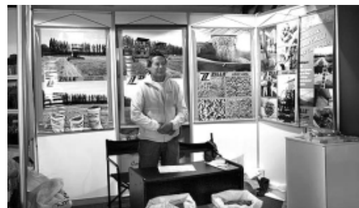
La empresa «ZILLE» de Colonia 25 de Mayo, mostró la elaboración de sus productos de alfalfa: Cubeteada, Pellets y Harinas.