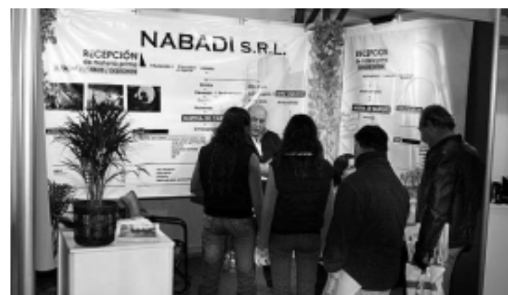
La empresa «NABADI S.R.L.» de General Pico mostró su fábrica de harina de carne, de sangre y sebo.