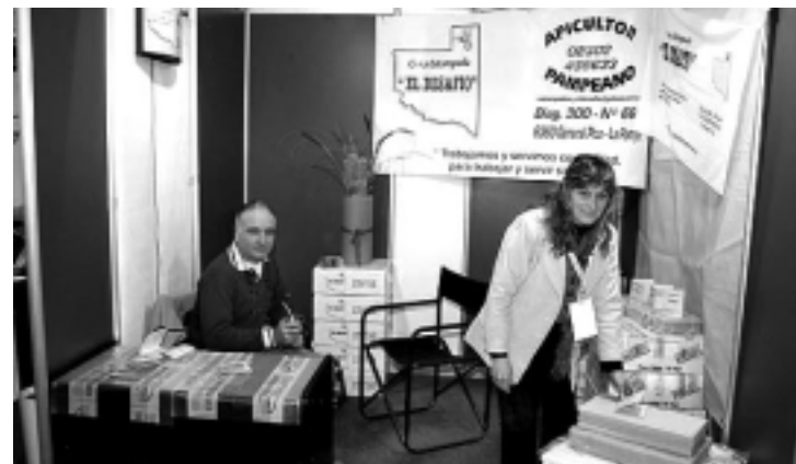
La fábrica de cera estampada «El Desafío» de General Pico exhibió productos y regaló muestras.