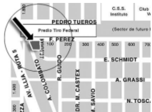
La ubicación es en la calle F. Pérez 24, casi Ruta Nacional Nº 5, frente al predio del Tiro Federal. (Infografía Guiaplano REGION®)