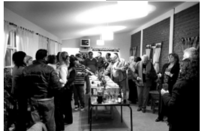
Bendición de las instalaciones y reunión de amigos y familia.