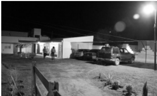
Comienzan con 5 habitaciones con estacionamiento y en 120 días suman 3 más. En verano habrá piscina y solarium.

La hostería es un lugar sencillo pero arreglado con buen gusto y calidez, cuenta con un amplio desayunador con cocina, que hace las veces de sala de esparcimiento y puede ser utilizado por el pasaje-