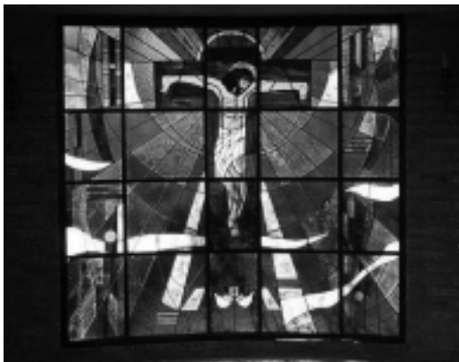
Los trabajos que se presentan son la cruz principal, vitraux, púlpito y 14 imágenes que ilustran el Vía Crucis.

VIENE DE TAPA La capilla «Francisco Melo», ubicada en la Estancia Turística La Holanda, sede del Museo Atelier «Antonio Ortiz Echagüe», en cercanías del pueblo de Carro Quemado, será inaugurada este sábado con una misa anunciada para las 10 de la mañana. Recordemos que la obra corresponde a un proyecto artístico concursado a través de la Subsecretaría de Cultura de La Pampa, que dió como ganadora del 1er Premio a Ma-