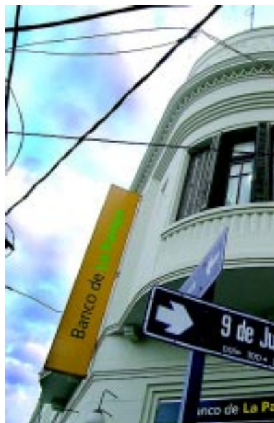
Actualmente el Banco de La Pampa tiene una oficina en una esquina histórica del centro de Santa Rosa, en la calle 9 de Julio y Pellegrini. La estructura ha preservado el edificio que es un patrimonio.