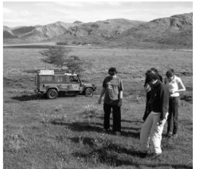
El marco de las sierras -cadena Ventania-, es espectacular y el campo de la Estancia «Las Vertientes» conjuga todo para la aventura: Huellas pantanosas, trepadas de gran inclinación, vados profundos, grandes piedras en el terreno y una llamativa vegetación que se explica en la guiada.

Para contactar a Santiago, llamar al (0291) 491-0245 ó al celular 1550-76468.