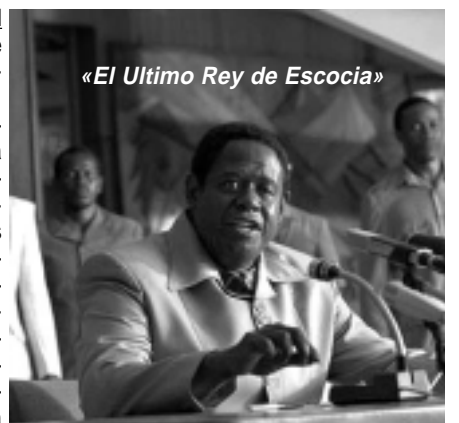
«El Ultimo Rey de Escocia»

• «La Conquista del Honor»: es la Guerra del Pacífico, cinco infantes de marina y un oficial de la armada enarbolan la bandera de Estados Unidos sobre el monte Suribachi, en la isla Iwo Jima... Dirigida por Clint Eastwood, con Ryan Phillippe, Jesse Bradford, Adam Beach y otros. AM 16.