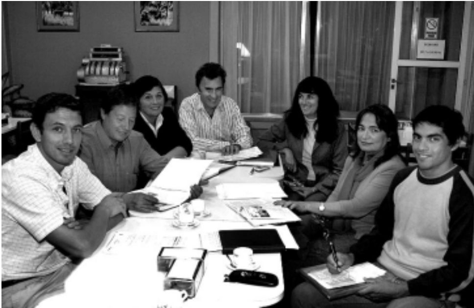
Durante la reunión de CaTuLPa también quedó definido para el 22 de agosto en Santa Rosa, la presentación del programa «Argentina para Argentinos», desarrollado por la Cámara Argentina de Turismo. Sería el primer Workshop en la historia que se realiza en La Pampa.

La delegación de FedecaTur llegará ese día a las 11 hs. y serán recibidos en la Subsecretaría de Turismo, donde se expondrá el audiovisual «Los Recursos Turísticos de La Pampa», elaborado por CaTuLPa, material presentado recientemente en la Cámara Argentina de Turismo al periodis-