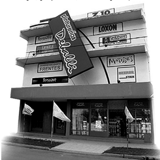
Pinturerías Deballi, con 80 años de trayectoria en el rubro pinturería en La Pampa, en 1998 abrió su primera sucursal en Santa Rosa, en la esquina de Luro y Alvear, luego el segundo local en Luro 1.131 (entre P. Harris y Congreso) y el año pasado completó el trío en Ameghino y Edison.