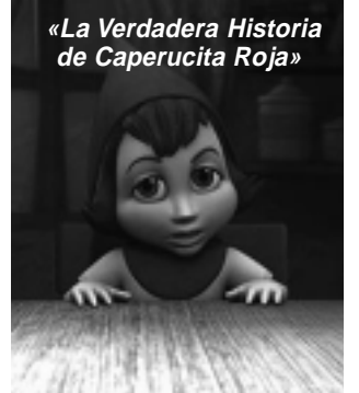
«La Verdadera Historia de Caperucita Roja»