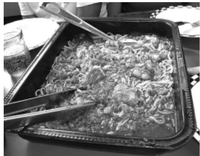
Los «espagueti a la Properzi», un clásico de la cocina náutica para degustar en alta mar.

Cuando estén al dente, colar, cubrir con la salsa, rociar con queso rallado y servir.