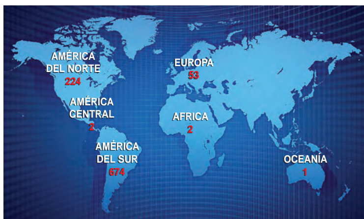
Destino continental de trofeos por cazadores - Temporada 2019

-Y el otro es la "24ª Fiesta Pampeana de la Caza Mayor - Menor y el Turismo Cinegético" que organiza el Club de Caza Valle de Quehué, prevista para el 12 de Septiembre de 2020.