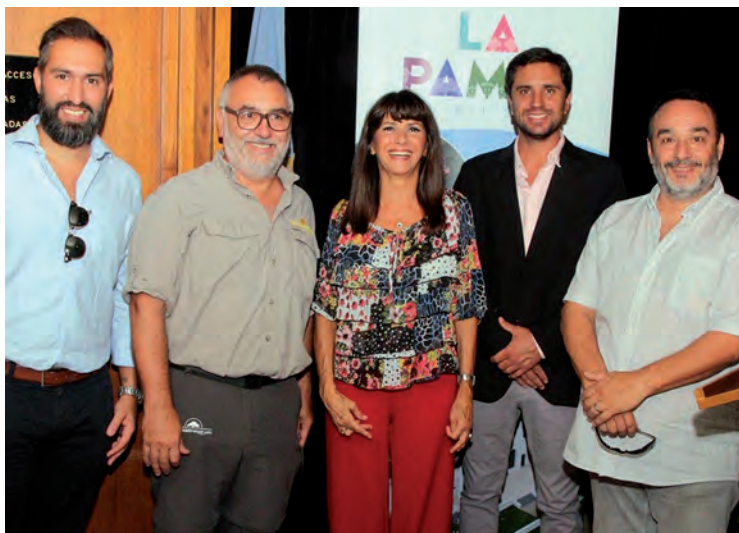
Anticiparon que se realizarán dos excursiones diarias en grupos de hasta 20 personas. La primera a las 06 de la mañana y la segunda a las 18 hs.