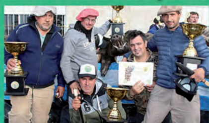
La Asociación Cazadores con Jauría a Puro Dogo y Cuchillo realizó en 2019 su 11er Torneo de Caza Mayor de Jabalí con Jauría y al Acecho...