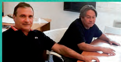
El cazador es un trabajador más cómo cualquier otro y en breve tendrá su Obra Social, dijeron desde el SUEGCA...