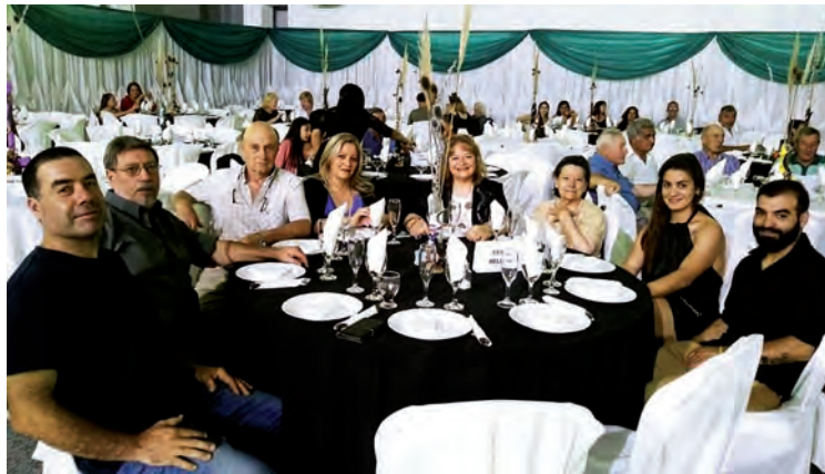
Las principales fiestas que realizan en La Pampa los Clubes de Caza convocaron a deportistas de distintos puntos de la Provincia y el País.