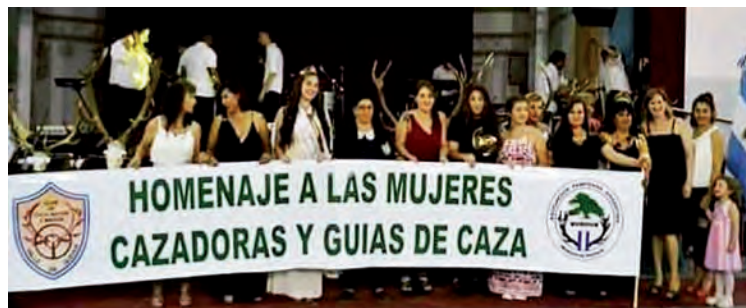
En 2019 no hubo Elección de la Reina, pero el Club Valle de Quehué hizo un reconocido homenaje a las mujeres cazadoras y guías de caza.

está comprobado que el gasto promedio por cada cazador, duplica o triplica al del turista común, dijo. Y de lo que mucho no se habla -advirtió Córdoba-, es el impacto positivo que tiene para el ambiente la actividad cinegética. Al contrario de lo que se piensa que impacta negativamente sobre la biodiversidad, hay ejemplos sobrados de que es favorable para la conservación de las especies.