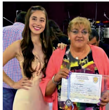
Varias mujeres cazadoras recibieron importantes premios.

(Agradecemos la colaboración de Fabio Fleckenstein)