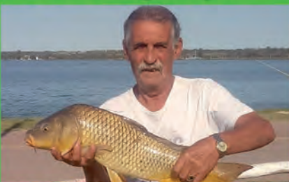
Foto: ejemplar logrado en Laguna Don Tomás de Santa Rosa. Informe con Pesqueros recomendados...