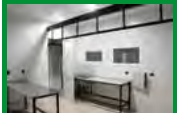
Cámara frigorífica para desposte de animales de caza mayor y menor