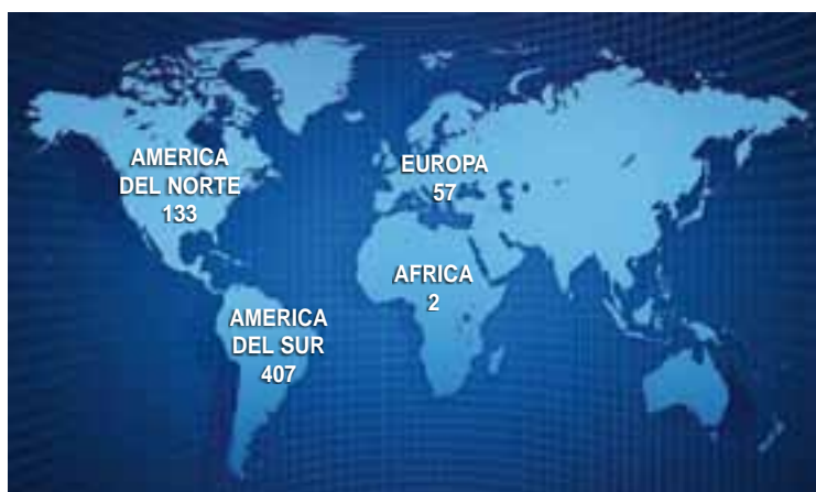
Destino continental de trofeos por cazadores - Temporada 2013

Corresponde a los 599 cazadores que se llevaron piezas de caza de todas las especies. La Caza Mayor en La Pampa es un recurso turístico que atrae a deportistas de todo el país y de distintas latitudes del mundo.