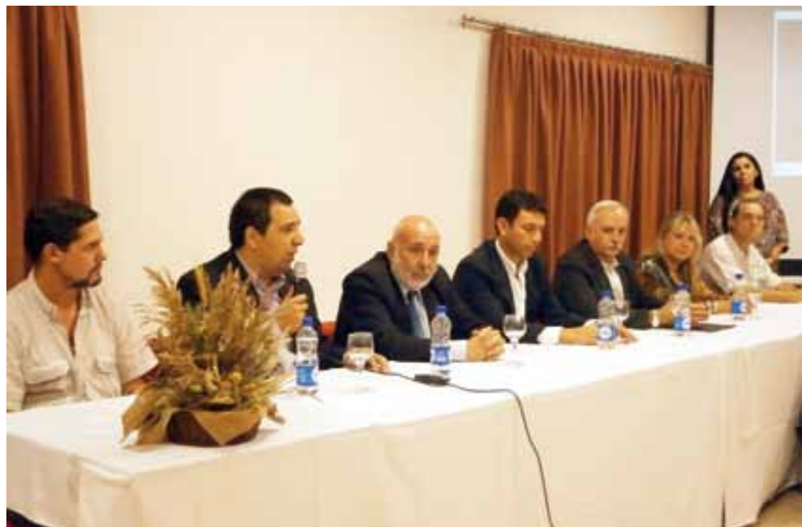
El lanzamiento oficial de la temporada de Brama del Ciervo Colorado y de la Caza Deportiva en La Pampa, se realizó por tercera vez en Quehué, que no en vano ostenta el título de "Capital de la Caza Mayor".

Seguidamente hubo una charla a cargo del Coordinador de la Reserva