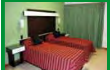
Habitaciones bien equipadas