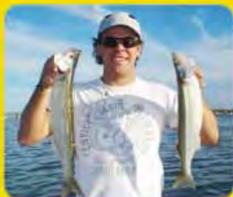
Pesqueros vecinos Relevamiento de 8 sitios de prov. de Bs.As.