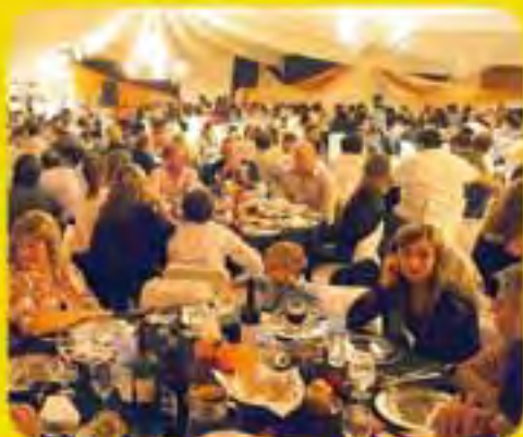
Fiesta de la Caza en Quehué Gran celebración en la 20ª Edición