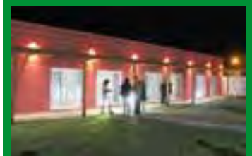
Galería y estacionamiento