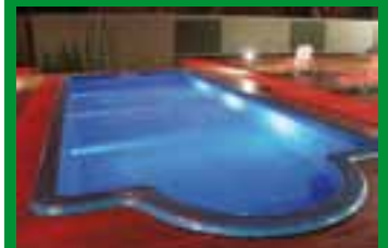
Piscina y solarium