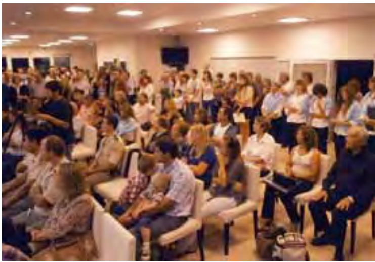
Mucho público se hizo presente durante el acto oficial, donde hubo videos, música, fuegos artificiales y degustación de productos de caza.

Brama del Ciervo es un espectáculo natural único que año a año atrae a un mayor número de turistas a La Pampa. Para esta fecha comienza el ritual, donde los ciervos colorados del Parque Luro se trasladan desde la espesura del monte de caldenes para buscar espacios más abiertos y así reproducirse".