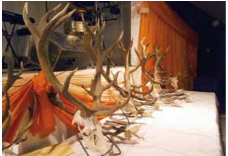
Sin dudas 2013 no fue una buena temporada, por diversos factores naturales. No obstante se presentaron a medir buenos trofeos en Quehué.