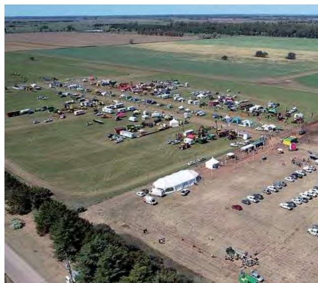
Foto aérea de la 1ª Edición, que este año será más grande.

expodinamica@agro.unlpam.edu.ar www.expodinamica.com @expodinamicaok 2954 441447