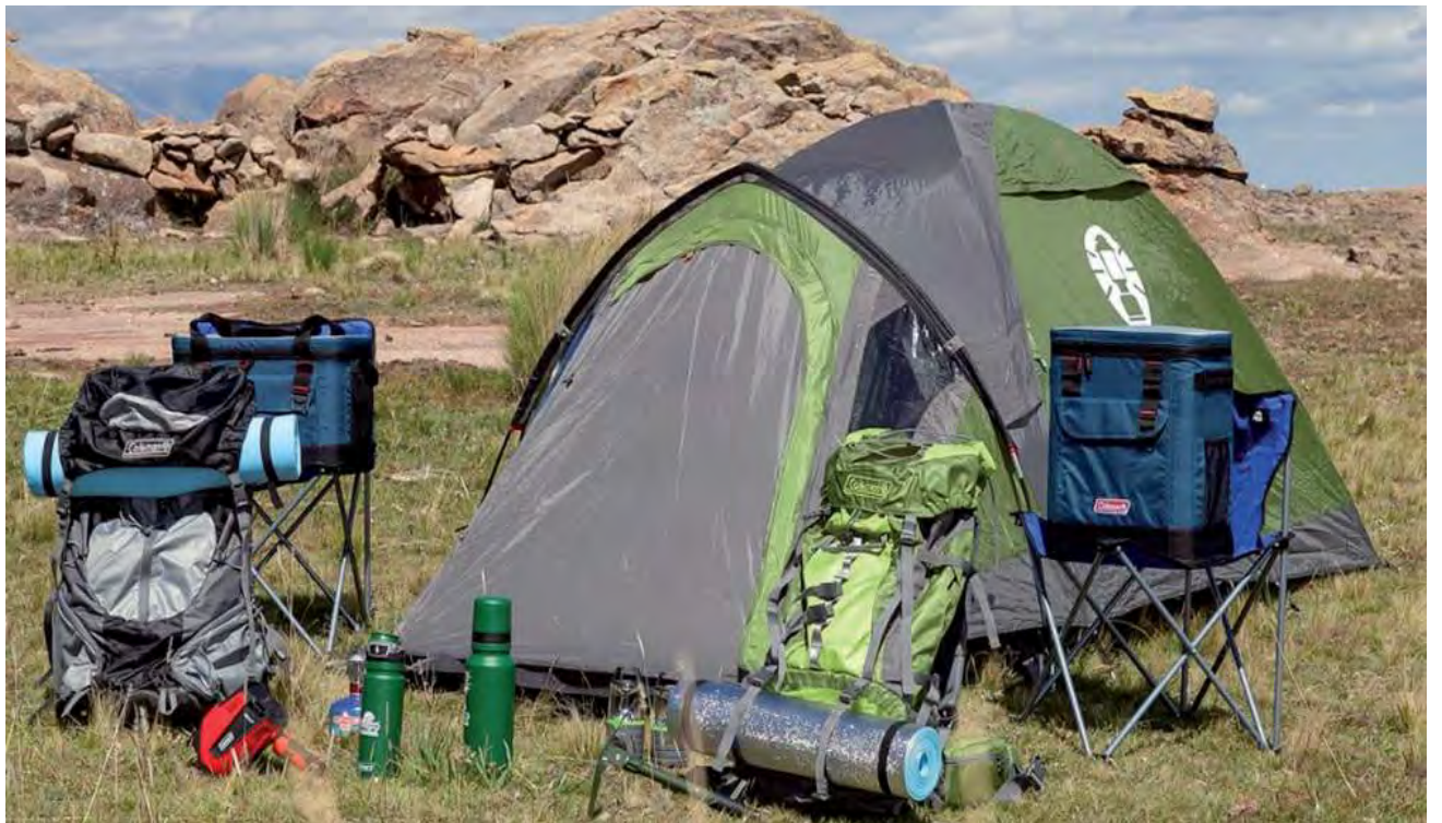
A finales de 2023, la compañía lanzó su página web brindando la posibilidad de alquilar on line, facilitando aún más a los aventureros la planificación de sus escapadas.

A finales de 2023, la compañía lanzó su página web brindando la posibilidad de alquilar on line, facilitando aún más a los aventureros la planificación de sus escapadas. Además, el sitio ofrece paquetes turísticos en colaboración con varios cam-