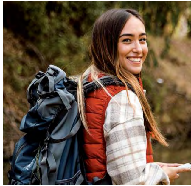
En el contexto económico actual de Argentina, la propuesta de la empresa se presenta como una opción económica para vacacionar con equipos de alta calidad

En respuesta a la creciente demanda de opciones accesibles para disfrutar de actividades al aire libre de manera segura, KitCamp se estableció en 2021 en la ciudad de Córdoba, enfocándose inicialmente en el alquiler de equipos de camping y trekking. Su visión era proporcionar una alternativa asequible para aquellos que buscan experiencias en la naturaleza sin la inversión ini-