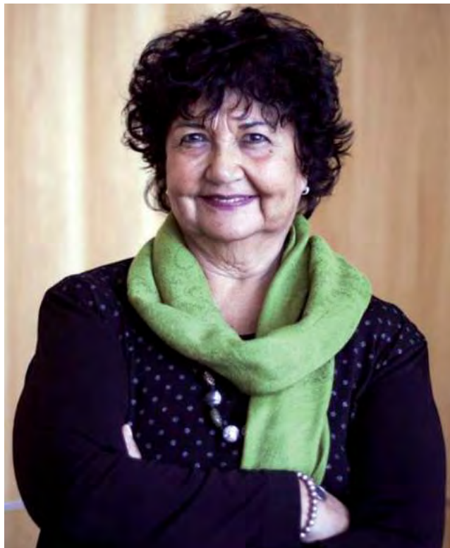
Se destaca la actividad del 12 de marzo, ocasión en la que la Doctora Dora Barrancos, brindará la capacitación a funcionarios y funcionarias del poder ejecutivo, legislativo y judicial.

Iniciativas de fortalecimiento Se realizarán diversas propuestas a lo largo del mes, con el objetivo de brindar herramientas que fortalezcan y empoderen a las mujeres. En ese sentido ya se realizó un taller Diagnóstico de mi