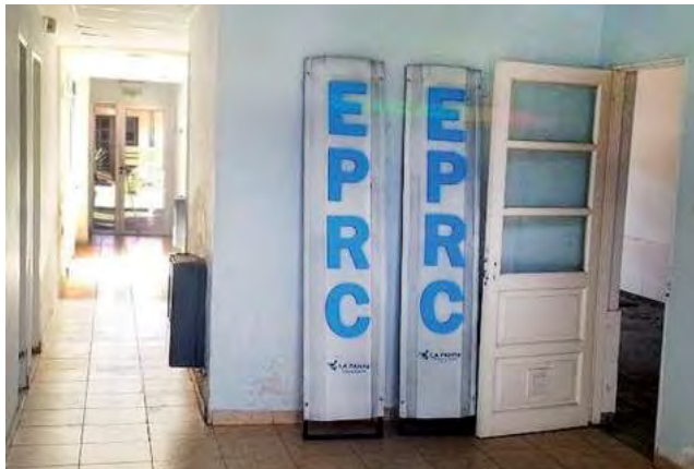
Esta oficina, que es la cara visible del EPRC ante la visita de inversores nacionales y extranjeros, hace varios años que viene necesitando una modernización. En buena hora.