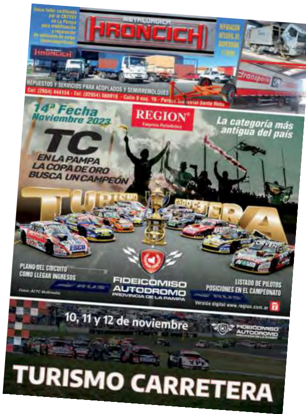
Este viernes 10, la revista se puede retirar gratis en nuestra Redacción de Independencia 195 (una por persona).

Averiguar compra presencial en Curva Ticket (Alem 147, S. Rosa) o compra online en planetaentrada.com (+10% Comisión del sitio). Mayores de 65 años, menores de 12, mujeres y personas con discapacidad -presentando certificado- no abonan entrada general. El predio cuenta como siempre, con un amplio sector de acampe, proveeduría, servicios gastronómicos, baños públicos y seguridad las 24 horas.