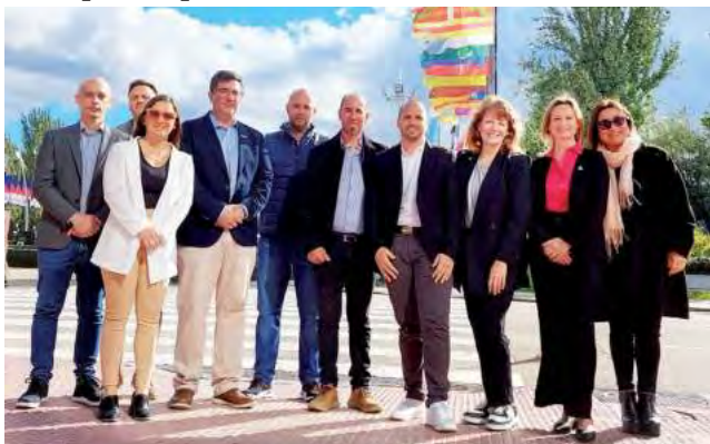
La Misión Comercial España 2023 fue un éxito rotundo, fortaleciendo relaciones comerciales.