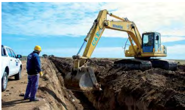
Hay previsto dos campamentos, uno ambulante donde va la línea y otro en Eduardo Castex.