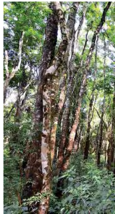
En Argentina se desarrollan en distintas

Hoy la Mesa de Carbono Forestal Nacional (MCFN) está conformada por aproximadamente 30 empresas, personas e instituciones enfocadas en el sector forestal argentino, pero con una visión futura multisectorial para un trabajo mancomunado e inte-