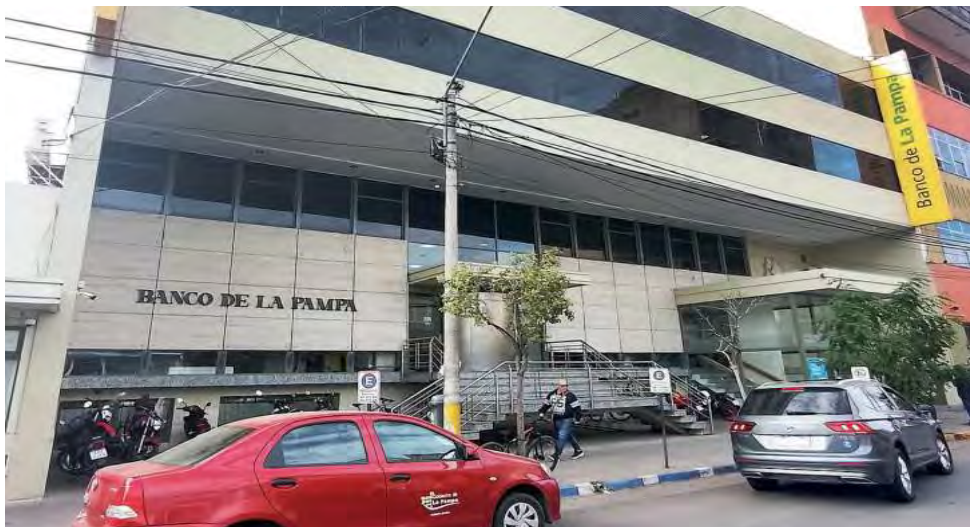
La Casa Central del BLP comenzó a funcionar el 18 de mayo de 1959, en tanto que el edificio que hoy conocemos en la calle Pellegrini, se inauguró el 6 de junio de 1964.

El origen del Banco de La Pampa -que cada año repasamos en esta fecha-, se vincula con el proceso de construcción del flamante estado provincial, como una herramienta eficaz para impulsar el desarrollo de la economía regional, siendo creado por Ley Provincial N° 96/54 adoptando la figura de Sociedad de Economía Mixta. El Directorio celebró su primera reunión el 20 de marzo de 1959 y su Casa Central comenzó a funcionar el 18 de mayo. Su primer presidente fue Osvaldo Sierra.