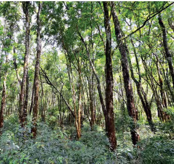
an proyectos de carbono forestal desde hace más de 15 años s regiones y con diferentes tipos de abordajes.

bientales, sociales, económicas y climáticas que traerá aparejado este aumento de la temperatura, a menos que se logren reducir profundamente las emisiones de gases de efecto invernadero (GEI) de forma urgente. En este contexto, y como fruto de la implementación de la Convención Marco de Naciones Unidas sobre el Cambio Climático (CMNUCC), los mercados de carbono surgen en el mundo como una vía para canalizar financiamiento, principalmente privado, para la acción climática.