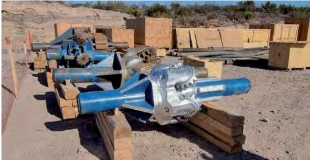
Trépano utilizado para soterrar el Gasoducto.

La obra de entubado del futuro Gasoducto Presidente Néstor Kirchner (ver Semanario REGION Nº 1.503), continúa su marcha a toda prisa, para poder llegar a la meta de inaugurar el servicio a mitad de este año. Entre los trabajos desarrollados recientemente, se realizaron los cruces de dos cauces de ríos en La Pampa, el Colorado, con importante paso de agua y el Salado, que actualmente está seco.