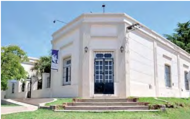
Casa Museo Olga Orozco en la localidad de Toay. En La Pampa hay más de 60 museos de distinta temática.

El tema del próximo Día Internacional de los Museos 2023 (18 de mayo) es “Museos, sostenibilidad y bienestar”.