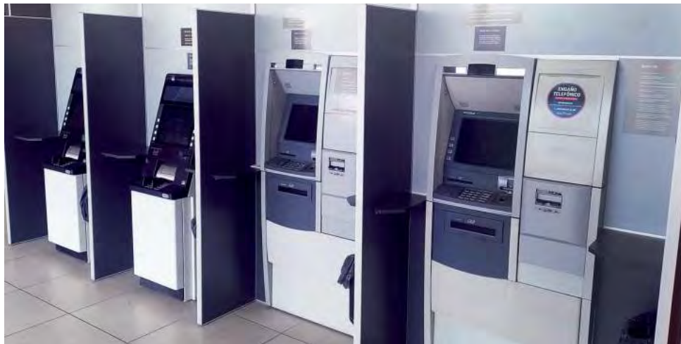
En lo que va de este año, el BLP instaló una importante cantidad de ATM nuevos.

pansión, en los últimos años mediante el "Plan de Inclusión Financiera" se instalaron cajeros en 75 localidades de la Provincia, con lo cual se alcanzó una cobertura del 94% sobre el total de comunidades pampeanas. A la fecha cuenta con 41 sucursales -la última inaugurada fue Santa Rosa Norte en marzo 2022- y 60 agencias de las cuales 27 son móviles atendidas por una Unidad Bancaria Móvil (UBM).