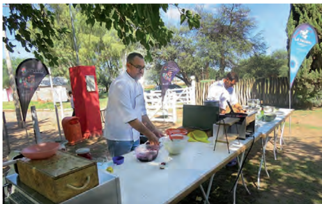
"Cocinando con lo nuestro" reúne múltiples intervenciones del Ministerio de Desarrollo Social en relación al vínculo con los Alimentos por parte de las familias pampeanas.

Chacharramendi fue sede de una nueva jornada de "Cocinando con lo Nuestro", la experiencia que conjuga acciones de los programas "Educación Alimentaria", "Nutrición para el Desarrollo de las Infancias" y "Objetivos de Desarrollo Sostenible".