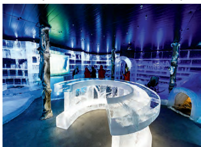
El Ice Bar Iguazú invita a participar de una curiosa experiencia de recreación y degustación de tragos entre paredes, barras, esculturas y hasta vasos de hielo.

También para recorrer Brasil, es una excelente opción alquilar un auto sin chofer en Foz do Iguazú, con tarifas bastante convenientes. Y si bien el combustible es más caro que en Argentina, hay destinos no muy lejanos de gran atractivo, con excelentes playas y muy buena infraestructura hotelera, que valen la pena la diferencia, que después de todo, no es tanta.