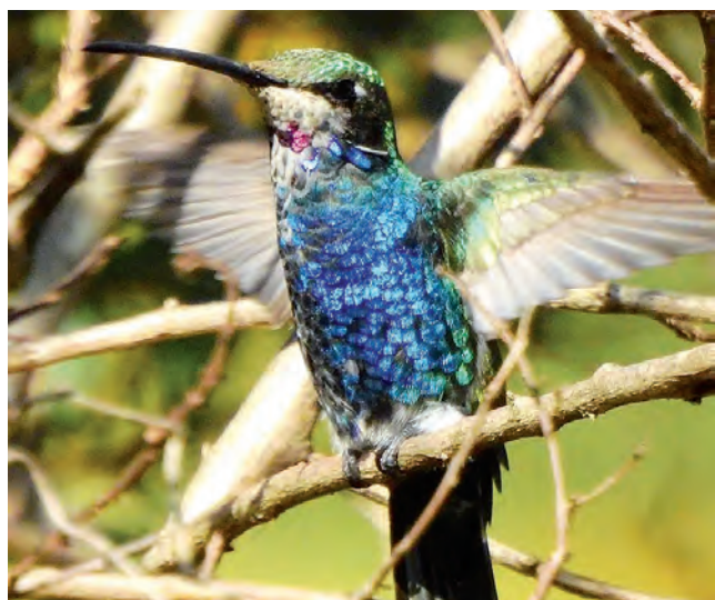
Existen al menos ocho especies diferentes y más de 150 ejemplares de picaflores.

Puerto Iguazú es un sitio ideal para que los turistas puedan vivir nuevas experiencias y El Jardín de los Picaflores, que reúne a más de 150 ejemplares de estas aves, es una de las opciones para descubrir.