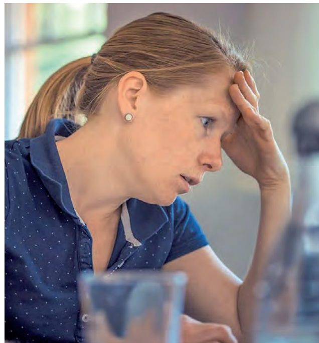
En Argentina, ante un caso de violencia, el 26,6% de las mujeres decidió no hacer nada al respecto, ya que temía perder su trabajo (48%), recibir represalias (22%) o que no le crean (6%)

"Lamentablemente, las mujeres seguimos siendo el blanco de hechos de violencia y acoso en todo el mundo pero además en cualquier ámbito. Ahora bien, las organizaciones de todo tipo y tamaño, tienen la responsabilidad de evitar que suceda durante su jornada laboral garantizando espacios de trabajo seguros para sus colaboradoras. Pues al final del día, pasamos por lo menos un tercio de nuestras vidas