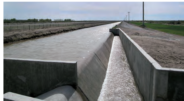
Canal de agua proveniente del Río Colorado, en el Área Bajo Riego de La Pampa.