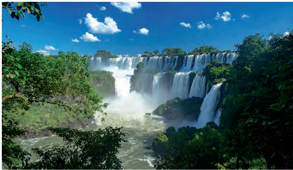
Abril, mayo y junio es una época perfecta para visitar esta ciudad, época de una temperatura agradable (23/24°), lejos del intenso frío continental promedio del país

Es el único espacio turístico de la avifauna americana que se dedica a alimentar a estos pequeños pájaros, algo que lleva a cabo desde hace más de 25 años. Actualmente el predio posee un área de relajación y contemplación de estas aves. Además, el Jardín de los Picaflores cuenta con un minishop en el cual se pueden adquirir materiales bibliográficos de la flora y la fauna del lugar.