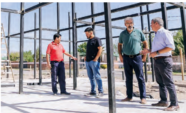
El ministro Álvarez y el intendente Abeldaño recorrieron el Centro de Desarrollo Infantil veicinqueño, en su actual emplazamiento.

Doce emprendedoras y emprendedores de la localidad pampeana de 25 de Mayo recibieron maquinarias y herramientas para el desarrollo de sus actividades, por un monto total de $ 2 millones.