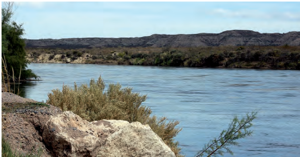
En la provincia de La Pampa el agua es escasa, de ahí que su aprovechamiento sea fundamental. El Río Colorado provee de agua para la producción y cubre actualmente las necesidades de más de la mitad de la población pampeana.

El suministro de agua y la pobreza están estrechamente relacionados. Sin agua, no hay desarrollo; sin desarrollo, es imposible erradicar la pobreza