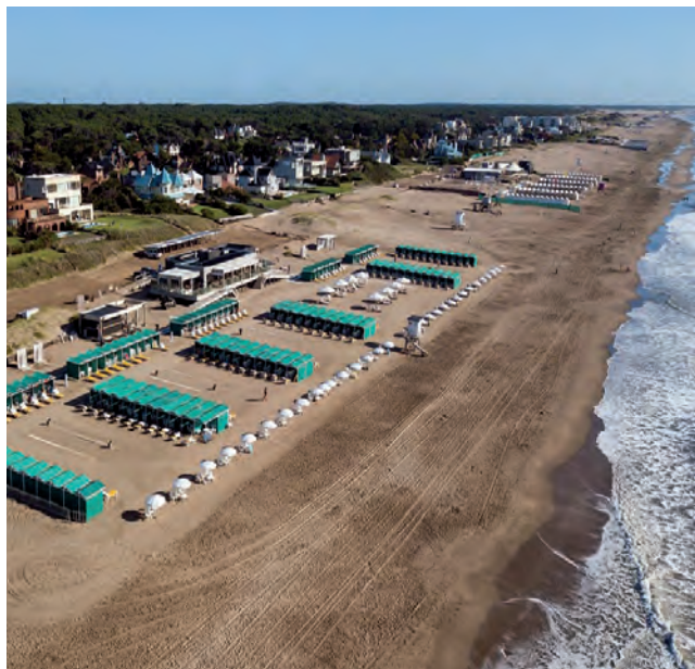
Cuenta con 150 carpas, 30 sombrillas y un estacionamiento para más de 150 vehículos.

En la zona norte de Pinamar, cuando termina la Avenida del Mar, se encuentra este exclusivo balneario que, además de contar con un