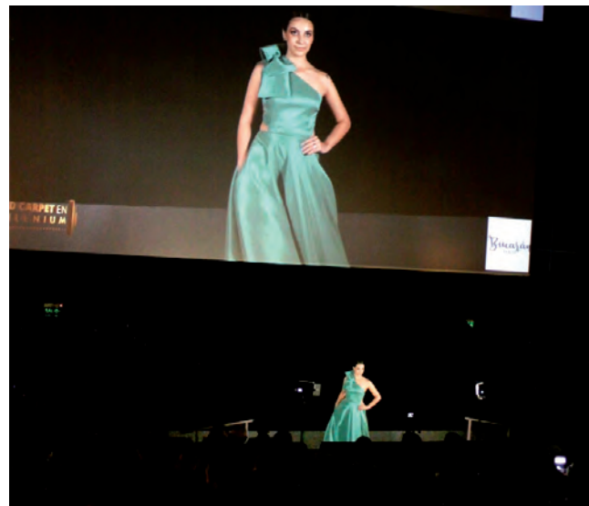
Se proyectó en vivo en la sala y vía streaming en YouTube.

El cine Milenium se vistió de gala en el estreno de "La casa Gucci", película del director Ridley Scott, protagonizada por Lady Gaga y Adam Driver, junto a Al Pacino, Jeremy Irons, Jared Leto, entre otros.