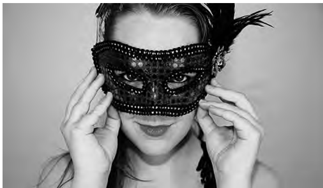
Este año, la celebración del Carnaval pasa por un difícil momento en Argentina debido a la pandemia del COVID.