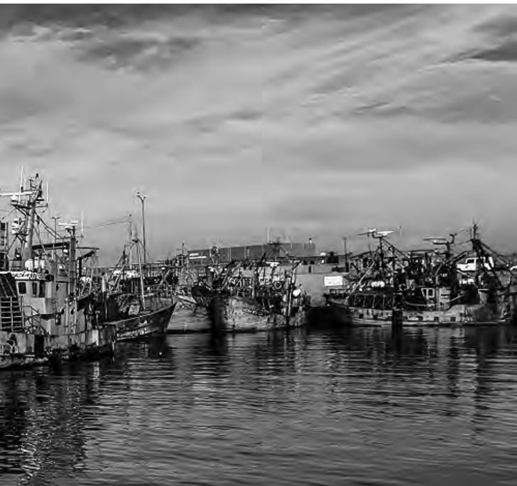
Mar del Plata, Ciudad de Buenos Aires, Colón, Tandil, San Antonio de los destinos más recomendados para disfrutar de esos paisajes.

en todo el mundo, Booking.com seleccionó los destinos que combinan las 3 "C" y cumplen con todos los requisitos, lo que hace que sea más fácil para la comunidad viajera argentina encontrar todo lo que buscan después de un año lleno de postergaciones.