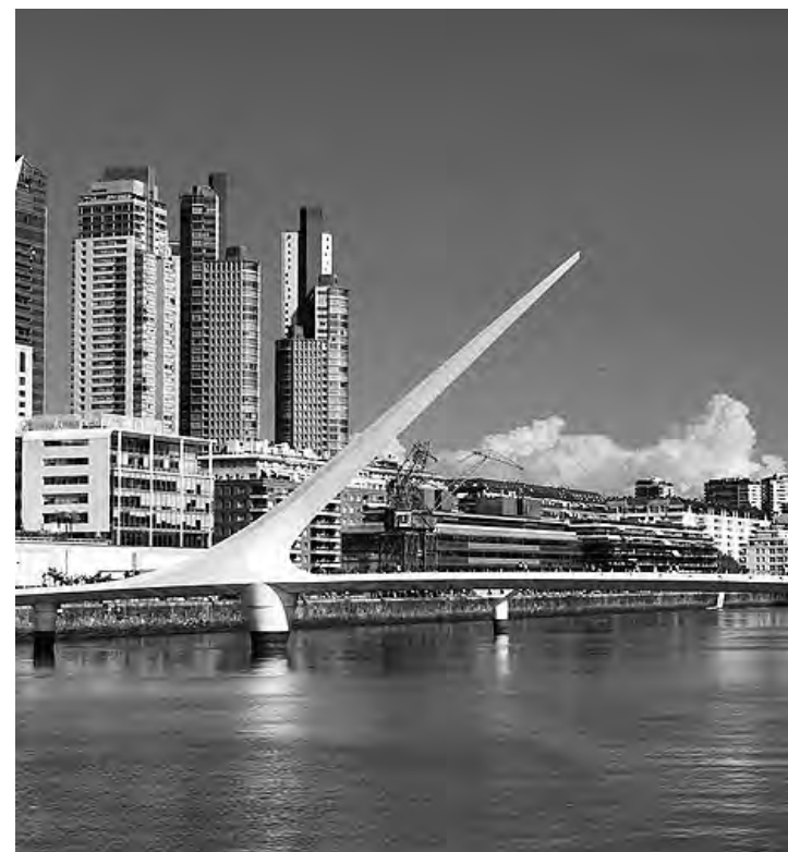
Mientras algunos prefieren la costa y el campo, hay quienes desean pasar sus vacaciones en una ciudad que contenga toda la diversidad e infraestructura de las grandes urbes.

como fuente de inspiración y basado en recomendaciones de viajes y profundizando en sus más de 28 millones de listados, incluidos sus más de 6,6 millones de casas, apartamentos y otros lugares únicos para hospedarse