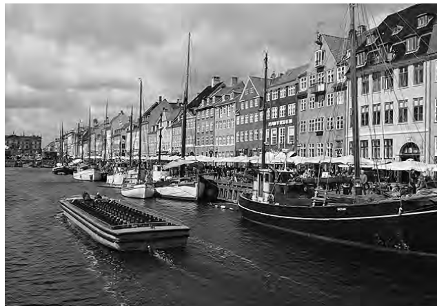
El canal 'Nyhavn' en Copenhague, Dinamarca, se construyó en el siglo XVII para unir el puerto con la ciudad. Hoy está bordeado por casas de estilo holandés en distintos colores que hacen una foto postal que le da identidad.

En ediciones anteriores (ver REGION® Nº 1.357, 1.358, 1.359 y 1.360) publicamos cuatro partes de una serie de notas sobre "Un recorrido junto al Mar Báltico", correspondiendo la primera a la "Planificación", la segunda dedicada a Alemania y Po-