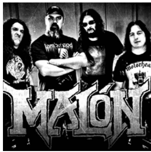
rock banda "Malón". • Quinta Gama: E. Mitre esq. Selva: