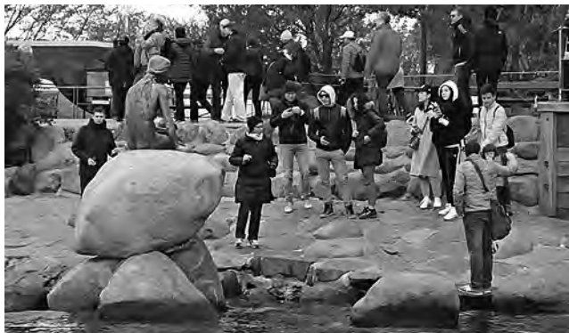
En la actualidad la escultura de "La Sirenita" es el símbolo más prominente de la ciudad de Copenhague.