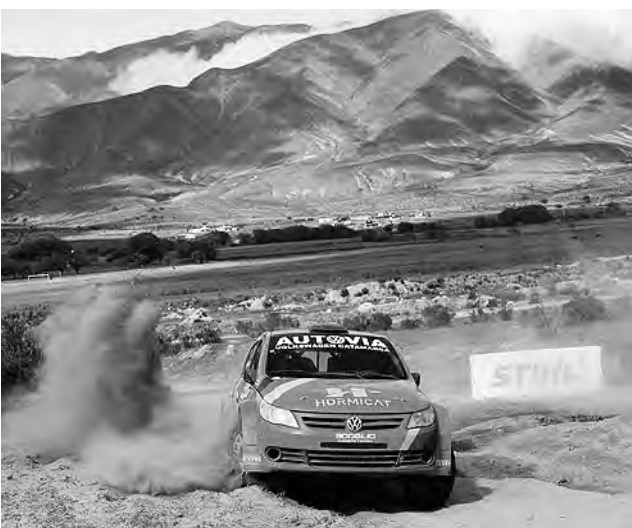
El Ente Mixto de Turismo de Esquel acordó descuentos para la carrera de hasta el 30% en diversos alojamientos.