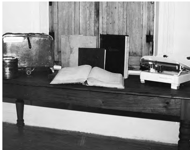
Entre la gran diversidad e importancia de los museos pampeanos, a nivel nacional se destaca el histórico del "Médico Rural Dr. René Favalaro", en Jacinto Arauz.

En 2019 el Día Internacional de los Museos (DIM 2019) es en torno al tema: «Los museos como ejes culturales: El futuro de la tradición».