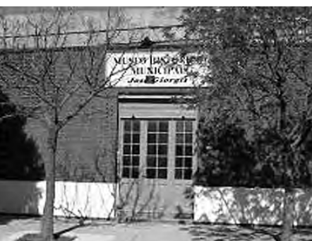
El Museo Municipal de Alta Italia. Funciona como una Usina del pueblo, donde se atesoran cientos de piezas museísticas de la historia local.

En los últimos años se han transcurrido prácticas que se aplican a las cosas que sirven para buscar formas de abordar los conflictos contemporáneos y cuando a nivel de los museos también pueden defenderse problemas de fondo, enfrentándose de manera proactiva a los desafíos que enfrenta esta sociedad. Las instituciones en el mundo de hoy tienen el poder de generar un diálogo entre los ciudadanos, de construir un mundo mejor y de definir un futuro sostenible.