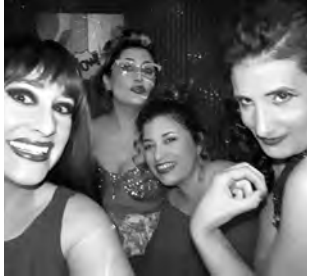
21 hs: obra de teatro "Es más fácil que llorar". $ 200.