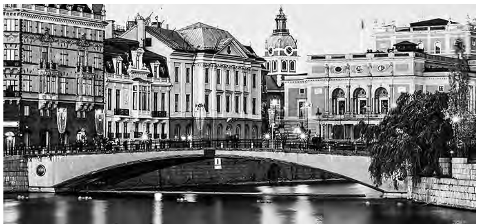
La ciudad de Estocolmo está situada entre el lago Malaren y el mar Báltico y la conforman 14 islas con 57 puentes que permiten circular entre los diferentes barrios.

Todo este ámbito se recorre fácilmente a pie, pudiendo visitarse el Palacio Real, el Palacio Drottningholm, o el Ayuntamiento, junto al agua. La calle Vasterlanggatan es la que sobresale en la visita con galerías, restaurantes y llamativas tiendas.