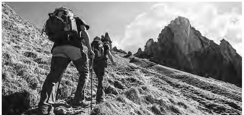
El otoño es la época ideal para disfrutar de temperaturas templadas y observar la transformación de la naturaleza dando largos paseos marcados por una brisa refrescante antes de que llegue el frío del invierno. El senderismo está a la orden del día.

Se trata de un pueblo costero muy recomendado por la comunidad viajera de Booking.com para caminar por la playa, está rodeado de montañas de granito rosa que se alzan sobre las aguas azules de Oyster Bay. El precioso Parque Nacional Freycinet, que está a unos pocos minutos en auto, es un paraíso de Tasmania que ofrece todo tipo de aventuras a pie, desde un paseo relajante hasta una experiencia de senderismo intenso. El mes de mayo es un 36% más barato que la época más cara del año.