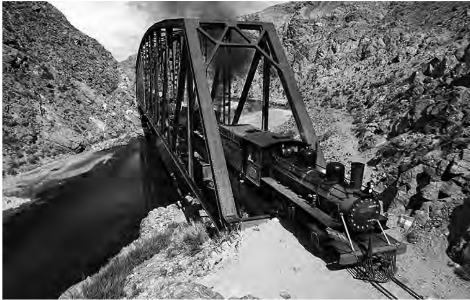
La ciudad de Esquel está entre los elegidos por la comunidad viajera por sus hermosos lagos y abundante vegetación. Desde allí sale el Viejo Expreso Patagónico, conocido como "La Trochita", una joya del mundo ferroviario que propone un paseo imperdible.

Ubicada al pie de la Cordillera de Los Andes, la ciudad de Esquel es un muy buen lugar para hacer base y desde ahí explorar el Parque Nacional Los Alerces, con sus inmensos lagos y su vegetación