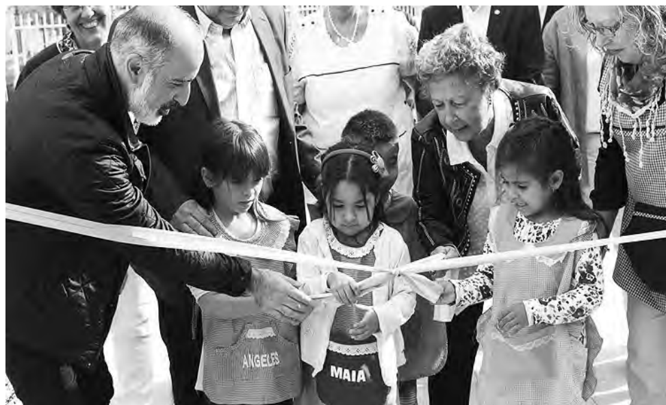
Son más de 26 millones de pesos para el SUM del Barrio "Bicentenario 981 Viviendas", y obras de refacción y ampliación en la Escuela Nº12.

"Hoy estamos concretando la formación profesional que el gobernador anunciaba, espero que la disfruten y que puedan encontrar en el