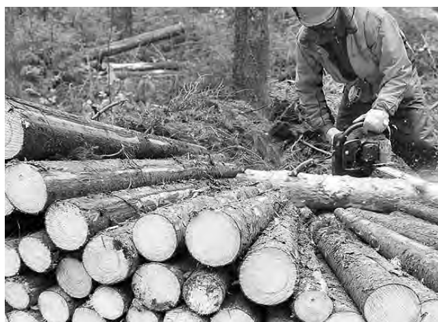
La madera es el material y suministrador de energía más antiguo de que dispone la humanidad. Por su calidad de recurso renovable reviste una importancia especial.

Actualmente las máquinas de control numérico, las sierras computarizadas y las pegajantes automáticas entre otras, están revolucionando el mundo de la madera y nos