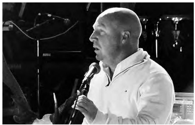
La "Fiesta Pampeana de la Caza Mayor - Menor y el Turismo Cinegético" realizada en Quehué, contó -por primera vez en su historia- con la presencia de un secretario de Deportes de la Nación, en este caso, Javier Mac Allister.

La semana pasada en esta misma hoja, destacábamos la importancia de la Cinegética en la provincia de La Pampa, por su crecimiento deportivo, turístico y finalmente económico, que ha posicionado a la Provincia como un objetivo de Destino Mundial para los deportistas