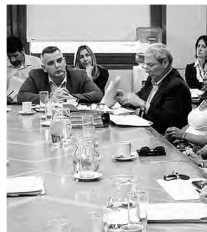
Archivo: Reunión del 22 de noviembre de La Pampa, por el tema "Nuevos inquilinos pagarán más comisiones" que terminó con la aprobación de la ley.