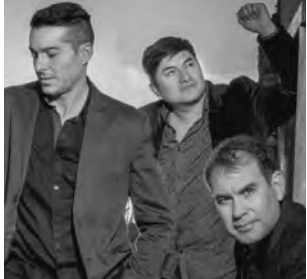
-Vie. 14 a las 21:30 hs: Folclore con Los Caldenes. $ 250.