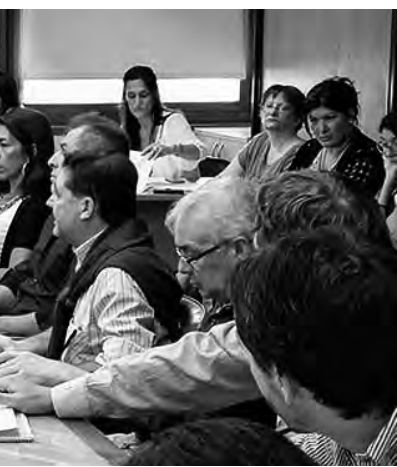
...re de 2017 en la Cámara de Diputados para la Ley de Alquileres en la Provincia, ...ón de lo solicitado por el MIP.

...a tener que ver obligados a desembolsar más de 1 mes por adelantado, como lo establece el Artículo N° 1.196 de nuestro Código Civil y de Comercio de la Nación Argentina.