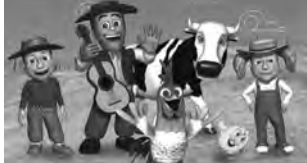
-Sáb. 15 a las 17 hs: Las canciones de la granja de Zenón. $ 450 y $ 400.