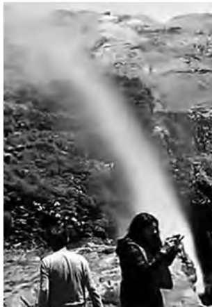
"Cascada Invertida": ubicada en la comuna de San Clemente, producto del viento, sus aguas no logran llegar a tierra, siendo elevada por el aire.

La gobernación de Talca, como administrador del complejo fronterizo y para evitar accidentes ante la masiva llegada de personas, habilitará junto a ese municipio, por tercer año consecutivo, tres miradores por la Ruta Internacional 115 CH, que