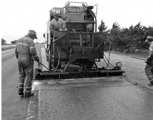
El desarrollo vial actual en la Provincia da cuenta de un total de más de 4.000 km pavimentados.

Comenzaron los trabajos de alteo sobre la RN 35