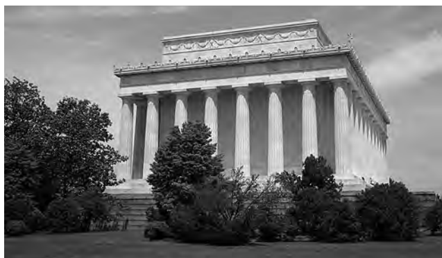
Desde el Capitolio, pasando por la Biblioteca Nacional y el Monumento a Lincoln (foto), todos tienen la grandiosidad de los antiguos templos griegos.

Washington Washington DC, oficialmente denominado Distrito de