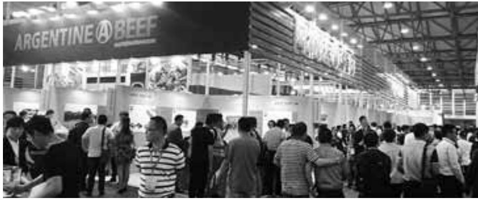
El Pabellón Argentine Beef del IPCVA, fue el más grande de la muestra oriental