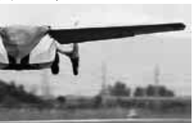
se suma a la carrera tecnológica.

Otro que prometió para el 2017 es una empresa eslovaca con su "AeroMobil" que puede volar casi 700 kilómetros con el depósito lleno y cuando pliega sus alas puede estacionar en el espacio de un auto normal y puede abastecerse de combustible en cualquier estación de servicio típica. En estos momentos están desarrollando también una versión que no necesita de conductor y que también puede volar, obviamente.