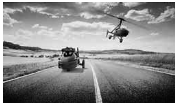
El PAL-V se trata de un giroplano, una aeronave de dimensiones reducidas que vuela según los principios físicos del helicóptero de un triciclo con sistemas de propulsión dual basado en motores Rotax, capaces de soportar la circulación en tierra y en aire.

Mientras que los creadores de "PAL-V" se muestran satisfechos tan solo con haber concebido al único vehículo homologado de aire-tierra respetando estándares europeos y estadounidenses, la gente de "Airbus" la motiva otra consideración: "no se puede ignorar este segmento y quedar fuera