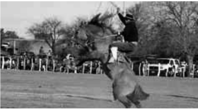
Este año habrá jineteada el domingo a las 18 hs.

Durante los días 19, 20 y 21 de Mayo se llevará adelante la VII Exposición Provincial del Caballo, en el predio de la Asociación Agrícola Ganadera de La Pampa, donde se podrá disfrutar de más de 200 caballos en exhibición, destrezas y este año se suma el atractivo de la jineteada a la pista central de la rural.