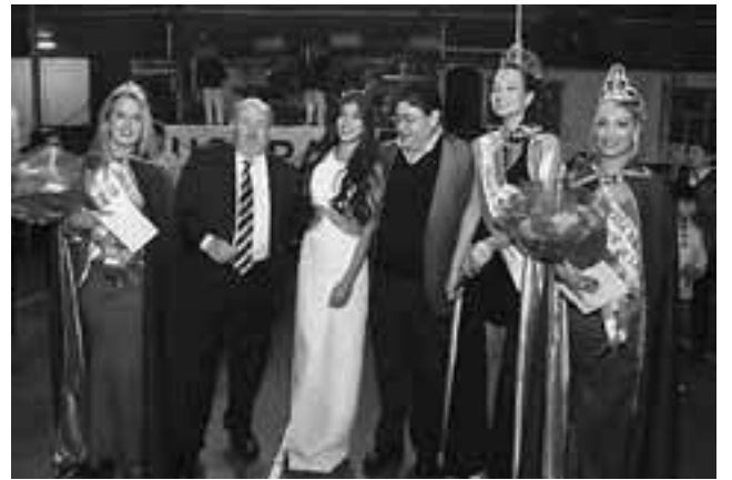
En la foto, Verna y Robledo con reinas y princesas.

El sábado 13 se llevó a cabo en las instalaciones del Club General Belgrano de Santa Rosa, la fiesta anual 2017 de la Unión de los Obreros de la Construcción (UOCRA), evento que congregó a unos 1.300 comensales provenientes de diversas localidades pampeanas y que contó con la presencia del gobernador de la Provincia, Carlos Alberto Verna.