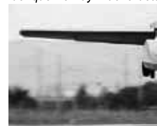
El "Aero Mobil" es otro qu

Así se denomina el proyecto de "Airbus" que busca ser una solución a los embotellamientos en las grandes ciudades -del que no hay mucho deta-