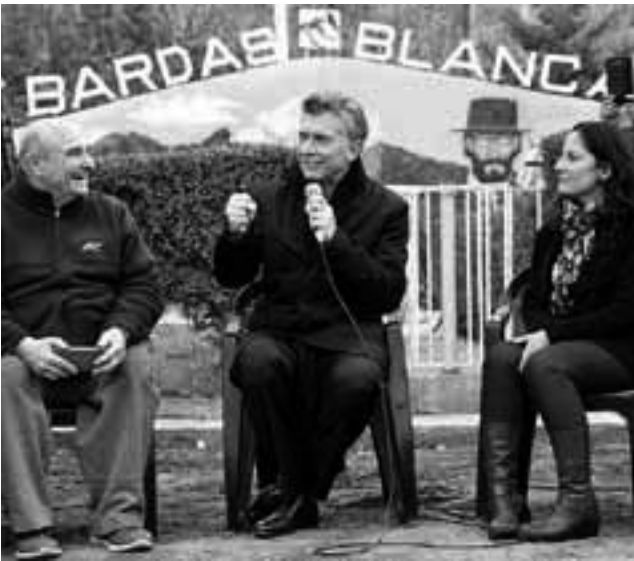
Macri en Bardas Blancas

El Presidente Mauricio Macri visitó la semana pasada el paraje mendocino Bardas Blancas, cercano a Malargüe, donde nace la Ruta Internacional que conduce al Paso Pehuenche.