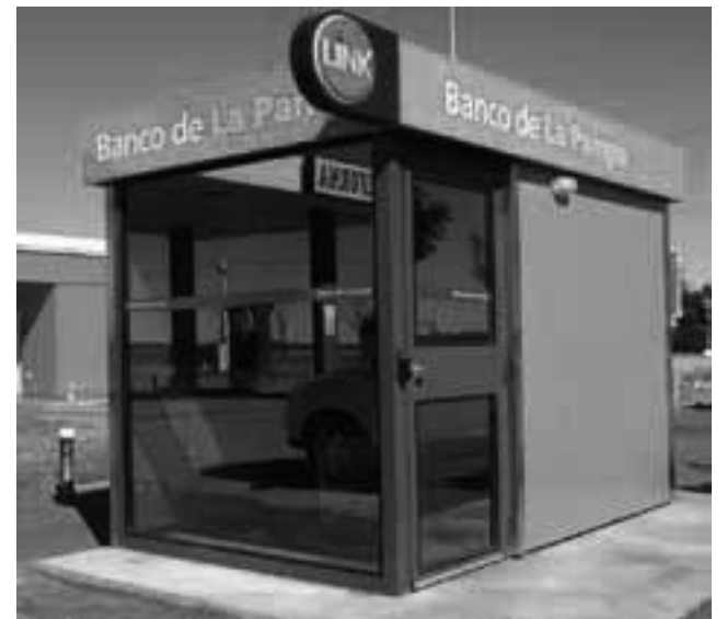
Entre los últimos ATM incorporados a fines de 2016, podemos mencionar el de la localidad pampeana de La Reforma que se inauguró con la presencia del Gobernador Verna.

puertas con un emotivo y recordado acto, contaba su planta con menos de veinte funcionarios y empleados. Actualmente es uno de los pocos bancos provinciales que existen en el país y ha logrado una posición de importancia dentro del sistema financiero nacional. La innovación tecnológica, la capacitación permanente, la cultura corporativa y la calidad en la atención son pilares y fortalezas de una institución pionera.