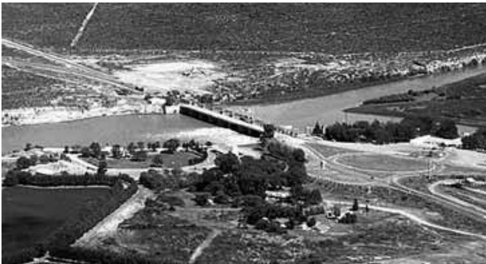
Colonia Catriel en Río Negro y 25 de Mayo en La Pampa, son localidades que están unidas por el emblemático puente. Ambas ciudades son en la actualidad las principales productoras de petróleo de sus respectivas provincias.

El Puente Dique "Punto Unido" que conecta a través del Río Colorado, límite natural entre La Pampa y Río Negro, la ciudad de 25 de Mayo y Catriel, fue inaugurado el día 25 de mayo de 1972 y por lo tanto, en esta fecha cumple 45 años de permanente actividad.