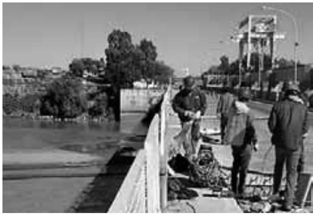
Las obras de reparación, con una inversión de $ 3 millones, estarían terminadas los primeros días de junio.