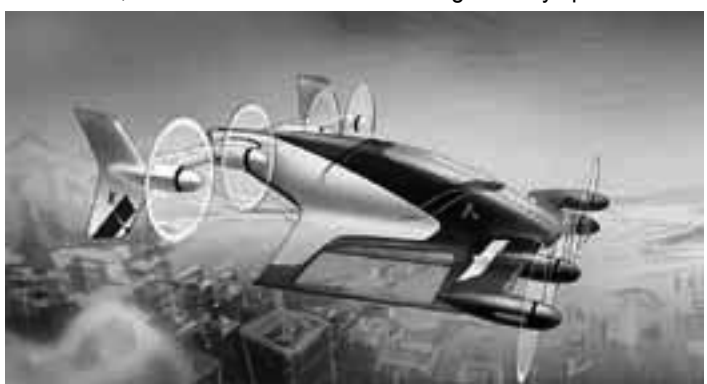
La europea "Airbus" con sede en Francia no se quiere quedar atrás y asegura que antes de que termine este año 2017 tendrá listo su primer monoplaza para "escaparse volando" de los embotellamientos de las grandes ciudades.