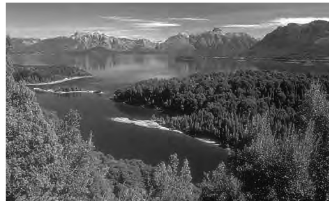
El fuerte viento Kósten recorre la extensión de la patagonia, pasando por el Parque Nacional Nahuel Huapi, en la provincia de Río Negro

Actualmente nadie habla la lengua tehuelche. Pero algunos investigadores, como el Padre Manuel Molina, pudieron tomar contacto con los últimos autóctonos teushen para registrar vocablos de su lengua.