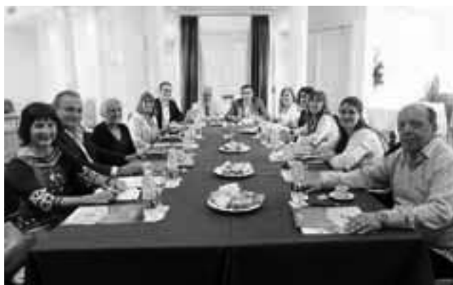
Foto: reunión de los dirigentes empresarios que integran el Departamento de Capacitación y Formación Profesional de FEHGRA. La Filial La Pampa, que es la Asociación Hotelera provincial, no figura en el listado de cursos de mayo.

El último curso que señala la AEHGLP en su página web es