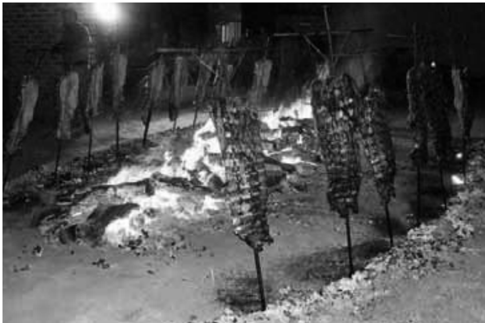
La Fiesta tiene 13 Subsele, la próxima edición clasificatoria es en Santa Rosa, el domingo 15 de mayo y la organización estará a cargo de la Agrupación Tradicionalista "El Indio".