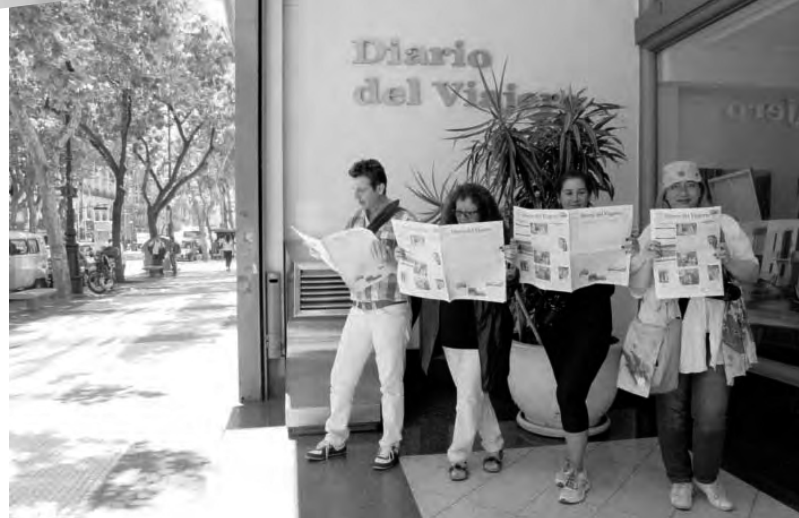
Diario del Viajero , en la vereda del 666 de la Avenida de Mayo, el único medio gráfico que continúa manteniendo la tradición que lo precedió con publicaciones que tenían su sede en la señorial vía porteña