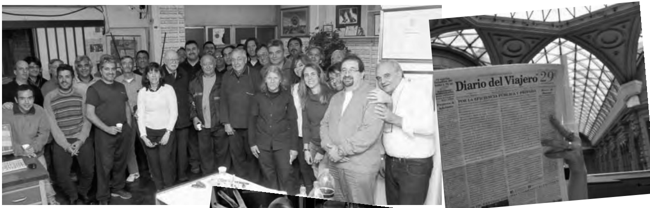
Un equipo de buena fe