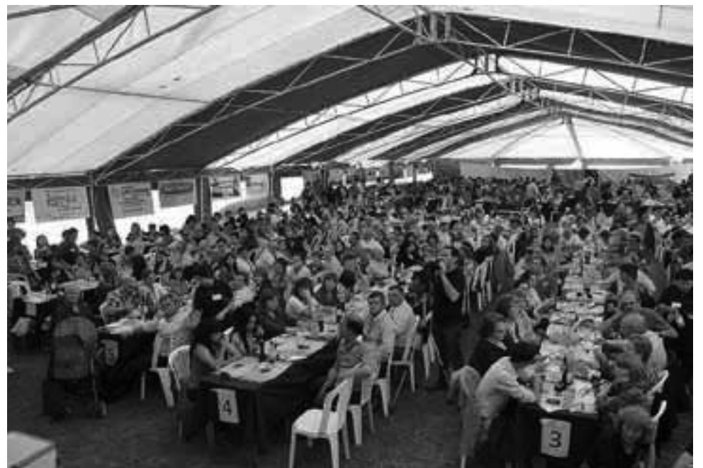
En cada una de las sedes clasificatorias, como parte de la fiesta, la modalidad es vender las porciones de asado que los competidores participantes preparan para la ocasión.

-10ma: Sábado 13 de agosto en General Campos, organiza Centro Gaucho Fortín Pampa.