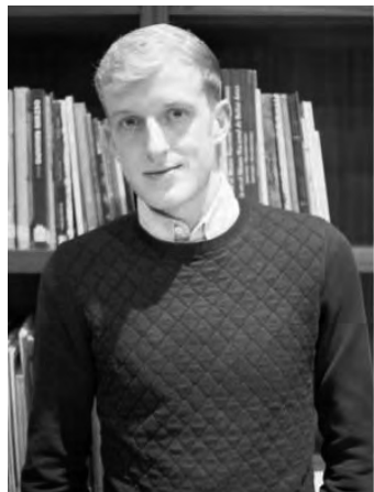
A pesar de no disfrutar cuando le toman fotografías, Edouard Louis posó amablemente.

Louis cambió su nombre para poder tocar temas como la marginación en un pueblo francés, la homosexualidad, la infancia, la dominación y la violencia.