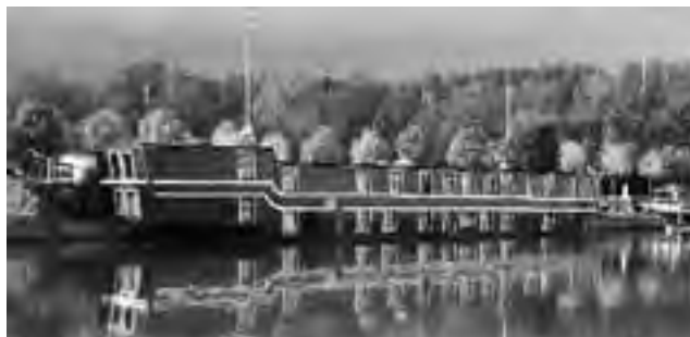
De Barge, antiguo barco transformado en hotel restaurante gourmet en Brujas.