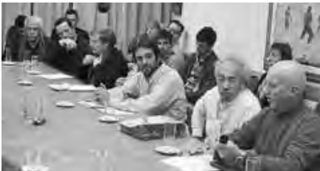
La foto refleja el momento en que la Asociación de Arquitectos de La Pampa estuvo en la Cámara de Diputados el pasado 24 de junio de este año, para tratar de lograr una nueva legislación que disuelva parcialmente el Consejo Profesional de Ingeniería y Arquitectura de La Pampa y habilite la colegiación de los arquitectos.

Recordemos que casi una semana antes ya habían estado directivos de la Asociación de Maestros Mayores de Obras y Técnicos de la provincia, que tampoco están conformes.