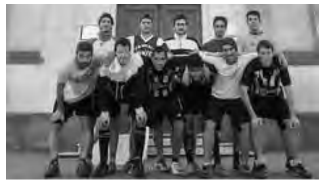
Parte del equipo de 1° división en Colonia San José, durante un entrenamiento.