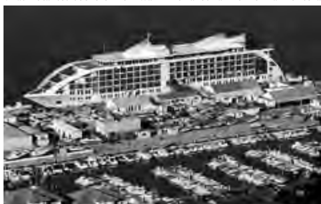
Hotel flotante Sunborn en el puerto deportivo Ocean Village Marin de Gibraltar.