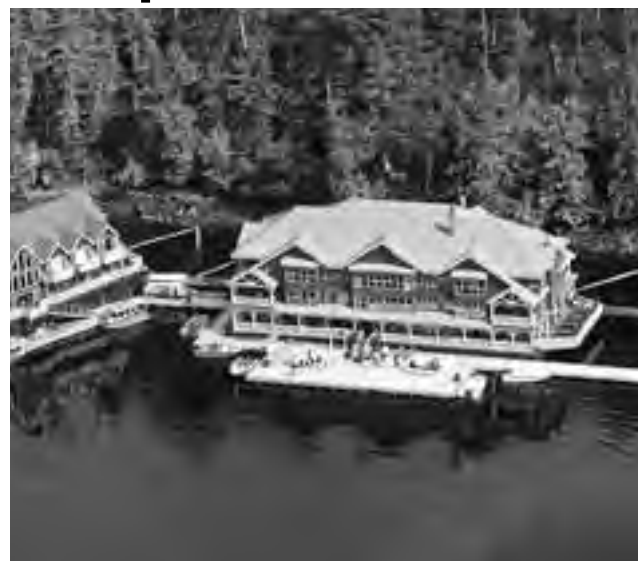
Hoteles flotantes: unas vacaciones nada corrientes sobre mares, ríos y lagos

Se mantienen amarrados durante toda tu estancia, pero la sensación del agua que fluye por debajo es impresionante. Una experiencia que no te deberías perder.