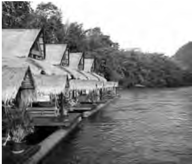
The Floathouse, un resort de 26 villas flotantes sobre el río Kwai en Tailandia

No querrás salir de The Floathouse, este alucinante resort de 26 villas flotantes sobre el río Kwai