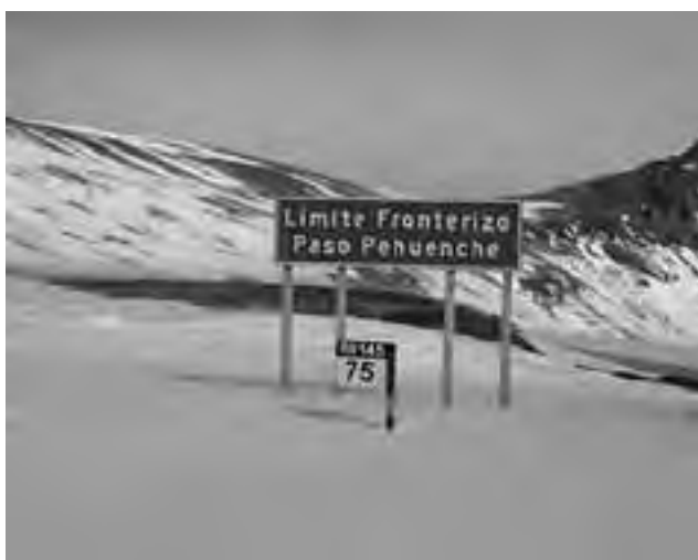
Hay 6 metros de nieve en la zona más complicada. Las dependencias viales de ambos países están trabajando arduamente en la ruta internacional

Desde el 6 de julio se mantiene cerrado el paso El Pehuenche, conexión binacional a la altura de Malargüe, Mendoza y estiman abrirlo en este mes de septiembre a diferencia del año pasado, que se cerró en mayo y se abrió recién en octubre, mientras que este año se mantuvo abierto más tiempo. Por ello, personal y maquinaria de Vialidad trabaja intensamente en despejar la nieve en la alta cordillera que por estos días alcanza los seis metros de altura.