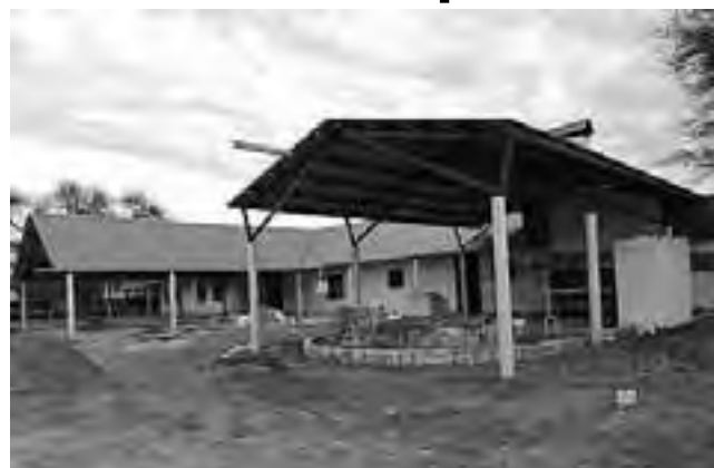
El restaurante y proveeduría "El Quincho de Parque Luro" está quedando a nuevo, ahora con aire acondicionado central y baños modernos. Es de esperar que antes de fin de año se encuentre en actividad y vuelva a ofrecer el habitual servicio de gastronomía criolla con espectáculos regionales.

A muy buen ritmo avanzan las obras que se están realizando en la Reserva Provincial Parque Luro. En el caso del Tambo Modelo ya se han realizado las tareas de arreglo, reparación y pintado de la estructura de tirantes que soportan la cubierta y se avanza en el techado del mismo. En el caso del Quincho Restaurante, con los trabajos sobre el sector de