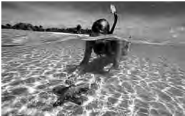
La isla cuenta con un millón y medio de habitantes y una extensión de 2.000 km de costa con magníficas y paradisíacas playas de arena fina y agua transparente.