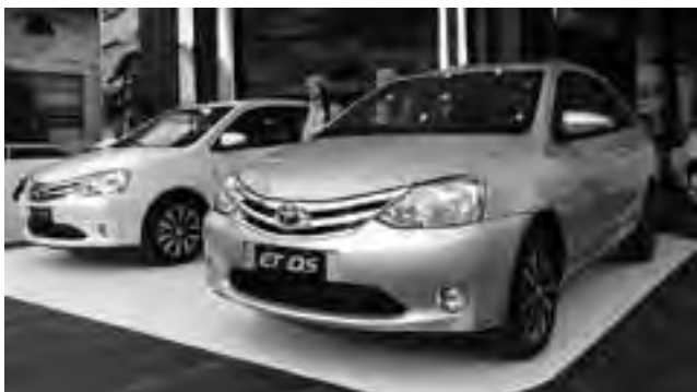
Solo habrá disponibles mil unidades de esta nueva edición limitada de alta gama del Etios (Hatch y Sedán). Próximamente estará desembarcando en nuestro país.

Toyota Argentina está presente en la Exposición de Ganadería, Agricultura e Industria Internacional que se llevará a cabo hasta el 2 de agosto de 2015 en el Centro de Exposiciones La Rural.