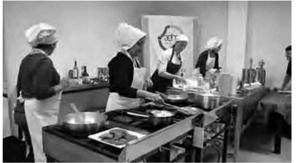
Uno de los cursos de capacitación de FEHGRA a dictarse en la segunda quincena de agosto en La Pampa es el de "Cocina Profesional". En total habrá 51 cursos itinerantes en todo el país.