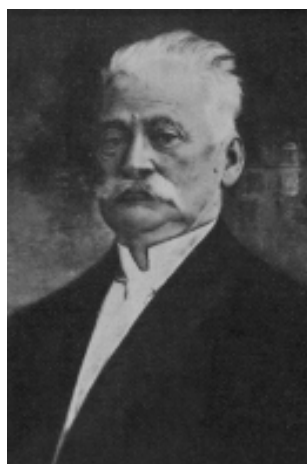
posita: fue el 22 de abril de 1892.

A insinuación del entonces Gobernador del Territorio, Gral Eduardo Pico, prendió en él la idea de fundar un pueblo y no quedó en paz hasta conseguirlo. Lo llamó Santa Rosa, nombre de su es-