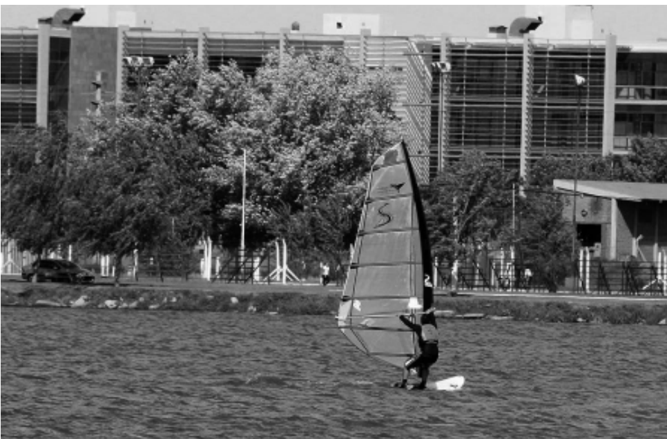
Está ubicada en el cruce de dos de las principales rutas nacionales de Argentina. Esta condición hace de la ciudad lugar elegido para la realización de eventos de toda índole. Con importante infraestructura hotelera, amplios salones y variada gastronomía, es eje distributivo de la actividad turística provincial.

Las inversiones en edificios torres, también se incrementan de manera constante, de manos de los privados; en tanto que nuevos barrios van ocupando la periferia, en un crecimiento continuo con aportes del Estado Provincial y Nacional.