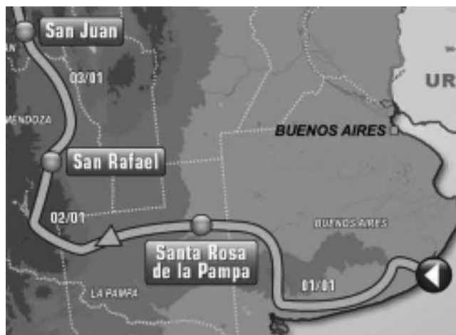
Este es el mapa «oficial» del Rally Dakar 2012. La 1ra etapa es: Mar del Plata - Santa Rosa, que vuelve a ser Sede de Campamento.