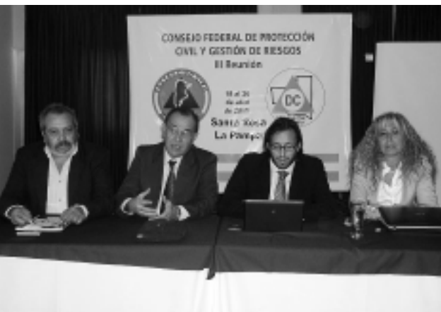
La reunión se llevó a cabo en el Piso 12 del Hotel Calfucurá, en Santa Rosa, organizada por Defensa Civil de La Pampa.

El ministro Rodríguez sostuvo que la representación de las provincias en este encuentro, "es una muestra acabada del compromiso de cada Provincia ante esta problemática, como es la Defensa Civil y las políticas a desarrollar, para enfrentar cualquier catástrofe que se plantee dentro del territorio nacional". Luego hizo referencia "al acompañamiento, predisposición y trabajo de parte de la Dirección Nacional, a los efectos de conformar este Consejo que será el que regule políticas nacionales al respecto", pero también remarcó "el acompañamiento continuo y comprometido para el desarrollo de las políticas y acciones necesarias en cada lugar". Agregó que "esto también marca el compromiso que tiene nuestro país, con otras naciones hermanas, frente a las catástrofes que se puedan suceder". Finalmente Rodríguez dio el saludo y el apoyo de parte del Gobierno Provincial y expresó el deseo de que luego de estas jornadas quede conformado el Consejo Federal.