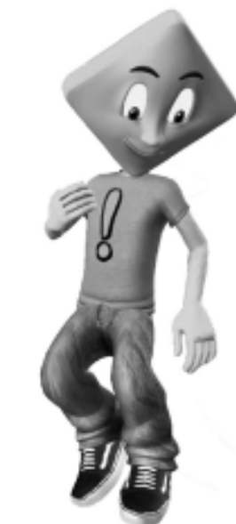
«Vialito», personaje didáctico de la DNV que ilustra los mensajes dirigidos a los escolares de nivel inicial.

Dicha actividad se enmarca en las acciones de Educación y Seguridad Vial que viene realizando la Dirección Nacional de Vialidad en todo el país. Se llevará a cabo por gente del 21° Distrito en forma