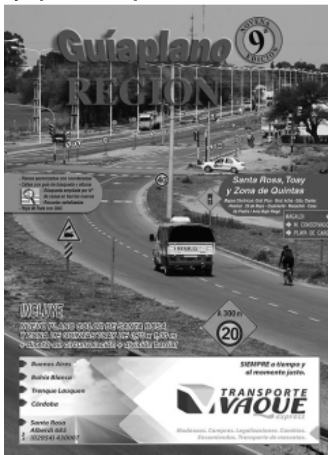
La presente edición de 60 páginas color, todas en cartulina para hacerla más resistente al trabajo diario, sale a la venta con un costo promocional de $ 35, que incluye un nuevo plano color desplegable, de grandes dimensiones.

Nuevo plano color adjunto Por primera vez la edición N°9 se acompaña de un plano color actualizado de grandes dimensiones, donde se dibujó los derivadores y calles colectoras de toda la Av. de Circunvalación, la última gran obra vial dentro de la capital pampeana. El lector notará que seguimos sin colocar flechas del sen-