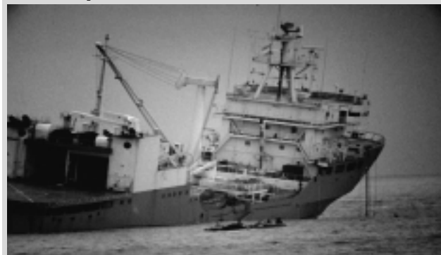
El buque encallado es abandonado por pasajeros que se refugiaron en una base militar norteamericana. Luego también lo abandonó la tripulación.

Construido para la Armada Argentina en los Astilleros Principe y Menghi SA, en Dock Sud, provincia de Buenos Aires, el buque polar "Bahía Paraiso" fue botado el 3 de Julio de 1980, pero recién se incorporó a la Armada Argentina el 12 de noviembre de 1981, naufragando luego, el 31 de enero de 1989, tras siete años y dos meses y medio de servicio naval.