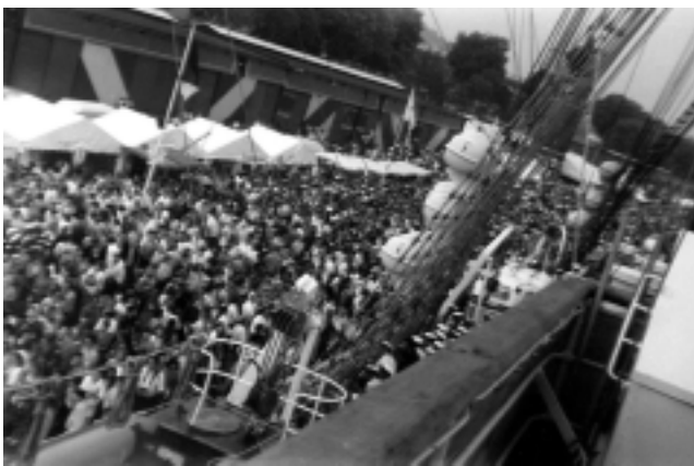
Ariel recuerda que mucho le llamó la atención el recibimiento a la Fragata Libertad en todos lados, el respeto de la gente, la admiración por la nave.

«En Europa fueron días que no puedo explicar con palabras, porque un atardecer estábamos llegando a Hamburgo, Alemania, días más tarde llegábamos a Oslo, Noruega y seguidamente a España, era como