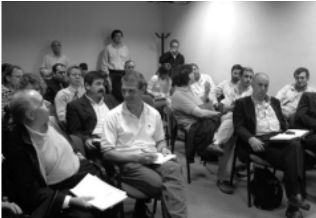
En Santa Rosa se corona la última etapa de la Prueba Internacional. El 15 de enero a partir del mediodía estarán llegando los primeros competidores. El Campamento estará instalado nuevamente en el Parque "Don Tomás".

El pasado martes de esta semana, se llevó a cabo en dependencias de la Subsecretaría de Turismo, la reunión complementaria y última de la Comisión del Rally Internacional, cumpliendo con la función de organización y puesta a punto de aspectos como seguridad, salud, ecología, medio ambiente y otros detalles que hacen a la realización de la carrera.