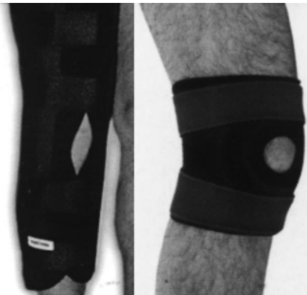
El Neoprene es un material, que al poseer celdas cerradas, mantiene el calor natural del cuerpo en el área aplicada, acelerando el proceso de rehabilitación, sin quitarle elasticidad al músculo.

El Neoprene es un material sintético que por sus propiedades se utiliza cada vez más para deportes o rehabilitación. Entre sus usos se lo puede ver en los trajes de buceo, como antideslizante del mouse de la computadora, en calzados, etc. En el área del deporte y la rehabilitación éste es usado para la confección de prendas que brindará al usuario los beneficios propios de este material.