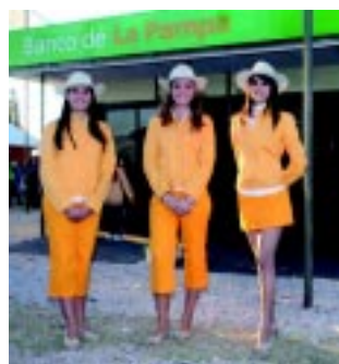
El BLP ha acompañado los eventos más importantes de la Provincia. El último fue en la «Expo PyMES 2009».