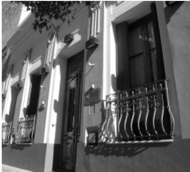
Una de las facetas más renovadoras fue la creación de la Fundación Banco de La Pampa, en 1973. Hoy está en Pellegrini 366 y atesora una importante pinacoteca de artistas locales, además de una muestra de numismática.

El crecimiento del banco tuvo algunos hitos que se pueden visualizar en la expansión edilicia, como la apertura en Santa Rosa de la casa central en junio de 1964, o la adquisición del edificio del ex Hotel Comercio ubicado en 9 de Julio y Pellegrini,