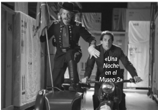
«Una Noche en el Museo 2»

«Una Noche en el Museo 2»: Secuela de la exitosa comedia "Una Noche en el Museo" en la que un sereno del museo de ciencias naturales de Nueva York (Ben Stiller) ve cómo todas las exposiciones del museo cobran vida, incluido el T-Rex, y el mismísimo presidente Roosevelt (Robin Williams). La trama será trasladada a la ciudad de Washington, donde el sereno será contratado por el Museo Smithsonian, lugar que alberga los más importantes recursos históricos conservados en los Estados Unidos. Y una noche una aventura de dimensiones épicas comienza... Con Ben Stiller, Amy Adams, Owen Wilson, Robin Williams, Steve Coogan y otros. ATP. 105 min. En castellano.