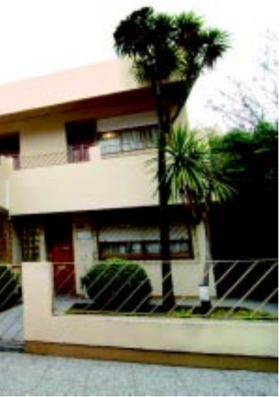
Por iniciativa del BLP, en 1978 nació la Mutualidad del Personal del BLP, institución sólida con sede propia que ha servido para fomentar diversos servicios de asistencia, capacitación y recreación.