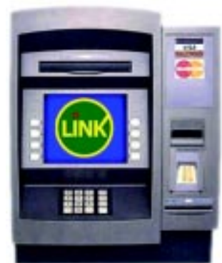
El BLP fue pionero en el proyecto colectivo de la creación de la red de cajeros Link, una marca modelo.