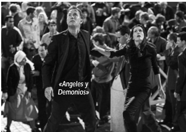
«Angeles y Demonios»

«Angeles y Demonios»: Tom Hanks vuelve a interpretar el papel de Robert Langdon, un catédrico de la universidad de Harvard experto en religión. Cuando Langdon descubre evidencias del resurgir de una ancestral hermandad secreta conocida como los Illuminati (la más poderosa organización clandestina de la historia), se enfrenta también a una amenaza mortal contra la existencia del mayor enemigo de esta organización secreta: la Iglesia Católica, y la elección de un nuevo Papa será el momento justo para la venganza... Con Tom Hanks, Ewan Mc Gregor, Ayelet Zurer, Stellan Skarsgard, Pierfrancesco Savino y otros. Thriller. AM13. 140 min