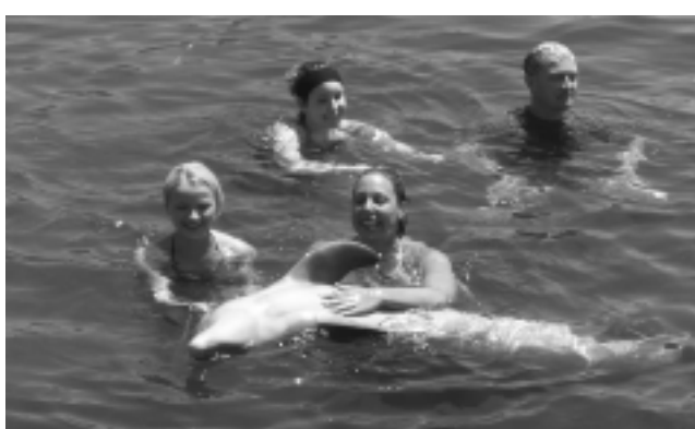
La variedad en los atractivos y excursiones en el exterior, donde el trato con el pasajero es excelente, marcan diferencias que el viajero sabe valorar.

Nahuel Huapi se publicita como oferta en u$s 140 la noche por persona con desayuno.