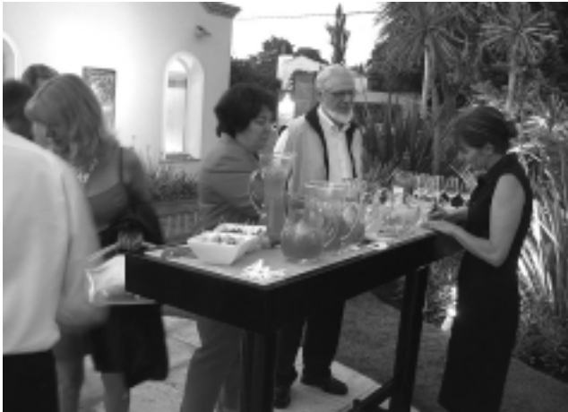
Tanto en la recepción como en el transcurso de la noche, VinoTeKa ofreció distintos tipos de vinos y aguas saborizadas exóticas.