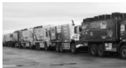
Camiones participantes durante el embarque en

Evento fuera de las normas, el Dakar goza de una exposición mediática muy importante. De entrada, la aventura de los primeros competidores sedujo a la televisión francesa, luego toda Europa se contagió y cruzó los océanos. Desde ese momento, las imágenes del rally se difunden en 189 países del planeta, 80 canales comunican la actualidad de la carrera, cada día, los helicópteros de la televisión que transmiten las imágenes, lanzan una competencia contra reloj. Sólo en el Campamento habrá 25 canales de TV extranjera. En 2009, el rally va a generar alrededor de 650 horas de difusión televisiva en el mundo, cobertura mediática estimada en 100 millones de Euros.