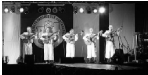
El domingo fue la noche record de asistencia que congregó a gente de diferentes ciudades y provincias.

El domingo fue una noche especial, con una llovizna que acompañó refrescando el predio, pero inusual, ya que la gente comenzó