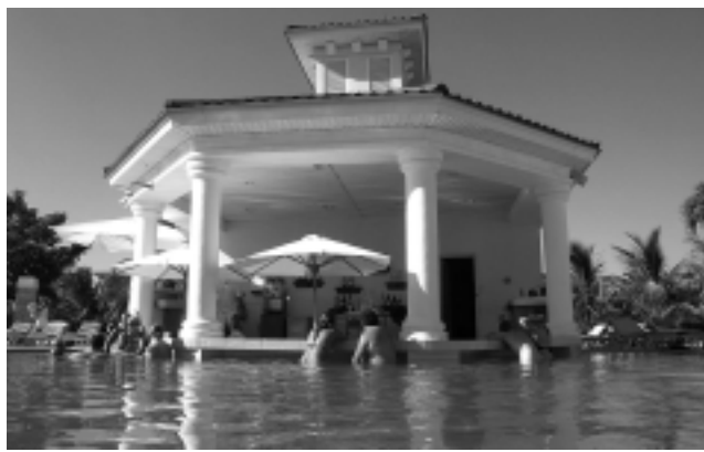
El Caribe sigue ganando adeptos no sólo por la bendita naturaleza, sino por el buen servicio hotelero. Los paquetes «All Inclusive», invento jamaicano ya popularizado, son algo así como un crucero en tierra, donde todo está previsto.