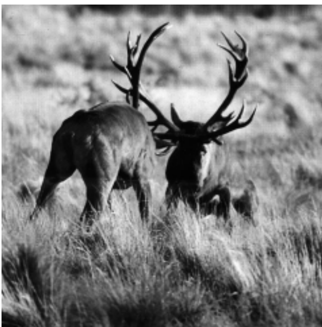
Fotografía de Marcelo Dolsan con la que se promociona el producto turístico «Brama 07» - Avistaje de Ciervos Colorados en la Reserva Parque Luro, que comienza el 7 de marzo.