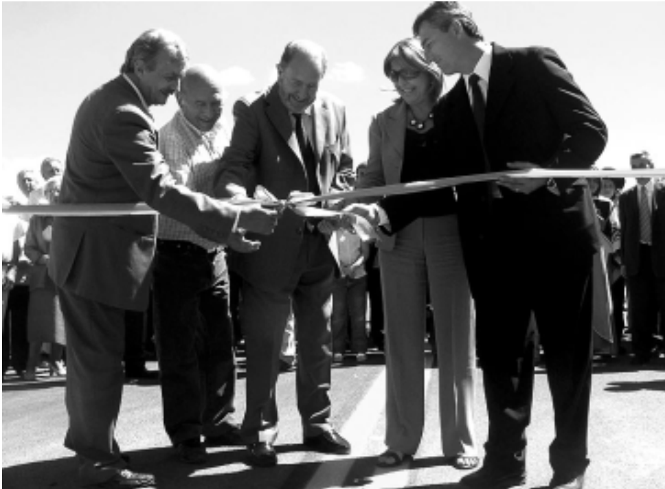
El acto inaugural del primer tramo de la estratégica «Ruta de la Cría» (ver gráfico en esta edición), fue en la intersección de las rutas provinciales 10 y 105.

El fin de semana que pasó el gobernador Verna inauguró con un corte de cintas el primer tramo pavimentado de 37 km. de la «Ruta de la Cría». Acompañaron el acto la vicegobernadora Durango y los intendentes Norberto Nicolás de Victorica y Luis Orgales de Carro Quemado, las dos primeras localidades que quedan unidas por asfalto a partir de esta obra. Participaron además funcionarios del Poder Ejecutivo, legisladores, intendentes municipales de la zona, productores rurales e integrantes de entidades que promovieron el proyecto como la Fundación Loventué. Verna anunció en la jornada, que ya está en marcha «el segundo tramo que va desde Carro Quemado hacia El Durazno (28 km) con un plazo de ejecución de 360 días, y esperamos tener licitado el tercer tramo antes de fin de año, desde El Durazno hasta la ruta 18».