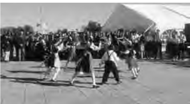
En el acto inaugural se entregaron presentes a las autoridades y participantes, luego el grupo "Meine Leute" bailó danzas tradicionales alemanas.

Amsé, agradeció el acompañamiento del sector privado y la participación resaltando dos charlas relacionadas con unos convenios que serán rubricados próximamente entre los Gobiernos Nacional y Provincial. Por un lado, en relación al Plan Federal de Turismo Sustentable y su vinculación y puesta operativa del Plan Provincial y por otro lado, Incubadoras de Empresas del sector que "se seleccionaran para poder brindarles apoyo y seguimiento durante dos años en el contexto del mercado nacional e internacional", especificó Amsé. Asimismo, se abordaron temas inherentes a la Marca Provincia y su futuro desarrollo y a la modalidad de Turismo de Reuniones, su crecimiento a nivel nacional y la creación de un ente mixto para la captación de eventos como una alternativa a trabajar en la capital pampeana y así posicionarla como sede de jornadas, ferias, convenciones, congresos.