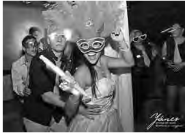
El "1er Encuentro para organizar tu evento", es algo que jamás se realizó antes en La Pampa y reúne a los prestadores de servicios de "El alma de la fiesta".

"El Alma de la Fiesta" está formado por un grupo de profesionales de diferentes especialidades abocados a eventos sociales y particularmente apasionados en la tarea que cada uno lleva a cabo. Esta pasión hizo que tuvieran la inquietud hace un tiempo de poder unirse para compartir experiencias, modalidades de trabajo, teniendo en cuenta la evolución exponencial que la organización de un casamiento o fiesta ha tenido en los últimos años y la complejidad que significa para el potencial cliente asesorarse, comparar y finalmente elegir quienes podrán hacer realidad las expectativas de una fiesta exitosa. Por eso la necesidad de crecer, ca-