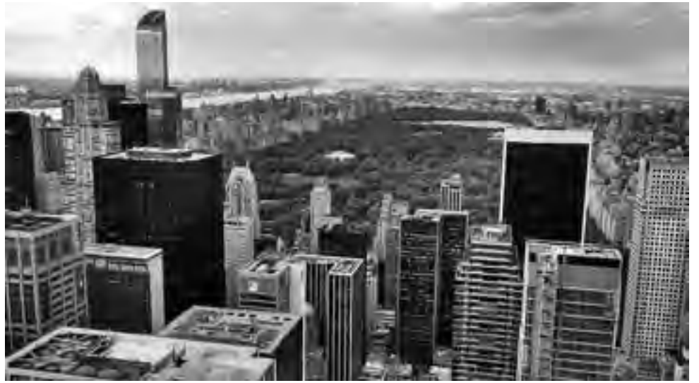
Desde ningún otro lugar se descubre el Central Park, sino desde el "Top on The Rock" del Rockefeller Center.

Ubicado sobre la 5ta Avenida y la Calle 34, a unas tres cuadras del estadio Madison Square Garden, el rascacielos "Empire State Building" es uno de los íconos distintivos de la ciudad, por su belleza, su historia y su gran altura, siendo el