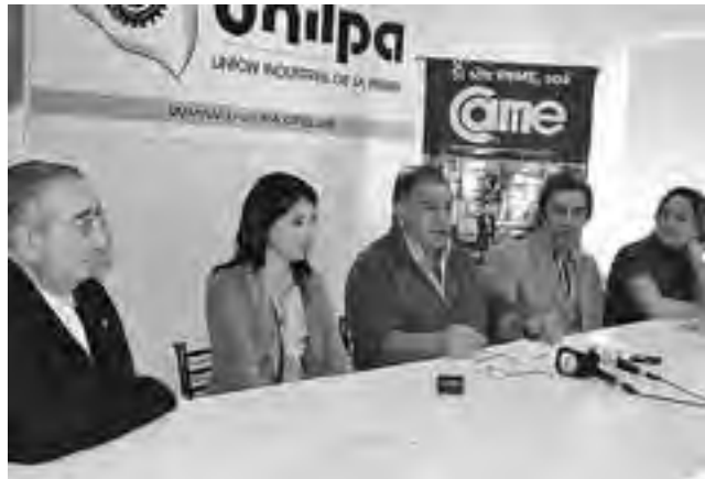
La entrega será gratuita para bares, confiterías, comercios, hoteles y lugares de acceso público y semipúblico.

En una conferencia de prensa realizada en la sede de la Unión Industrial de La Pampa (UNILPA), se anunció la pronta gestión y entrega gratuita de decodificadores enmarcados en el avance del sistema de Televisión Digital Abierta, que serán destinados a bares, confiterías, comercios, hoteles y lugares de acceso público y semipúblico.