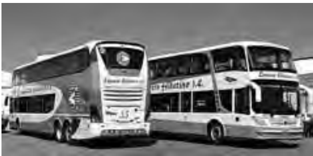
El Servicio “Suite” incluye servicio a bordo con cena caliente, bebidas y desayuno.