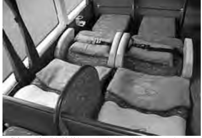
El Servicio "Suite" de 22:40 hs, es un coche cama doble piso, con inclinación regulable de hasta 180° y una superficie por pasajero de 0,90 x 1,80 metros.