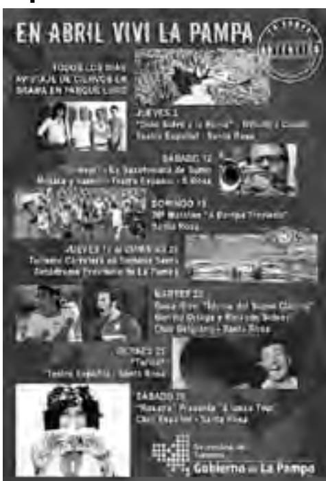
La SecTur promocionará en Bahía Blanca y su amplia zona de influencia, las actividades más importantes programadas para el mes de abril en la Provincia.

y cultural de mucha importancia para la región, en donde se presentan espectáculos de primer nivel; cursos, seminarios y conferencias con la participación de los principales referentes de cada especialidad; Realización de rondas de negocios nacionales e internacionales; Actividades artísticas, deportivas, y de interés general.