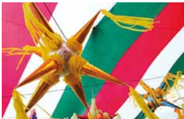
Los mexicanos festejan rompiendo la piñata con forma de estrella con siete picos que representa los siete pecados capitales.

Adelantándose a la Navidad, www.trivago.com.ar confeccionó una lista con 10 curiosas tradiciones que se llevan a cabo en estas fechas alrededor del mundo. Desde costumbres religiosas hasta prácticas más modernas, buques navideños, piñatas, ropa interior y cadenas de comida rápida.