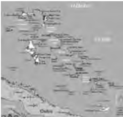
Las islas que conforman este archipiélago, están arriba de Cuba, cerca de las playas de Miami.

Un lugar imponente y tradicional es la "Escalera de la Reina" que cuenta con 65 escalones en total, tallados a mano por esclavos sobre la piedra caliza. Lo importante de esta obra es que para construirla se cercenó una montaña y esa escalera permitía no solo divisar a los posibles inva-