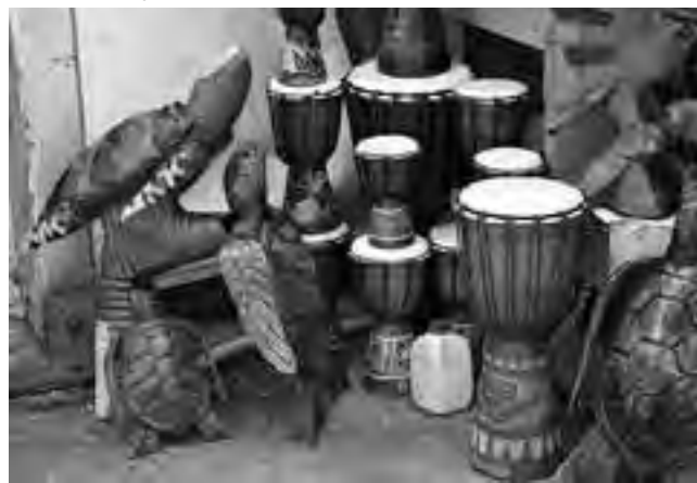
A la hora de realizar compras es importante tener en cuenta sus artesanías y elementos típicos. Otra particularidad de Bahamas está en su música con sus talentosos intérpretes que transmiten a todo el mundo sus compilaciones musicales.