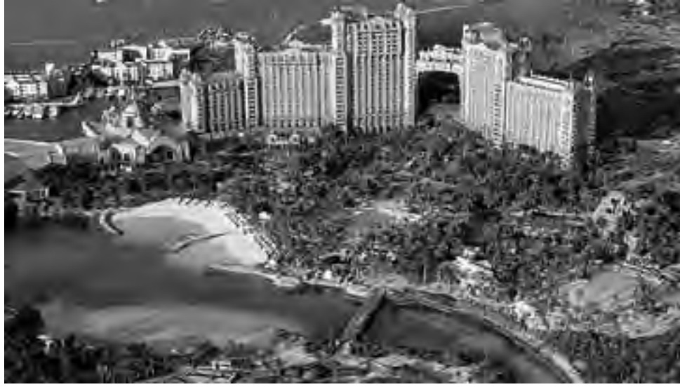
La capital Nassau y el imponente hotel Atlantis. Puertos, ensenadas y bahías conforman su archipiélago. Mezcla de culturas con raíces africanas, británicas y caribeñas permiten componer un rasgo muy personal y especial de sus habitantes.

Recorrimos parte de la ciudad, principalmente su centro muy próximo al puerto de cruceros. Allí arriban permanentemente