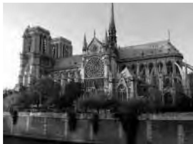
La iglesia de "Notre Dame" vista desde el Río Sena, una opción navegable para un city tour distinto, muy recomendable, para hacer en París.

Desde hace cinco semanas (ver REGION ® N° 1.109 al 1.113) venimos publicando este informe de viaje que consta de varias partes. En las primeras notas resumimos el recorrido de un Crucero Transatlántico de 20 días, con partida desde Buenos Aires y destino final Valencia. Desde la edición anterior, comenzamos con el trazado propuesto en tierra, en