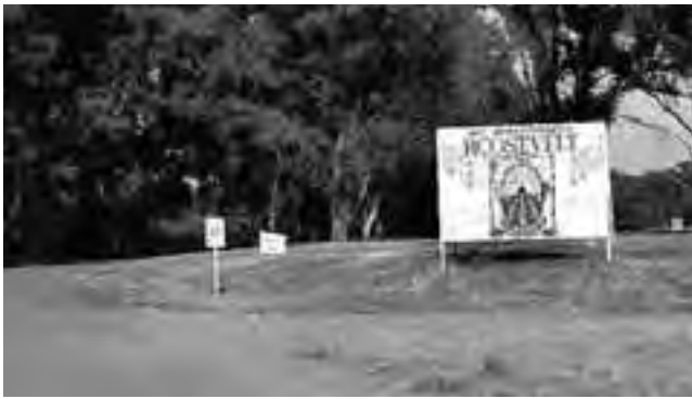
Acceso a Roosevelt.

La localidad bonaerense de Roosevelt, que integra el Partido de Rivadavia, cumple 100 años el próximo jueves 5 de diciembre.