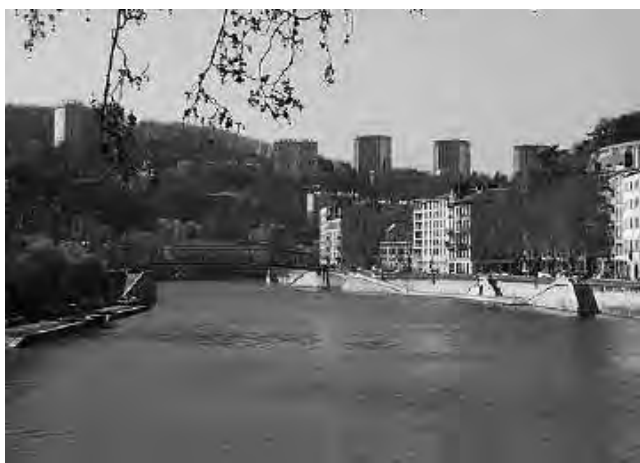
Situada entre los ríos Ródano y Saona, Lyon es la segunda ciudad más grande de Francia después de París y la que tiene más puentes en todo el planeta.

La semana que viene, continuamos a Brujas, en Bélgica; llegamos a Amsterdam en Holanda; y cruzamos en ferry hasta Londres, en el Reino Unido.