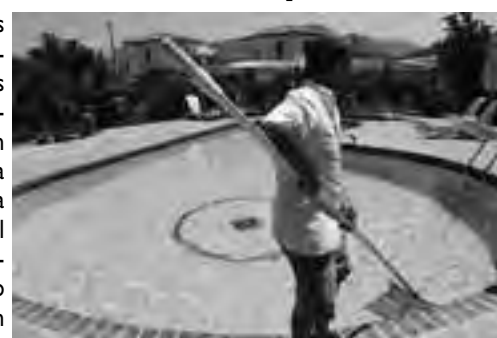
Sea una piscina grande o chiquita, el agua debe recibir tratamiento para que todos puedan disfrutarla y para eso hay que solicitar asesoramiento en los comercios especializados.

A todos nos encanta disfrutar de los baños en la piscina, especialmente en verano, pero a nadie le gusta llevar a cabo el mantenimiento. No tan solo se trata de un tema estético, sino también de salubridad, ya que si no mantenemos limpia nuestra piscina, ésta puede convertirse en un foco de infecciones. Para evitarlo, durante todo el año deberemos realizar algunas acciones que nos ayuden a conservar el agua limpia.