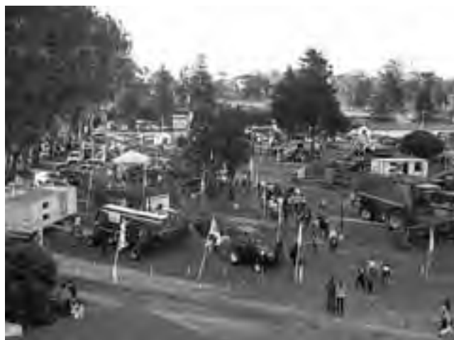
Una buena cantidad de stands del agro, el comercio y la industria, ya han comprometido su presencia en América, Estación Rivadavia.

El primer fin de semana 1, 2 y 3 de noviembre, la Sociedad Rural de Rivadavia realizará la "11ª Muestra Agrícola, Comercial e Industrial de Rivadavia", con un importante ciclo de charlas que ya inician este lunes 28 de octubre.