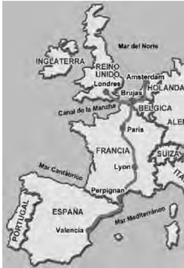
El recorrido propuesto en auto, no es un viaje caro teniendo en cuenta el destino. Para hacerlo bien y que resulte conveniente hay que programar con tiempo. Esto hará que consiga las mejores tarifas en transportes y hotelería. Tómese un año para hacerlo, Europa seguirá estando allí. Mientras tanto, disfrute de esta serie de notas que quizá le puedan ser de utilidad.

El alquiler de un auto es muy conveniente. Para un plazo mayor a una semana, calcular entre 15 y 30 euros diarios, con kilometraje sin límites, dependiendo del vehí-