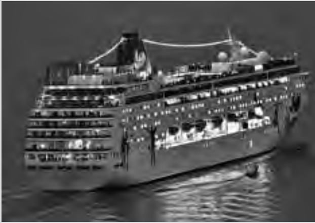
20 días de navegación con paradas en destinos espectaculares, 19 noches de alojamiento de lujo, 100 comidas a bordo y espectáculos diarios, pueden costar apenas un poco más que un viaje en avión.

La ilusión de realizar un viaje transatlántico en barco, como lo hicieron nuestros abuelos o bisabuelos, siempre resulta un sueño apasionante de todos, que sólo se ve amedrentado por la idea de un alto costo.