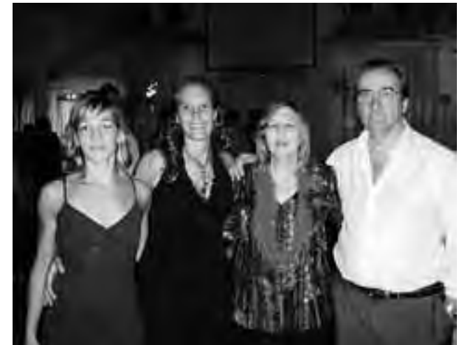
Integrantes de la empresa familiar "Supermercado Gabi And" en la actualidad.

A mediados de 2005 abrieron su primera sucursal en Av. Luro 65. «Las instalaciones de las dos