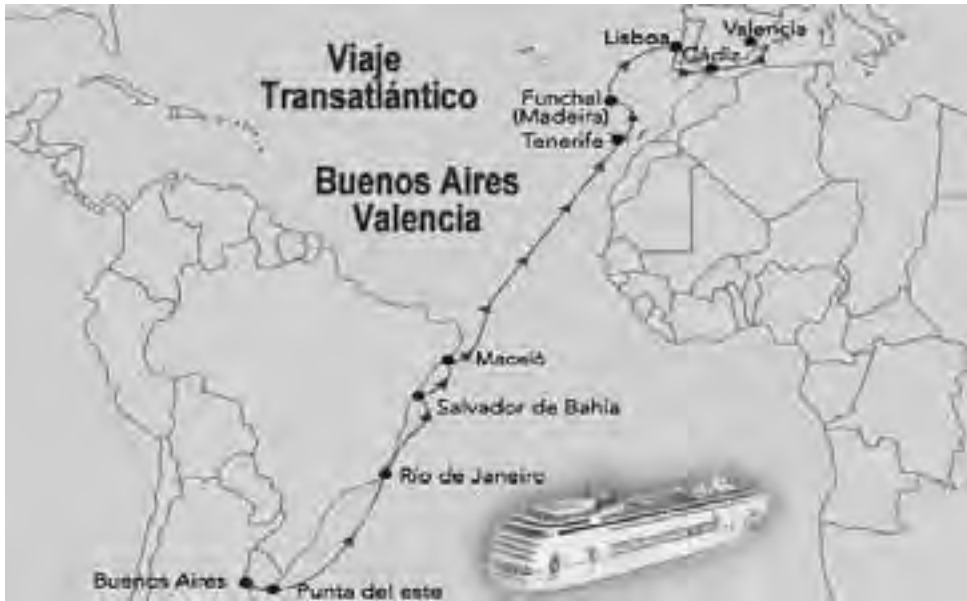
20 días de navegación anclando en Uruguay, Brasil, Islas Canarias, Isla de Madeiras, Portugal y España, luego en auto.

A pedido de los lectores, repetimos este informe que constará de varias partes, donde iremos haciendo recomendaciones al lector para encontrar las variantes más económicas junto a alternativas probadas de buen resultado.