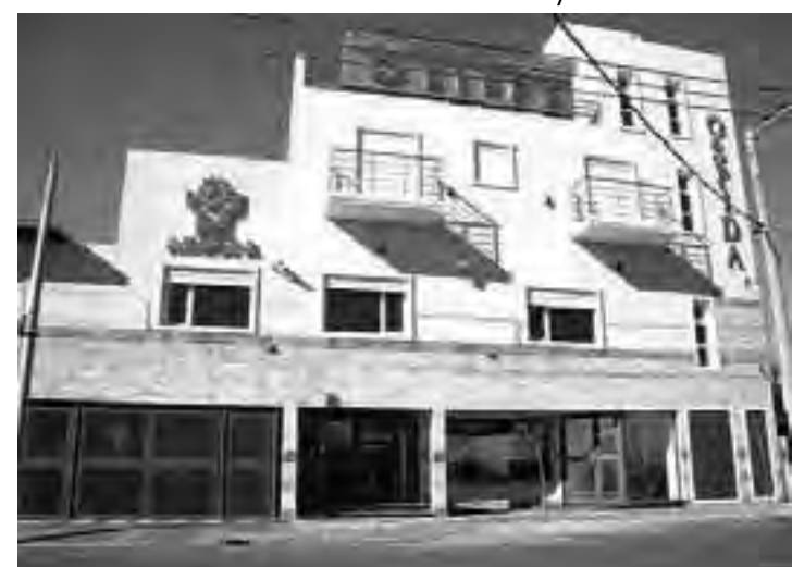
Edificio del Sindicato Gráfico Patagónico en la calle Río Negro N° 327 entre Almirante Brown y Estrada, sede del nuevo salón.

insonorización, Equipo de sonido para conferencias, cabina para DJ, iluminación, cocina, baños, baño para discapacitados aire acondicionado con losa radiante y wi fi.