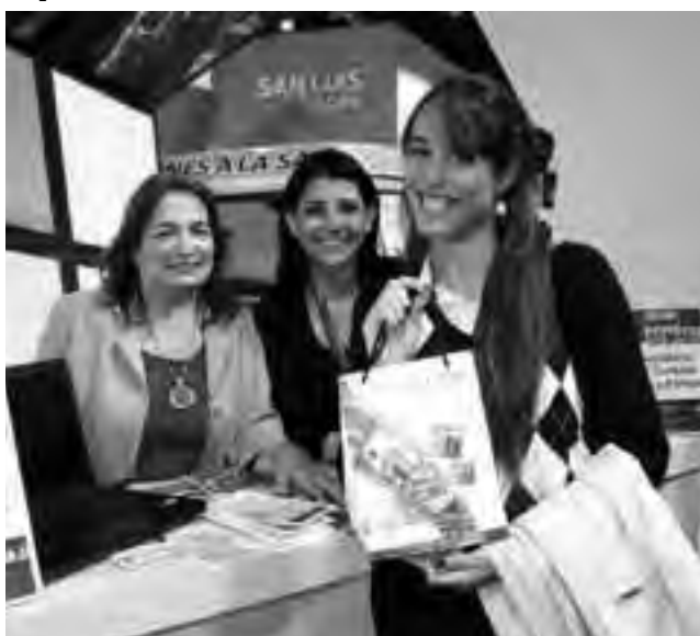
La Dirección de Turismo de Santa Rosa en conjunto con la Cámara de Turismo, realizaron sorteos de excursiones y estadias para la ciudad capital.

En tanto, la Secretaría de Turismo, agradece el acompañamiento permanente del sector privado, que día a día trabaja para el desarrollo y fortalecimiento del sector, impulsando constantemente la innovación de actividades en la Provincia.