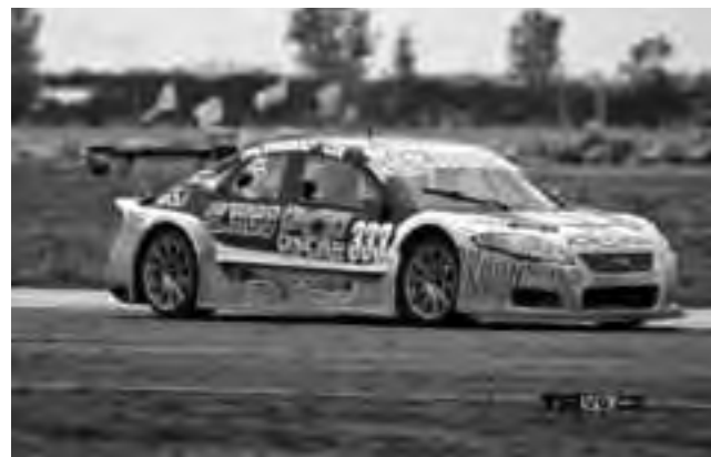
El equipo del ganador del V6 apeló la decisión y la definición quedó en suspenso. "Quiero comentarles a todos que el auto no está fuera de reglamento, quisieron buscarle la quinta pata al gato, pero esta todo en orden. Para aclarar también que la medida del piso que da la carga delantera está dentro del reglamento, para los que están hablando sin saber", comentó luego de la carrera en su twitter (@GustiMicheloud) el piloto.