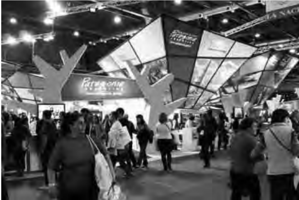
Como todos los años, dentro del espacio del Ente Oficial de Turismo Patagonia Argentina, La Pampa contó con un stand donde, el sector público y privado, realizó la promoción de los servicios, destinos y productos turísticos que ofrece la Provincia.

El sábado, en el auditorio "Viaja por tu país", a cargo de la Directo-