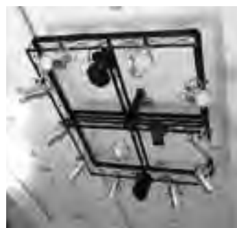
Se destaca un moderno equipamiento y buena infraestructura de servicios