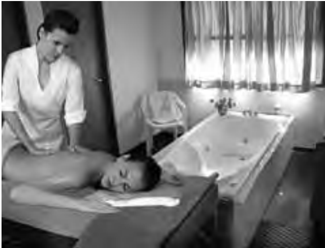
Los dos establecimientos que explotan aguas termales en las localidades pampeanas de Guatraché y Bernardo Larroude, ofrecen paquetes especiales.

Abuelos" está ubicado en Intendente Alvear y dispone de un hermoso minizoo regional, con nuevas cabañas para alojamiento, muy bien equipadas.