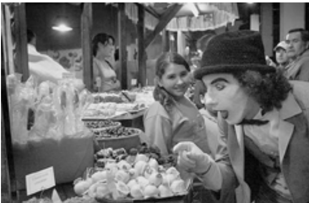
Si coincide con su visita, no se pierda los espectáculos de la 28ª Fiesta del Chocolate Alpino en Villa General Belgrano, provincia de Córdoba.

El receso escolar de julio, que da inicio a las "Vacaciones de Invierno", comienza esta semana en la provincia de La Pampa y a pedido de nuestros lectores, republicamos el informe del año pasado (actualizado) sobre destinos de Argentina a menos de 600 km de distancia, donde hay varias opciones para que podamos hacer una salida dentro del país con la familia. En este informe, apoyados con los planos de las "Hojas de