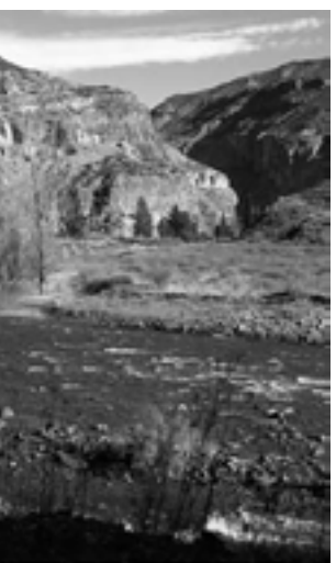
Se encontrará un sin fin de atractivos, desde las cabalgatas y excursiones a la montaña.

Este recorrido -hacerlo de día- es un viaje indescriptible, por su belleza natural. En el camino encontrará un sinnúmero de atractivos, desde la posibilidad de hacer rafting, hasta cabalgatas y excursiones a la montaña. Desde la