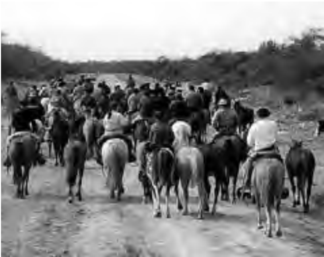
Este 22 de junio nos unimos entre todos para prevenir el flagelo de la droga. Salida sábado 22 de junio desde Quetrequén a las 8:00 hs.

Con el fin de dejar un mensaje contra las drogas, las agrupaciones gauchas de Realicó, Maisonave y Villa Huidobro realizarán una cabalgata desde la localidad de Quetrequén hasta Realicó. La propuesta de las agrupaciones es sumarse simbólicamente en esta lucha en el marco de la prevención de adicciones que viene realizando la Secretaría de Desarrollo Social dependiente de la Municipalidad de Realicó. Se invita a todos aquellos que no puedan llegar por diferentes razones a Quetrequén pueden unirse a la delegación en la localidad de