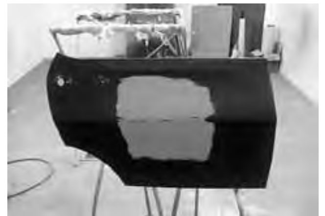
La charla técnica y práctica incluyó consejos para una aplicación exitosa, preparación de la superficie, tiempos de secado y demás.

"Pinturerías Deballi" agradece a los técnicos de Dupont y en especial a todos los profesionales por su buena predisposición y participación durante la charla.