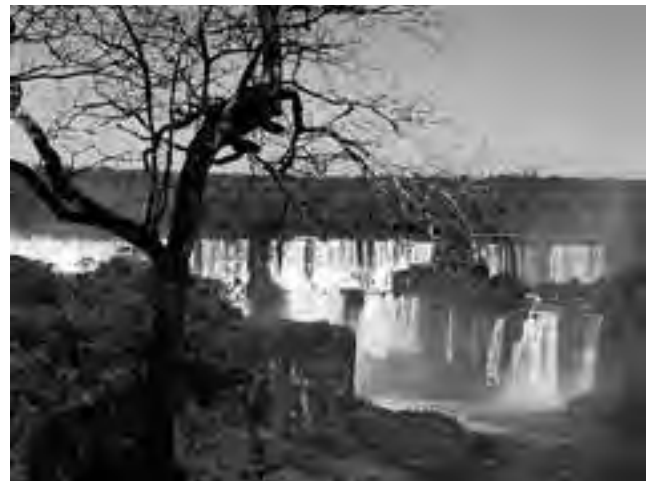
El cálculo oficial supone unos 4,2 millones de pernóctes, con un gasto diario promedio de 305 pesos y la región más visitada, el Litoral Argentino.

El ministro de Turismo de la Nación, Enrique Meyer, anunció que "se espera que 1.261.000 turistas se movilicen por nuestro país logrando así cuadruplicar los resultados de los feriados del 20 de junio de años anteriores que demostraban un promedio de 350 mil turistas, alcanzando de esta manera un resultado histórico".