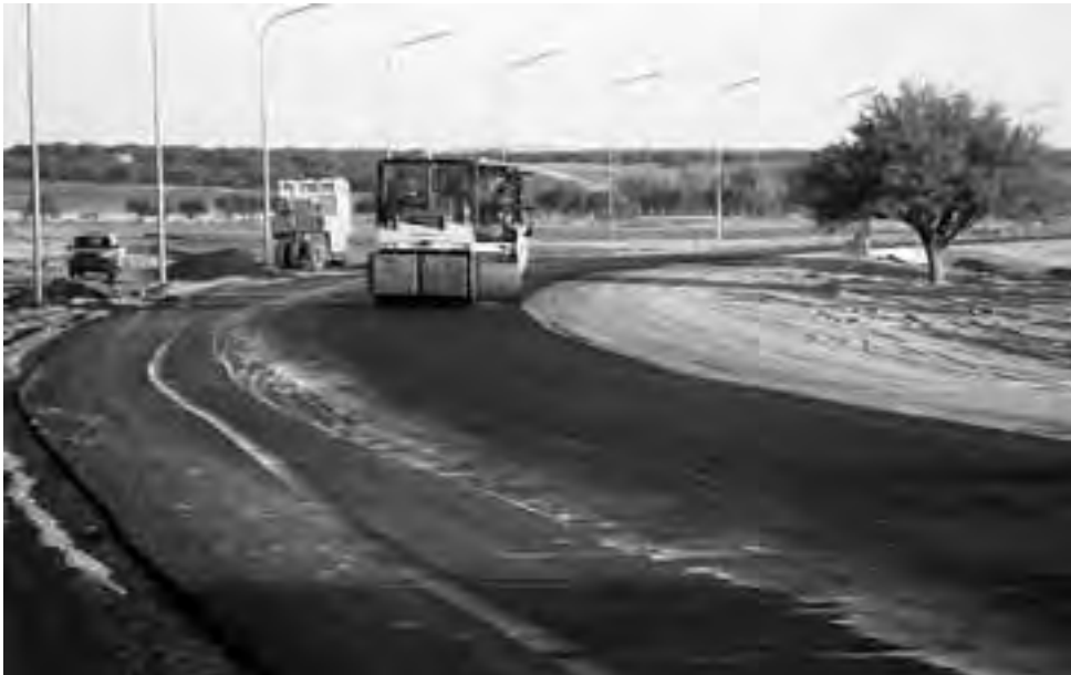
Hace 60 años atrás, en 1953, se creaba la Dirección Provincial de Vialidad de la provincia de La Pampa, cuando la misma contaba con tan solo 40 kilómetros de rutas pavimentadas.

En 1951 el Presidente de la Nación, Juan Domingo Perón, envió al Congreso Nacional el proyecto de provincialización de La Pampa. El impulso final fue dado por su esposa María Eva Duarte con una carta al Senado, donde refiere a la necesidad de cumplir con la Ley N° 1.532. La misma establecía que un Territorio Nacional, para ser declarado provincia, debía contar, al menos, con una población de 60.000 habitantes. Se solicitó entonces la vigencia de dicha ley como un acto de justicia para los pampeanos. Finalmente, el 20 de julio de 1951, el Senado de la Nación sancionó la Ley N° 14.037, mediante la cual los Territorios Nacionales de La Pampa y El Chaco pasaron a ser provincias. Concluía así una larga historia en los intentos de provincialización de La Pampa.