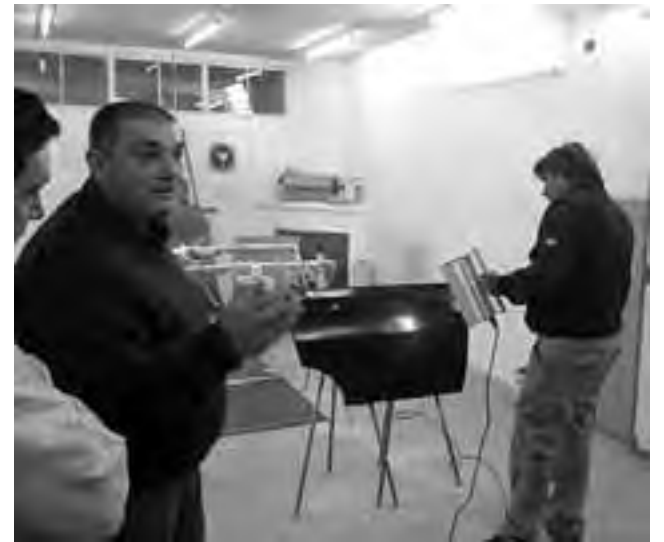
La charla informativa para profesionales propiciada por "Pinturerías Deballi", tuvo una excelente convocatoria, donde participaron profesionales de diferentes puntos de la Provincia.

Recientemente "Pinturerías Deballi" junto a Dupont línea automotor -reconocida marca nacional-, realizaron una charla informativa y presentación de productos dedicada a profesionales en pintura automotriz, llegando a profesionales de diferentes puntos de la provincia.