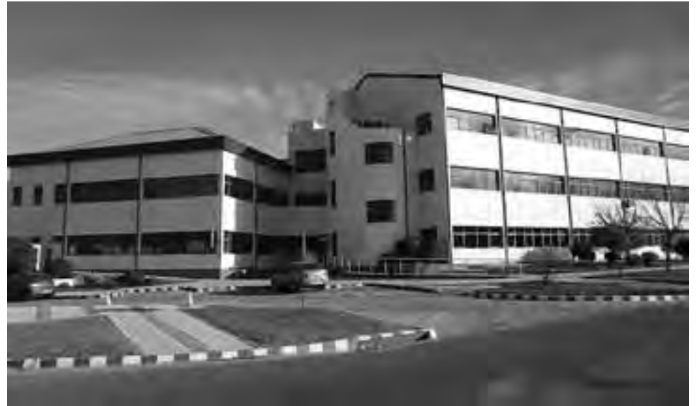
Frete del edificio de la sede central en la Av. Spinetto, en Santa Rosa.

En forma paralela a estas ampliaciones de rutas se efectuaron obras de mejoramiento en caminos vecinales y accesos a localidades del interior. Estas obras fueron realizadas por las Comisiones de Vecinos de: Colonia San José, Gral. Acha, Quehué, Naicó,