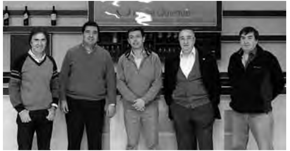
Integrantes de la Asociación Empresaria Hotelera Gastronómica de La Pampa, junto al secretario de Turismo provincial y el intendente de Quehué, durante la visita al hotel de la localidad, recientemente inaugurado.

La capacitación del personal, a través de los cursos dictados por