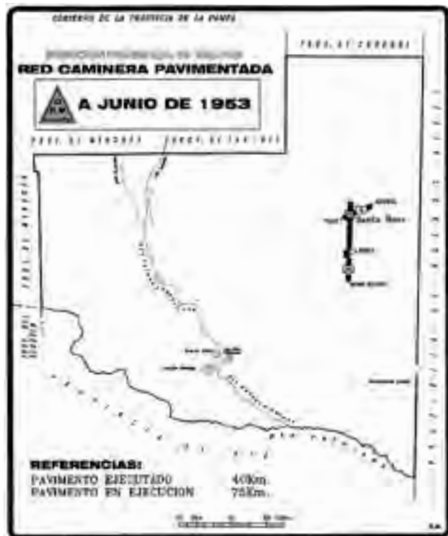
Un mapa histórico, de junio de 1953, 60 años atrás, cuando la provincia de La Pampa disponía tan solo de 40 km de pavimento.