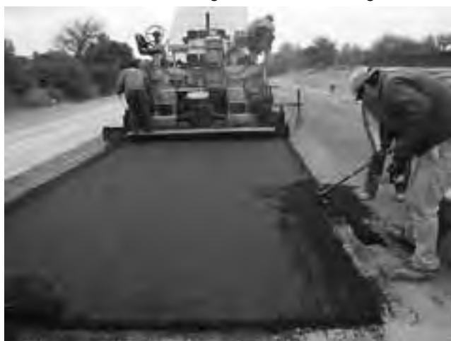
Varias obras están en marcha y otras aguardan el proceso de adjudicación.

Descripción: Los trabajos consisten en la pavimentación de 5,60 km de la Ruta Provincial N° 9 entre los km 216,102 y 221,700. Éste tramo, actualmente de calzada natural, se encuentra entre el Parque Industrial de Toay y el Acceso al Autódromo "Provincia de La Pampa" desde la Ruta Provincial N° 9, y se construirá de manera completa e integral, con terraplenes, y estructura granular (Subbase y Base) de tosca. La pavimentación está prevista con una capa de carpeta asfáltica de 5 centímetros de espesor. Incluye los cruces con la Ruta Provincial N° 14, y otros cruces y empalmes.