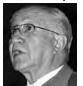
Colaboración: Antonio Torrejón