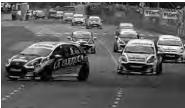
La tercer categoría nacional que se suma es la "Fiat Punto Abarth Competizione"

Calendario 2013 Como para completar la información de carreras automovilísticas en este escenario para lo que resta de 2013, el programa es: -15 y 16 de junio: Zonales Supercar Pampeano, Fórmula Renault y autos con techo. -13 y 14 de julio: Zonales Supercar Pampeano, Fórmula Renault y autos con techo. -13, 14 y 15 de septiembre: Por primera vez viene el Top Race Nacional, con su 9ª fecha. -5 y 6 de octubre: Zonales Supercar Pampeano, Fórmula Renault y autos con techo. -1, 2 y 3 de noviembre: regresa el furor del Turismo Carretera, con la anteúltima carrera del año. -6, 7 y 8 de diciembre: el ya confirmado Gran Premio Coronación del TN. -14 y 15 de diciembre: Zonales Supercar Pampeano, Fórmula Renault y autos con techo.