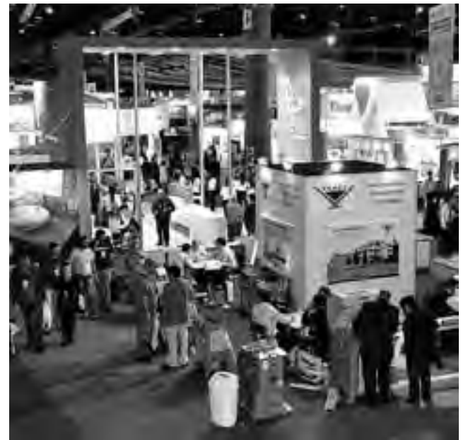
Es del 4 al 8 de junio y contará con 30 mil m2 de superficie.