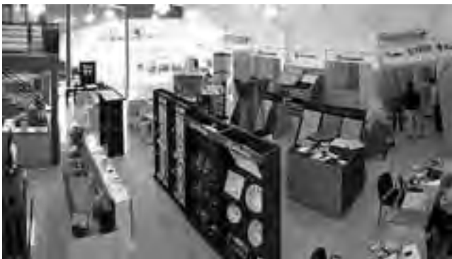
Showroom de Avda. Stgo. Marzo Sur 2.312. También tienen una Sucursal en la localidad de Gral Pico en Ruta 1 Km. 82,5.

Para finalizar aclararon: "Nuestra Empresa ESCOR DESIGN forma parte de una importante red Nacional como es la Red M2 (www.redmetro2.com.ar) compuesta por 23 comercios de distintos lugares del país, orientada a obtener alianzas con las principales marcas a nivel nacional e internacional."