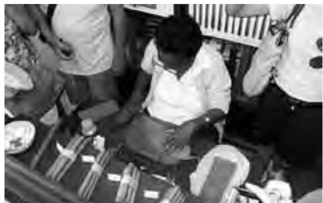
Aprendiendo sobre la fabricación de habanos en La Habana, Cuba.