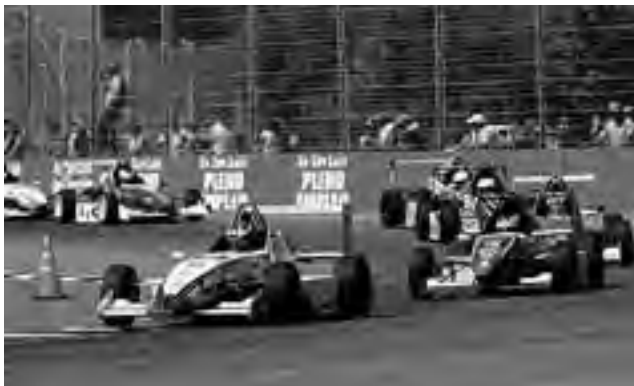
También es la 4ª fecha de la Formula Renault 2,0

VIENE DE TAPA (ver grilla completa de horarios en www.region.com.ar )