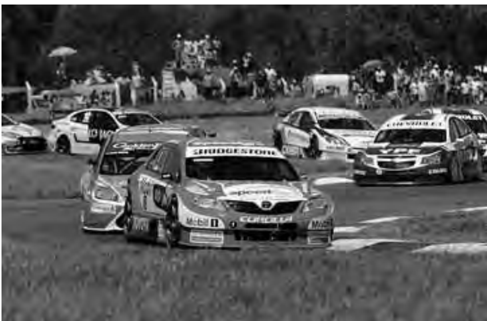
Las entradas cuestan $ 120 la general y $ 320 la preferencial de boxes. Hasta este viernes 31 se pueden comprar en las Cámaras de Comercio de Santa Rosa y General Pico, el sábado y domingo en las boleterías del autódromo.

Turismo Deportivo La Secretaría de Turismo viene trabajando activamente en la promoción de este segmento del "Turismo Deportivo", que se hace notar incorporando un gran movimiento turístico, gastronómico y hotelero, durante los días de la actividad propiamente dicha y también previamente. La ciudad como siempre, se prepara para recibir a los visitantes, con variados espectáculos, para todos los gustos, como se puede apreciar en nuestra sección específica.