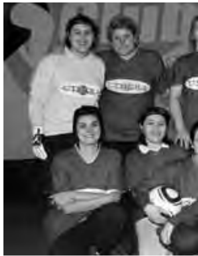
Equipo femenino de fútbol de UTHGRA, gana

Los ganadores fueron beneficiados con diversos premios para cada una de las categorías, los cuales aumentan año tras año de acuerdo a la realidad económica del país, pero siempre satisfaciendo a los competidores.