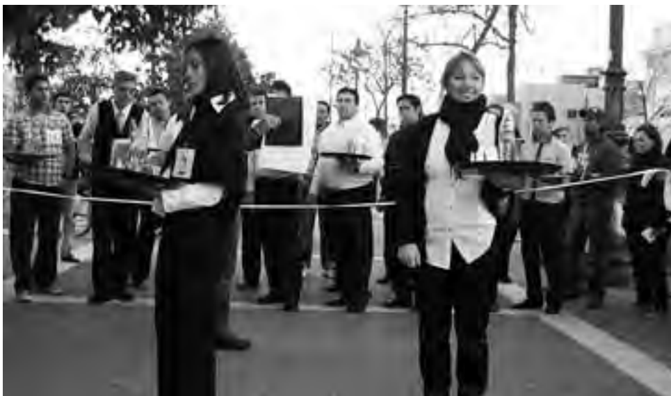
Todos los años se realiza la carrera de mozos y camareras en la Plaza San Martín para festejar la fecha.

La cena del trabajador gastronómico "es una verdadera fiesta en celebración a los incansables trabajadores que día a día desarrollan una labor fundamental de atención y servicio", tal como lo destacó la Secretaria General de la UTHGRA,