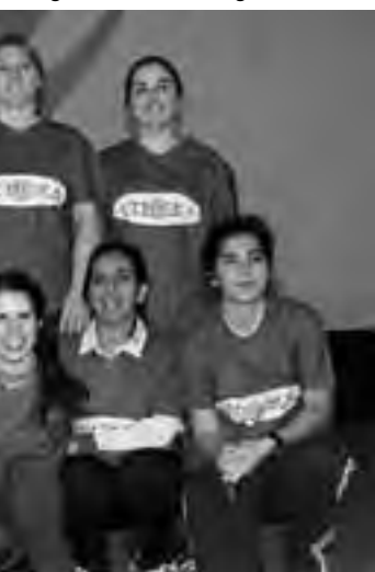
Las ganadoras del campeonato en su categoría.

1° Lugar: Rotisería Cumelcan 2° Lugar: Stones Bowling