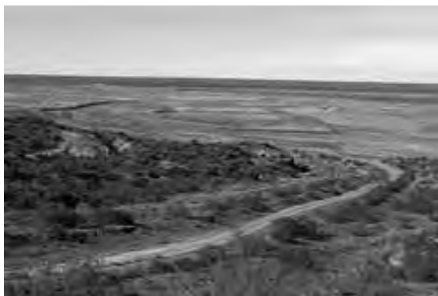
El contraste entre el río y el desierto permite transformar la aridez en vida y es ése el entorno que el visitante podrá descubrir.

La fecha de fundación del 26 de julio de 1909, corresponde al decreto nacional de "creación de la Colonia Agrícola y Pastoril 25 de Mayo".