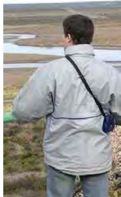
Desde el "Mirador de las Cuatro Provincias" puede verse la Toma Libre del río. El Puente Dique...

La propuesta para una visita turística es tomar como punto de partida el Mirador de las Cuatro Provincias. Es el espacio apto para la interpretación ambiental.