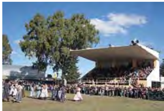
La Expo en 2011. Este año será del 5 al 7 de octubre, la N° 86.

La Asociación Agrícola Ganadera de La Pampa cumple un nuevo aniversario, el número 94 en la historia de esta institución, creada el 28 de julio de 1918 y que con el correr del tiempo se convirtió en una de las principales entidades de la Provincia de La Pampa.