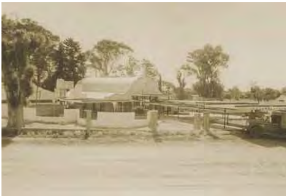
Foto antigua del ingreso central de la Agrícola, cuando aún la colectora de la Av. Spinetto era de tierra.