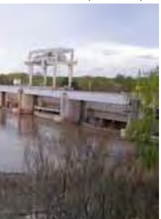
que Derivador de 25 de Mayo, reña rionegrina

l Río Colorado y también interpre- el paleocauce a partir de vestigios e ha dejado en la zona el paso l agua. Las bardas desnudan siglos procesos y exponen estratos de tintos momentos que la interpre-