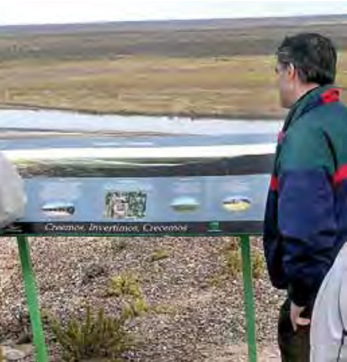
apreciarse el Puente Dique «Punto Unido» como un punto en el recorrido del río, así como es el regulador de caudal y ruta de tránsito desde La Pampa hacia Río Negro.

l Río Colorado y también interpre- el paleocauce a partir de vestigios e ha dejado en la zona el paso l agua. Las bardas desnudan siglos procesos y exponen estratos de tintos momentos que la interpre-