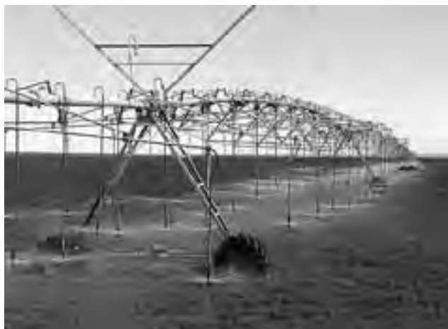
Reviste gran importancia en la zona la producción de forrajes (alfalfa), donde se pueden apreciar siembras en grandes áreas bajo riego por aspersión, con moderno equipamiento de pivotes centrales.

25 de Mayo tiene numerosas escuelas, el Hospital "Jorge Ahuad", en el pueblo funciona el Ente Provincial del Río Colorado y en número de pobladores de planta urbana, en las últimas décadas ha desplazado a otras localidades que históricamente eran más habitadas.