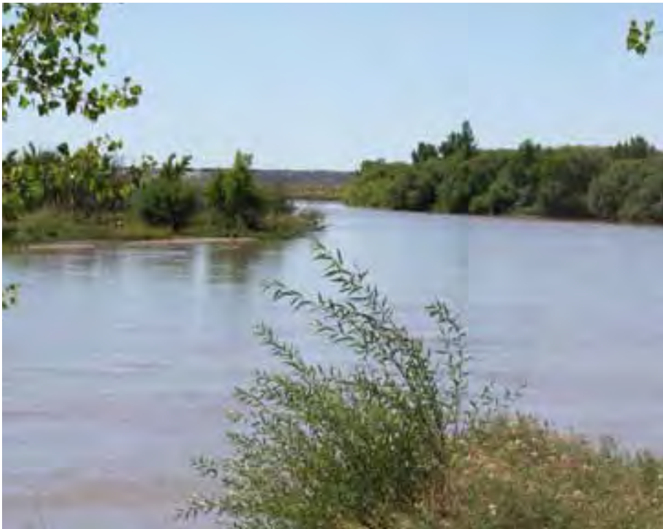
Río Colorado a la altura de llegar al Puente Dique, en el ingreso a la localidad de 25 de Mayo. El entorno natural y la gran circulación de turistas hacia convocantes destinos, le ha permitido un crecimiento destacado de servicios al viajero en esta localidad pampeana, aunque resta mucho por hacerse, ya que la mayoría de las inversiones giran en torno al boom petrolero.

Ubicada en el extremo sudoeste de La Pampa, la localidad pampeana de 25 de Mayo se erige como el primer alto en el camino, después de atravesar el desierto. Se encuentra a 411 Km. de Santa Rosa y a 150 Km. de la ciudad de Neuquén.