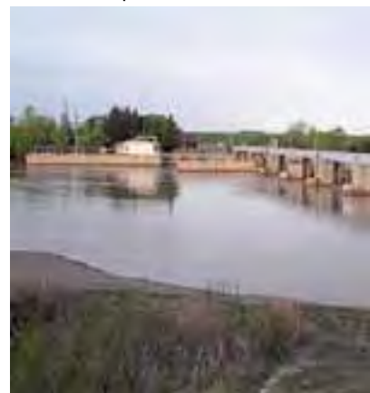
Embalse del Río Colorado en el Puente Dique visto desde la margen ribera...