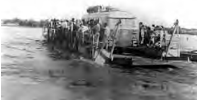
Antigua balsa con la que se cruzaba el Río Colorado entre Catriel y 25 de Mayo, antes de la obra del Puente Dique Punto Unido.

Entre 1950 y 1960 se dieron los pasos para el futuro aprovechamiento compartido del Colorado y en cuanto a 25 de Mayo, se conformó definitivamente la localidad, alimentada por el regadío, fundamental en un área de pocas lluvias anuales. El municipio de 25 de Mayo tiene un amplio radio, que tiene como límites al propio río, al meridiano oeste de nuestra provincia y a los ejidos de Limay