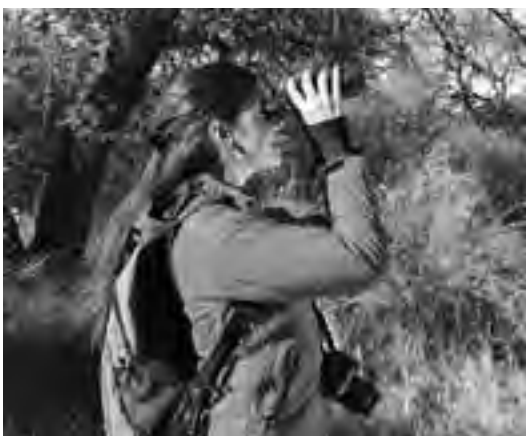
Más de 1.000 personas por fin de semana visitaron la Reserva haciendo uso de los servicios y visitas guiadas de historia y de naturaleza.

La afluencia de turistas durante los días de vacaciones de invierno provocó un importante movimiento en la provincia de La Pampa, superando todas las expectativas, y dejando, a lo largo de todo el país, saldos muy productivos.