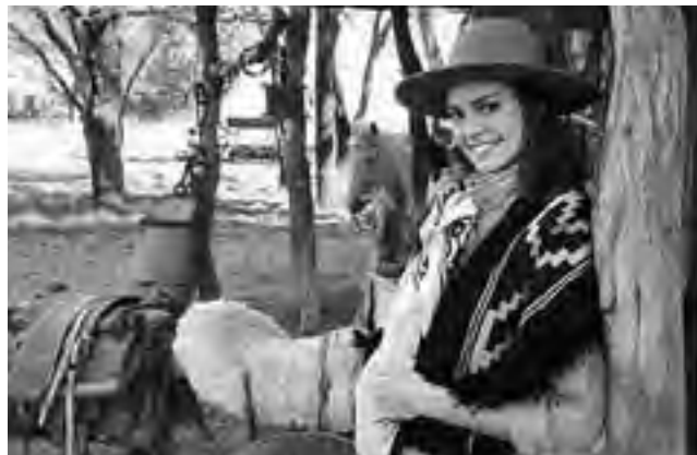
Nuestra Provincia promueve a nivel nacional, su propuesta turística ligada al entorno rural y de naturaleza, impulsada como «La Pampa Auténtica».

Como anticipamos la semana pasada, en 2012 habrá 3 periodos de receso escolar, de dos semanas cada uno, por lo que todo el mes de julio completo será turístico, augurando una importante temporada de «vacaciones de invierno».