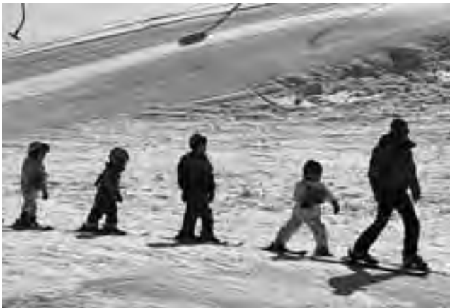
Uno de los destinos que atrae en esta época, son los escenarios de nieve en nuestra Patagonia, que auguran una buena temporada turística.