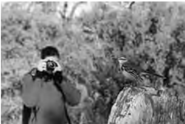
La Pampa durante todo julio recibe turistas desde distintos puntos del país, la tarea de siempre, es formular actividades que alarguen la permanencia de los mismos.

Finalmente el turno es de la Ciudad Autónoma de Bs.As., más las provincias de Buenos Aires, Catamarca, Entre Ríos, Jujuy, Misiones, Salta, Santa Cruz, Santa Fe y Santiago del Estero, permitiendo iniciar las salidas turísticas a las familias con niños en edad escolar, desde el sábado 14 hasta el domingo 29 de julio.