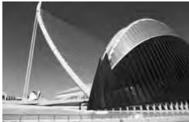
La «Ciudad de las Ciencias y de las Artes» en Valencia, España, es en sí misma, una de las obras de arte de la arquitectura moderna. Un complejo futurístico de singular belleza. Su diseño corresponde al arquitecto Santiago Calatrava.

Este domingo 1º de julio, la Federación Argentina de Entidades de Arquitectos (FADEA), celebra el Día del Arquitecto Argentino, fecha que tiene su origen en 1985, cuando la Unión Internacional de Arquitectos (UIA) dispuso establecerla como Día Internacional de la Arquitectura, recordando así la fecha de creación de esta entidad, realizada en Suiza el 1º de julio de 1949.