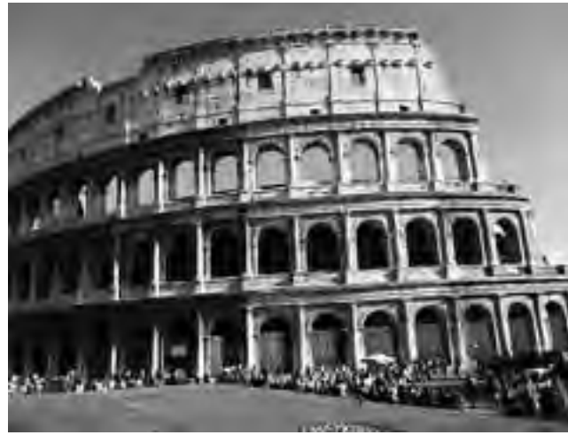
Roma es considerada "la bella ciudad de las artes", rica en arquitectura, tiene al Coliseo Romano -anfiteatro construido en el Siglo I- como uno de los ejemplos mejor conservados de la arquitectura romana.

La evolución a la especialización y la separación de ámbitos laborales es similar a la de otras profesiones. En los siglos pasados los arquitectos se ocupaban no sólo de diseñar los edificios sino que también diseñaban plazas, alamedas y parques, especialización que hoy se conoce como exteriorismo o paisajismo. La especialización de los arquitectos en la creación de objetos de uso en las edificaciones, como los muebles, ha dado como resultado el nacimiento de la profesión de diseño industrial. Hoy, los profesionales que proyectan y planifican el desarrollo de los sistemas urbanos son los urbanistas.