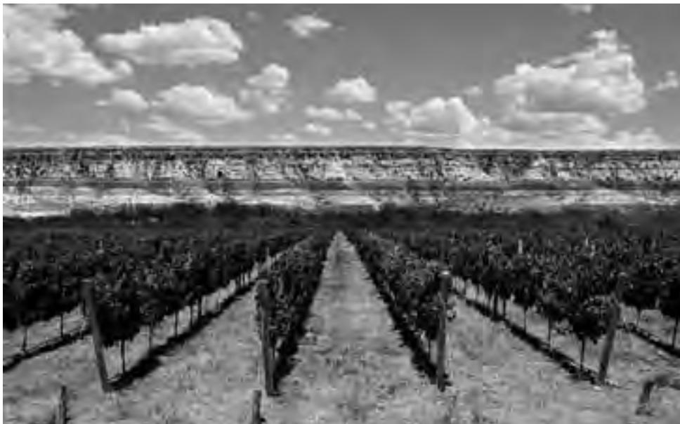
El aprovechamiento integral del Río Colorado en el desierto pampeano logrado por el EPRC en este medio siglo, permitió que inversores privados colocaran a La Pampa en lugares de fama por la elaboración de excelentes vinos, como los de 25 de Mayo y Gobernador Duval. Ahora podría sumarse Casa de Piedra, con una de las bodegas más importantes del país.

Funcionó con esa denominación hasta el año 1966. Por Decreto Acuerdo 775/66 se intervino el Organismo y por Ley 441 del mismo año se lo denominó Secretaría de Planificación y Desarrollo de la Cuenca del Río Colorado, hasta que el 25 de septiembre de 1968,