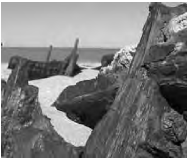
Semisumergidos en la orilla u ocultos a distintas profundidades, el Mar Argentino y el Río de la Plata albergan a lo largo de sus 4.700 kilómetros de extensión cientos de barcos naufragados que esperan poder contar su historia de tempestades insalvables y cotidianidades de otras épocas.

El Programa de Arqueología Subacuática del INAPL (Instituto Nacional de Antropología y Pensamiento Latinoamericano) está confeccionando un listado de embarcaciones hundidas en el Río de la Plata y el Mar Argentino,