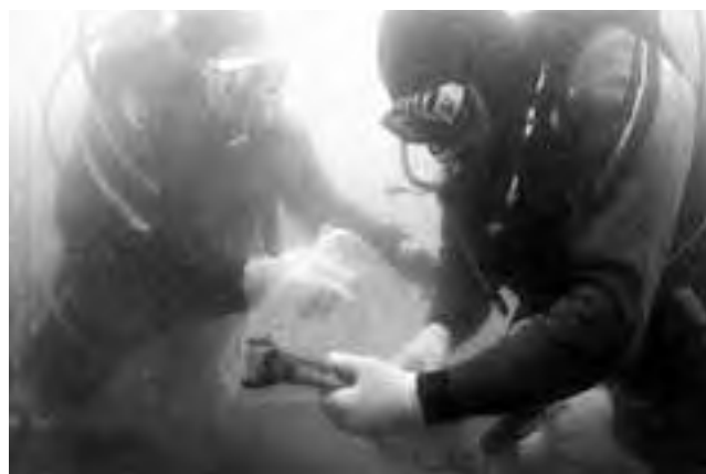
Hace dos años, en julio de 2010, pudo verse el documental “Swift dos siglos bajo el mar” donde se recrea la historia de la Corbeta Swift.

y entonces se dispone de una réplica que flota, que pueden incluso salir de los puertos y hacer viajes de recreación histórica; pero el objetivo es más turístico o de divulgación que científico”, contó Elkin.