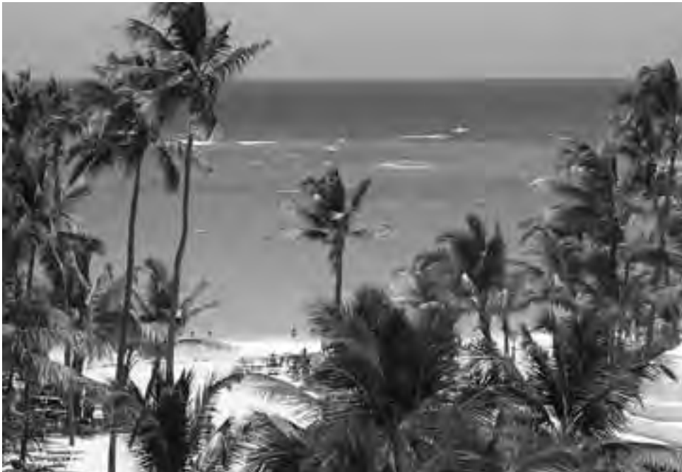
Si hay una postal clásica del Caribe es Punta Cana, 420.000 m2 de belleza donde lo que se destaca son sus 50 kilómetros de playas, de arenas blancas, finas y mar turquesa. Importantes excursiones están vinculadas.

La historia de Punta Cana comienza hace pocos años, en 1969