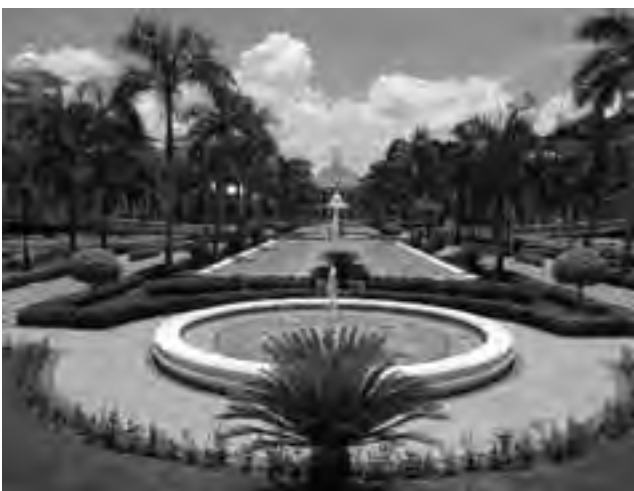
Los complejos «all inclusive» más importantes del mundo hacen presencia con establecimientos deslumbrantes, como el «Riu Palace», un 5 estrellas excepcional.

el pueblo, el anfiteatro y comer platos nativos.