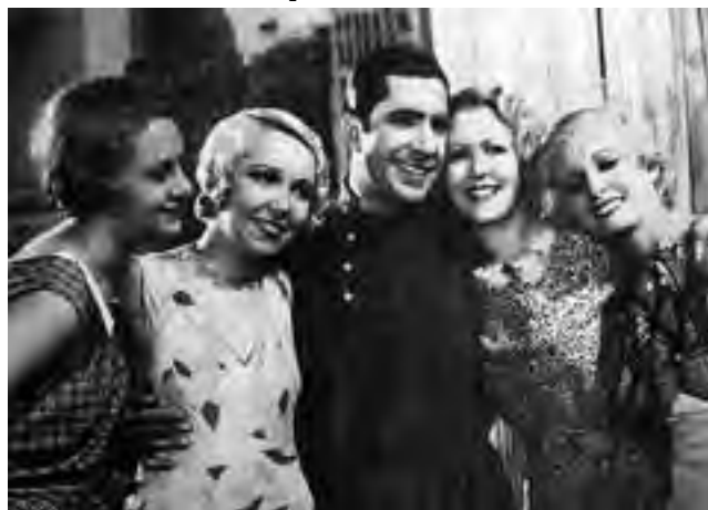
Carlos Gardel y las "Rubias de New York" durante la filmación en Estados Unidos de la película que llevó el mismo título del foxtrot de Gardel y Lepera.

El lugar de su nacimiento -hoy develado con claridad-, fue de gran