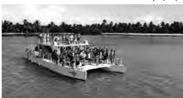
En Marinarium es posible sumergirse para ver los peces y los arrecifes de coral.

Esta villa mediterránea, ubicada en la zona de La Romana, es un lugar tranquilo y de inspiración. La atraviesa el río Chavón y se puede conocer sus museos, conocer