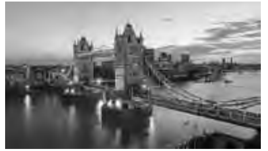
"Tower Bridge", el puente de la Torre de Londres sobre el río Támesis, un ícono de la ciudad.

Los famosos tulipanes y los molinos que la rodean, son las postales típicas de este sitio tan pintoresco, asentado en decenas de islas unidas por centenares de puentes. Conocer Amsterdam es abrir una caja de sorpresas, donde se combinan arquitectónicamente el Barroco Holandés con diseños del Renacimiento y la modernidad. Entre los sitios de interés, la Casa de Ana Frank es hoy un testimonio del Holocausto y lugar de visita turística. Otro es el Mercado de las Flores con sus puestos flotantes situado en el Singel y en el campo cultural, el Van Gogh Museum, que acoge la colección más extensa del pintor