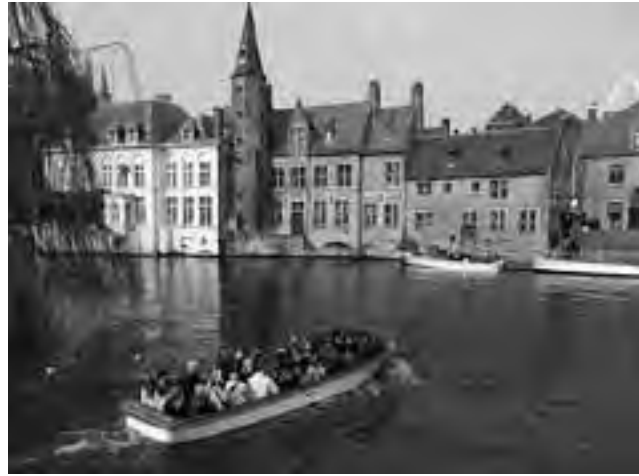
Tanto Brujas como Amsterdam, tienen en sus canales el mejor paseo turístico, donde se consiguen fotos magníficas de lugares imposibles de apreciar a pie.

Desde hace un mes y medio (ver REGION ® N° 1.032 al 1.037) venimos publicando este informe de viaje que consta de 8 partes. En las primeras resumimos el recorrido de un Crucero Transatlántico de 20 días, con partida desde Buenos Aires y destino final Valencia. Luego comenzamos con el trazado propuesto en tierra, en auto previamente alquilado.