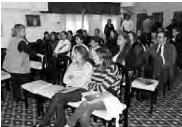
Curso de nivelación previo al Torneo realizado el miércoles 25 en Hotel Calfucurá.