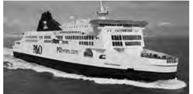
Para ir a Londres en auto, el mejor cruce del Canal de La Mancha es por Calais -Francia- hasta Dover -Inglaterra- en ferry. También se puede hacer en tren por el 'eurotúnel' -es más rápido y más caro-, pero se pierde el atractivo del viaje.

Londres es una ciudad inmensa que alberga múltiples culturas. Está situada en el río Támesis, al sureste de Inglaterra y conforma la capital del Reino Unido. No es difícil trasladarse en ella, a pesar de su gran tamaño, porque tienen una buena red de metro -'tube', muy extensa y bien conectada.