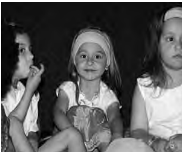
Con una actuación teatral y musical donde participaron todas las salitas del Jardín de Infantes "Garabato", la institución educativa de Santa Rosa despidió el año junto a los padres de los alumnos, en el escenario del Cine Don Bosco.