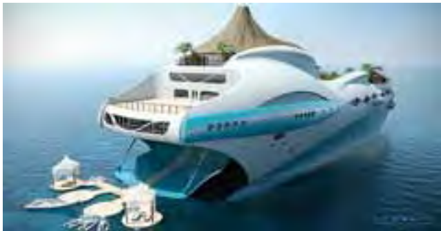
La cubierta playera retráctil hace accesible nadar en el mar.

El diseño del volcán le agrega encanto a la isla y tiene una vertiente de agua que fluye en la piscina creando un río extraordinario, completando el look tropical. En la parte trasera, el yate tiene una cubierta playera retráctil donde las estructuras flotantes hacen accesible nadar en el mar y por supuesto, acceder a distintas actividades marítimas como wakeboard y jet sky. El concepto es genial y el resultado aún mejor Colaboración: "GringoMan"