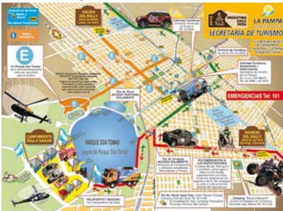
La Secretaría de Turismo de La Pampa ya está informando a los visitantes sobre detalles de la competencia como: lugares de estacionamiento, circulación de la carrera, servicios en la ciudad y zonas de camping.