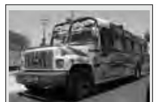
Las Chivas son autobuses típicos de Colombia adaptados en forma artesanal para el transporte público, pensando especialmente en la montañosa geografía de la Región Andina de este país. Se caracterizan por su gran colorido, predominando el amarillo, azul y rojo, colores de la bandera.

Entre las playas urbanas más famosas debemos nombrar las de El Rodadero. También se destaca como zona de buceo.