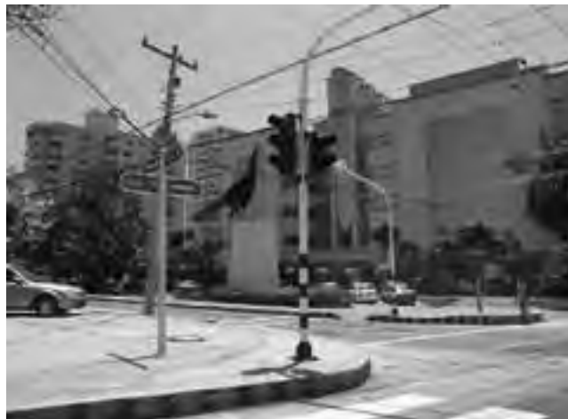
«Se va el caimán, se va el caimán, se va para Barranquilla...» y hasta allí fuimos, siguiendo los compases de la música que ahora sabemos se inició en Valledupar, otro hermoso lugar de Colombia que nos quedó para la próxima visita.

A pocos kilómetros del centro de la ciudad, el visitante puede caminar por el viejo muelle de Puerto Colombia, donde durante la última década del siglo XIX miles de inmigrantes provenientes de Europa y el Medio Oriente desembarcaron en busca de oportunidades.