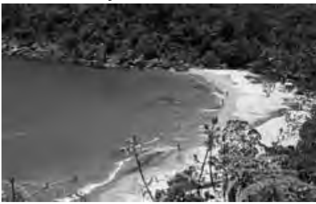
«Jabaquara», una playa virginal con forma de media luna, de medio kilómetro de extensión, con aguas cristalinas, limpias, rodeadas de abundante vegetación.

Es un ejemplo de naturaleza salvaje, donde las embarcaciones de paseo buscan recalar a la hora del almuerzo. Una playa virginal