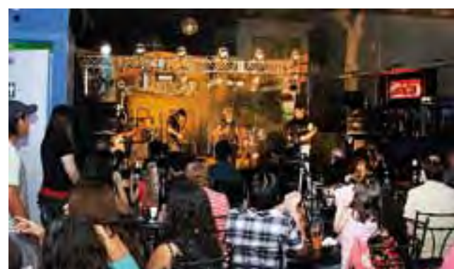
En su actuación el grupo "ROCKO" con buen número de espectadores.

Un nuevo grupo de rock integrado por jóvenes músicos de Santa Rosa tuvo su primera actuación en público el pasado viernes 16 en "Angeles del Marconi", como teloneros de la banda R.I.T.O.