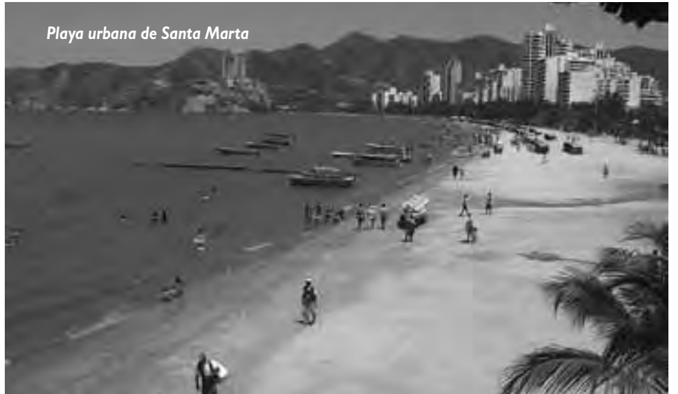
Playa urbana de Santa Marta

Barranquilla, destacado evento cultural. Tiene sitios turísticos muy hermosos como Bocas de Cenizas (donde se une el Río Magdalena y el Mar Caribe) y ricos antecedentes como el primer zoológico que se inauguró en América latina, el estadio metropolitano (el más grande de Colombia), el Puente Pumarejo (el más largo del país), el muelle de puerto Colombia y el Museo Romántico, por nombrar algunos.