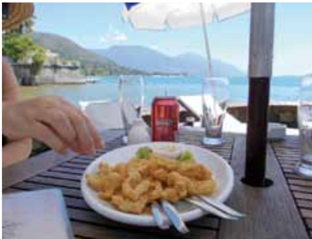
El ritmo actual de vida, cada vez más acelerado, repercute considerablemente en nuestra alimentación y hábitos dietéticos. Son muchos los que durante el año apenas desayunan o almuerzan y en vacaciones hacen del desayuno un almuerzo.

Según la Organización mundial de la Salud (OMS): "Salud es un