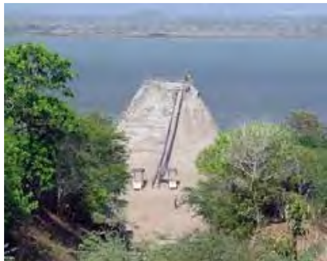
A 60 km de Cartagena, camino a Barranquilla, está el Volcán del Totumo. Los turistas van bañarse en su interior con lodo, de propiedades curativas. El acceso es a través de una escalinata hasta la boca del volcán.

Esta es la tercera y última nota sobre Colombia, teniendo como base de movimiento la ciudad de Cartagena de Indias, de la cual hablamos en las anteriores dos ediciones. En REGION® N° 1022 sobre su historia, la zona moderna de Bocagrande y la exquisita Ciudad Antigua. En REGION® N°